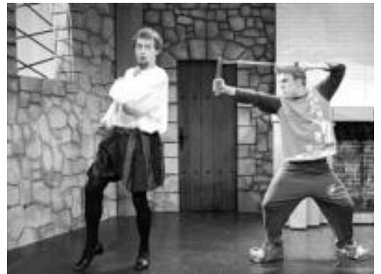
Cantervilleko mamua obraren irudi bat. HITZA

Ingalaterrako gaztelu batera bizitzera doan ohiko amerikar familia baten bizimoduaren berri ematen du antzezlanak. Gaztelu hori, ordea, Cantervilleko mamu izugarriaren bizitokia da. Familiak, eta batez ere umeek, mamua zapuztuko dute, izutu beharrean haren