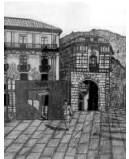
Tolosako Trianguloaren marrazkia. I. ASENSIO