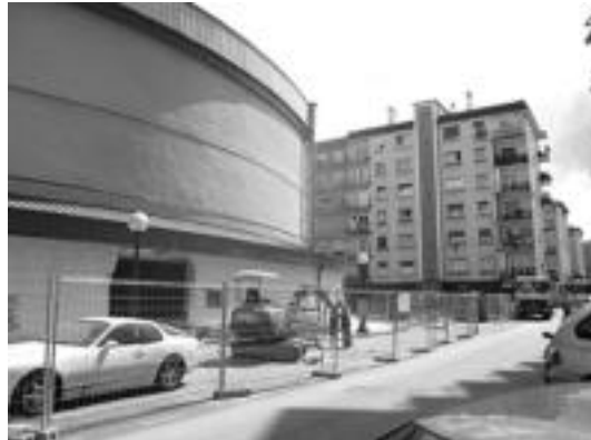
Lanak amaituta, zine-klub saioak berriro Leidorren izango dira. J. SAIZAR

Tolosako Zine-klub taldeak proposamena luzatu zion Udalarari; berritze lanak amaitzean jarriko dute abian