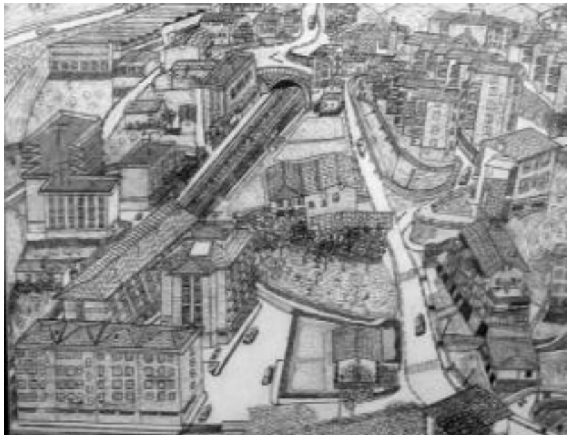
Anoetako herria Nuñezen hainbat marrazkitan ageri da; gainean, herriaren panoramika. I. ASENSIO