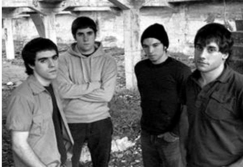
Pasa den urteko udan kaleratu zuen lana aurkeztuko du gaur Elorrioko Lor laukoteak Gaztetxean. LOR

Lor talde bizkaitarrak bere azken lana, 'Bakoitzari berea', aurkeztuko du; 22:30etik aurrera izango dira kontzertuak