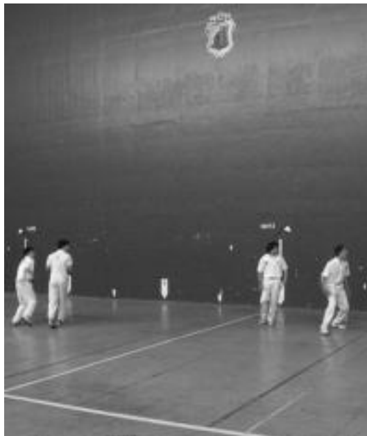
Aurrera-Saiatzeko pilotariak, Udaberriko Txapelketa jokatu. N. URBIZU

Zazpi-Iturri Amezketan hartuko ditu lehiakide gehienak 16:00etan. Ropon-Legarreta gazteek Lemoakoekin kontra jokatu dute. Nagusietan, Baez