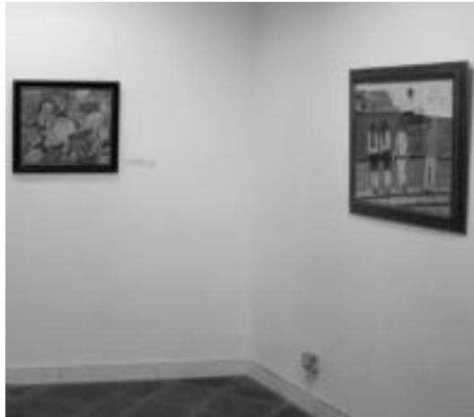
Luis Maria Nuñezen pinturak, Aranburu Jauregian. I. ASENSIO

igandearrekin, La mascara 2 filma izango da ikusgai Bonberenean, 19:00etan.