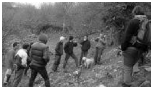
Beizama inguruetara irteera egin zuten igandean.

‘La senda aborigen’ liburuaren aurkezpenaren ondoren sortu den interesa bideratzeko bilerara deitu dute gaur