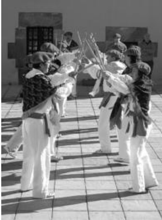
laz bezala, aurtien ere Otsolar-ek dantza saioa eskainiko du. i. r.

Tradizioari jarraiki, gibel jatearekin emango diete herritarrek Inauteriei hasiera; bi asteburuetan banaturik askotariko ekitaldiez gozatzeko aukera izango da