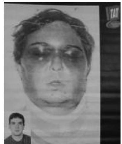
Unai Romanoren buruak Guardia Zibilak atxilotu ondoren zuen itxura ageri da panel batean. HITZA

ENBALAJE INDUSTRIALA egiteko mutil bat behar da iluntzeko 20:30etik aurrera deitu Tel.: 651 657 982