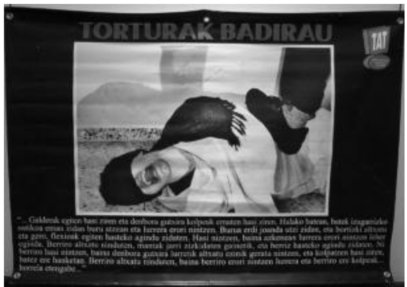
Kolpeak sarritan agertzen dira paneletan erakusten diren testuetan. HITZA

Erakusketa zabalik izango da gaur eta astelehenean, 11:00etatik 13:00etara eta 16:00etatik 20:00etara, eta bihar eta etzi eguerdi inguruan.