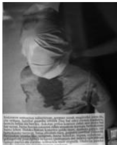
Poltsarena egin zaiela, hau da, arnasik gabe uztea, salatzen dute testuetan tortura jasandakoek. HITZA