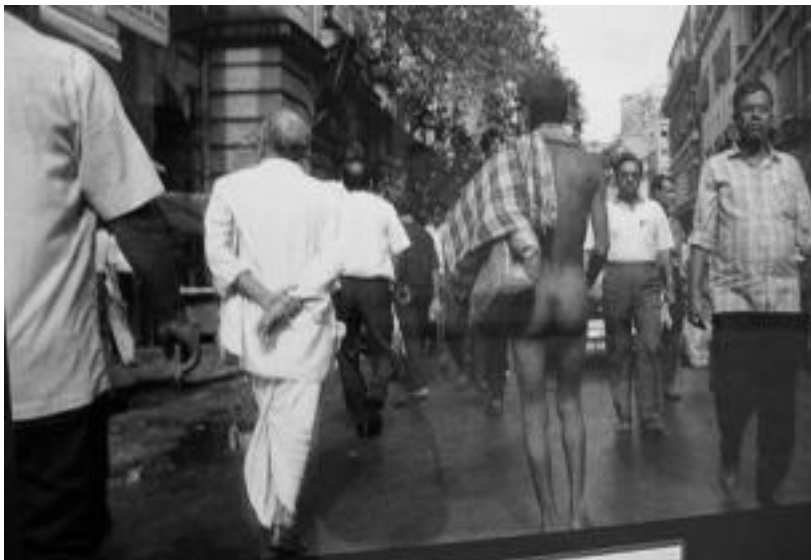
Calcuta. Hiri handi gisara leku gogorra dela dio Calcuta Ondoan elkarreak; «batzuentzat biziraupena egunean eguneko da». Argazkiari dagokionez, hiriko egoeraren adibide moduan, jendeak bilutsik ageri den gizonari ez diola arretarik eskaintzen azaldu dute elkarteko kideek. HITZA