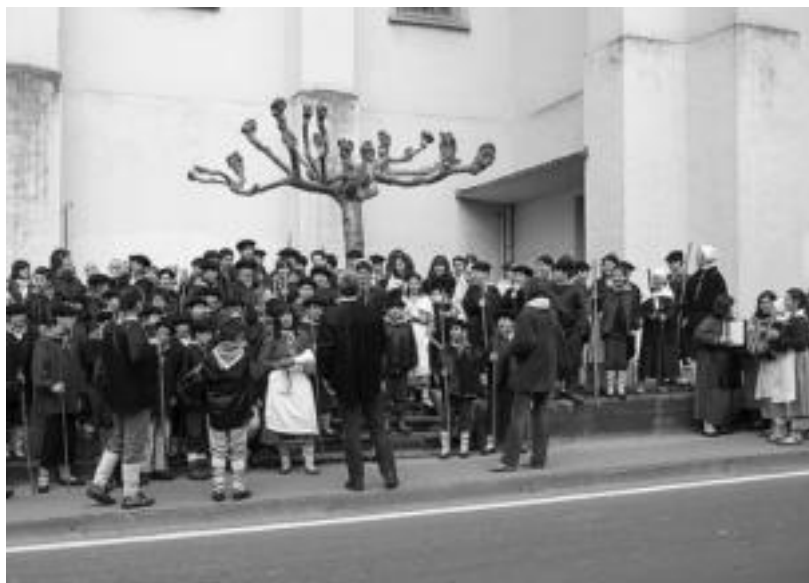
Bihar, batean eta bestean, Villabonako hauek bezala, kopia kantari aterako dira adin guztietakoak. J. ASTIBIA

Goizetik hasi eta gaueraino, herrietako kale nahiz baserri ataritan, non-nahi, trikiti, pandero eta makilen erritmoan, koplak entzuteko eta kantatzeko aukera