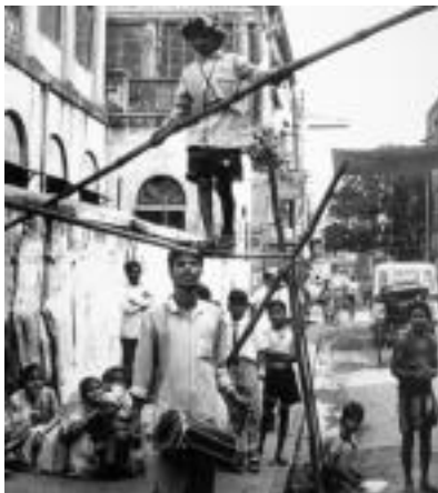
Kaleko haurrak. Egutero 10-16 orduz lan egitera behartuta daude. Askotariko lanak egiten dituzte: zaborrak bildu, hiriko mafiarentzat mezulari lana egin, droga salmenta, prostituzioa... HITZA