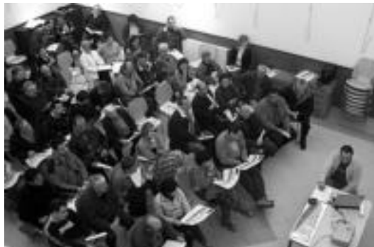
Atxulondo kultur etxean egindako bileraren une bat. HITZA

Iturriak. Hasiera batean 4 iturri ipiniko dira: hiru paseale-