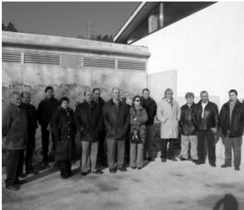
Bertaratu zirenek proiektuaren berri izan zuten. N. URBIZU

Proiektu honen barne beste hainbat lan ere egin dituzte: iturburutako eramandideak, Ibiurko sarea...; hornitu beha-