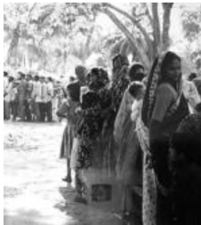
Kontsultak. Larunbatero oso ilara luzeak sortzen dira Ashabariko kontsultan. Oraindik urtebete ez badarama ere, ospe handikoa da inguru osoan. 15 kilometroko distantziatik joaten da jendea. HITZA