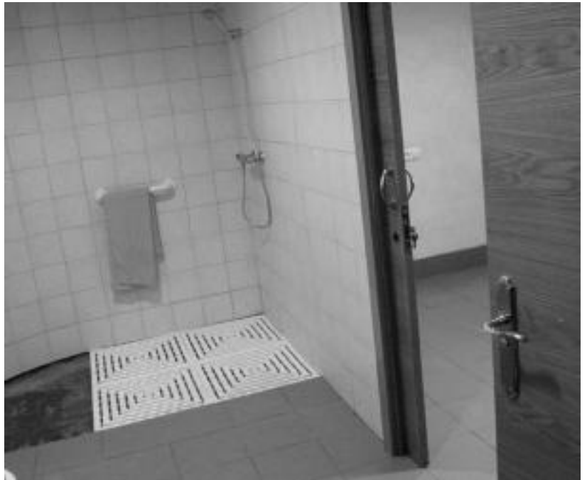
Kalea baserriko komuna aproposki dago prestatuta, dutxa zoruaren maila berean.