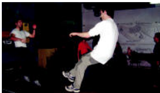
Anoetarrak, entseguan, Gaztebxean. HITZA

Antolatzaileak «oso gustura» daude deialdiak izan duen erantzunarekin ▶ 5