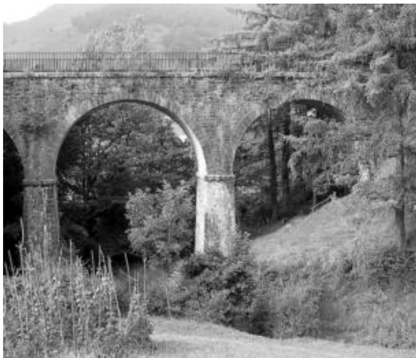
Plazaolako bide berdeak ur-ixuriaren bi aldeetara dauden Leitzarari eta Larraun ere zeharkatzen ditu. J. A.