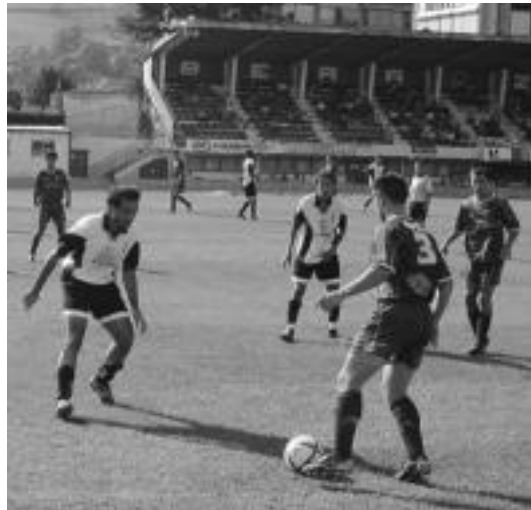
Joaneokan berdinketarekin amaitu zuten Agurainen aurkako. I. GARCIA

Sailkapeneko goiko postuetan dago kokaturik taldea; hurrengo larunbatean Eibarren aurka egingo du etxean