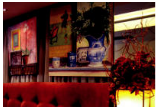
Tolosaldeko txokoak, Nafarroakoak, bodegoiak, loreak... Denetarikoa gaiak jorratu ditu artistak erakusgai jarri dituen hamabi lanetan. LEIRE MONTES