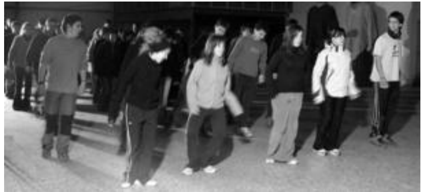
Dantzariak asteazkenero biltzen dira Edurkako pabilioietan entseguak egitera.