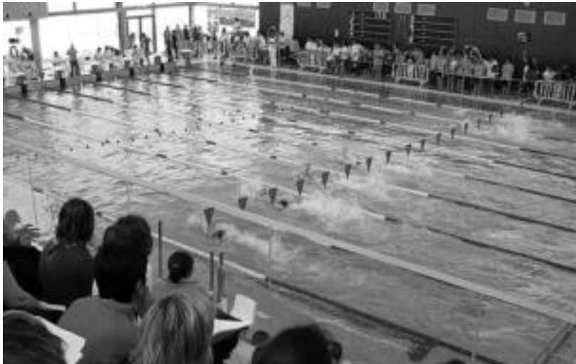
Jende andana bildu zen Usabal kiroldegiko harmailetara, igerilariei arnasa emateko. JAIONE ASTIBIA