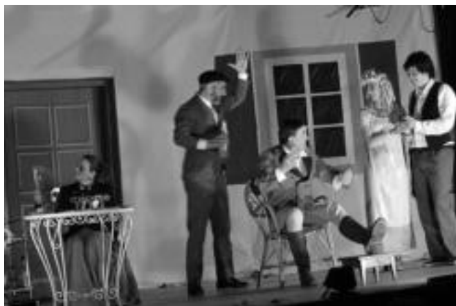
'Hazparneko anderea'. Hasi eszenografiatik eta aktoreen lanera, lan bikaina egin zuten guztiak: osagarriak, arropak eta orrazkerak, pertsonaiak, arlo teknikoak... Urtebetean landu eta lortutakoa agertu zuten zinema bete jenderen aurrean. J. ASTIBIA