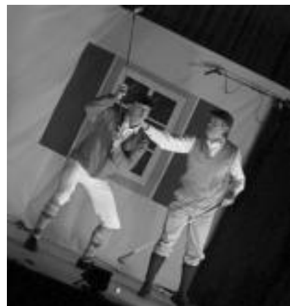
'Golf(keri)an'. Aktoreak batzuk urduri, besteak batere ez, guztiak oso gustura aritu ziren, makina bat alditan ikusleak algarak eraginez. J. ASTIBIA