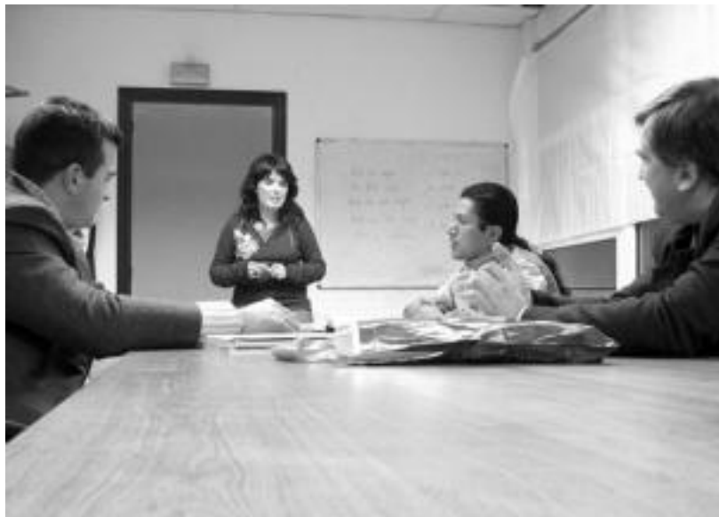
Zizurkilgo Atxulondo kultur etxean ematen dituzte Aisa ikastaroko eskolak. I. GARCIA

«Euskara barneratzen hastea da helburua. 60 orduko ikastaroa da, astean 6 ordu. Oso denbora gutxi da, baina euskaraz eta kulturaz pixka bat jabetzeko balio die. Gero euskara ikasteko euskaltegi-etara joateko aukera dute, gu-