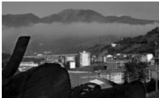
Pasa den urteko abenduaren bildu ziren Uzta eta Ibarrako alkatea. I. T.

Uzta alkateak eginiko proposamenaren aurrean edozein erantzun eman aurretik ondorengo azpimarratu nahi duela azaldu du: «Illegalizazio politikaren ondorioz 842 ibartarren eskubide zibil eta politikoak urratuak daude; ibartarrok boto bidez hautatutako bost zinegotzi Udaletik kanporatuak daude lege antidemokratiko