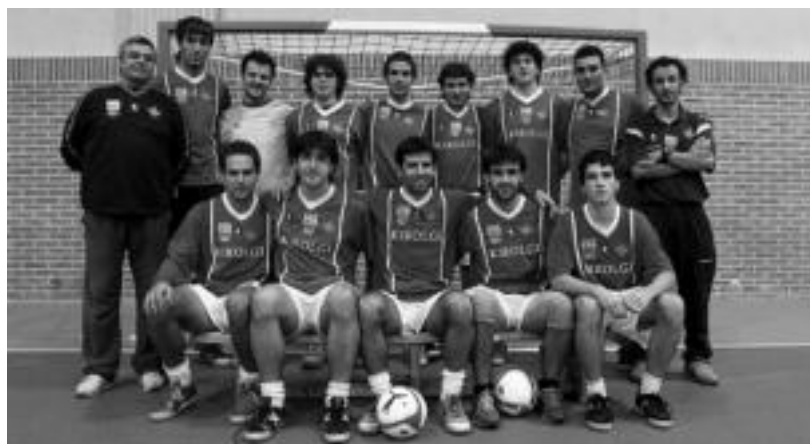
Berdinketarekin konformatu beharra izan zuten ibartarrek larunbatean jokaturiko partidaren. i. t.

2-2 bukatu zen larunbatean jokaturiko partida; epaileek «ez zuten maila ona eman eta etxekoen alde egin zuten»