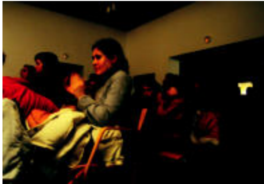
Aranburu Jauregiko aretoa, jendez gainezka. I. ASENSIO