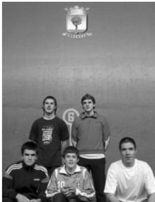
Amezketan aldeko pilotari hauek txapelketetan parte hartzen dute. N. U.

Jokatutako partidak borrokatuak izan dira, eta emaitzak parekatuak