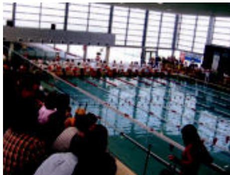
Harmailak bete jende bertaratu zen. Hauen eta kideen animoekin aritu ziren kirolariak J. ASTIBIA