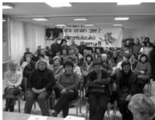
50 lagun inguru bildu zen Gerontologikoan egindako bilerara. I. GARCIA

'Eta orain zer?'-eko kideek bilera egin zuten atzo eta etorkizunerako ekintzak zehaztu