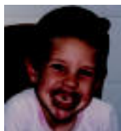
URTE ASKOAN Egoitz Buldain. Bihar 6 urte. Zorionak etxekoan partetik.