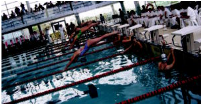
22 taldetako igerilariak erabatean aritu ziren lanean, ikusleei aspertzeko betarik eman gabe. JAIONE ASTIBIA

TOLOSA ▶ Atzo hasita, Gipuzkoako Igeriketa Txapelketa egiten ari dira Usabalgo kiroldegian, herrialde osoko 22 klubetako partaide diren 276 igerilari