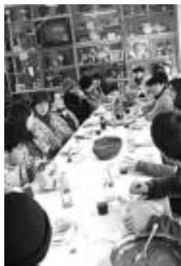
Aurrena, noski, gosaria. J. ASTIBIA

Oraindainokoa, berriz, ikusgarri doa. Atzo ere goiz-goizetik hasi ziren festan Lagun Arteako gazteak. Kanpoan, zero azpitik 7 graduko hotzberoa bazegoen ere, halaxe zioten herriko jendeek, behinik behin, eta mendiak ez ezik kaleak ere