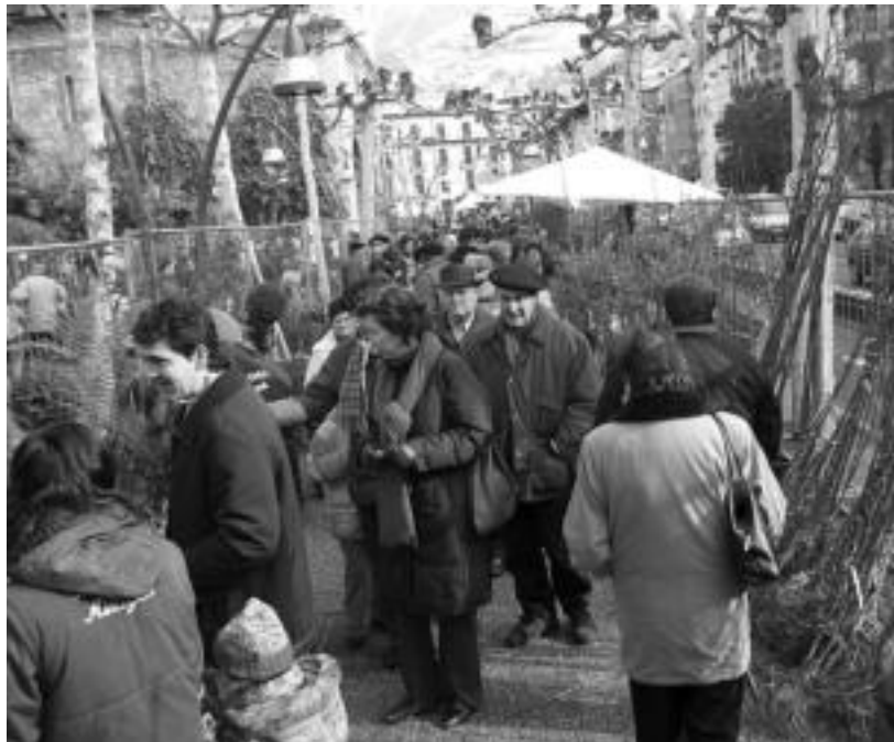
Jende ugari ibili zen, atzo, San Frantzisko etorbidean zeuden postuen artean. I. GARCIA

Zuhaitz eta landareen Azoka Berezia egin zuten atzo San Frantzisko etorbidean