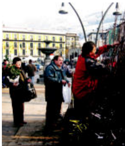
Negua da zuhaitzak landatzeko garaia; zuhaitz eta landare ugari aurki zitezkeen atzo. I. GARCIA