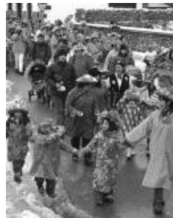
Herriko txokoak usu jantziko dira horrelako itxuraz; hori bai, elurrik ez omen da izanen aurten. A. Z. - J. A.