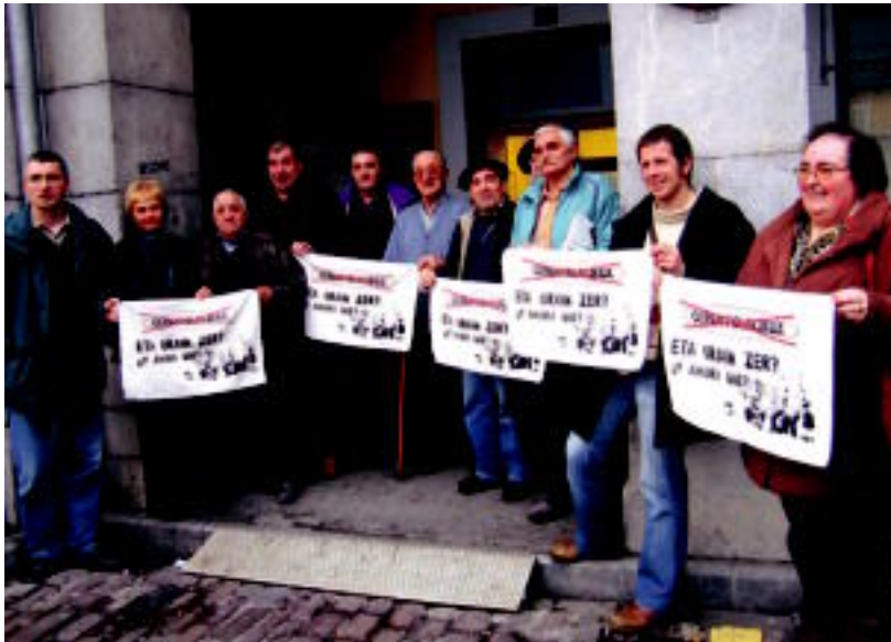
Eta orain zer? plataformako kideak, atzo, Gerontologikoaren sarreran.

Gerontologikoaren itxieraren aurkako plataformak bilerak egin ditu Aldundiko eta Tolosako Udaleko ordezkariekin