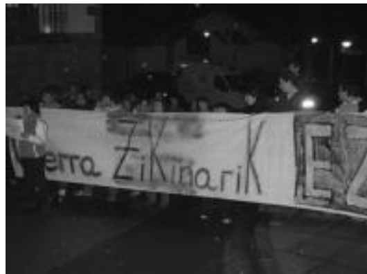
Ondoren, Sustraiak taldeari elkartasuna adieraziz bildu ziren. I. GARCIA