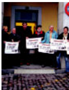
Plataformakoak, atzo.

Gerontologikoaren itxieraren aurkako plataforma politikariek bildu da ▶ 4