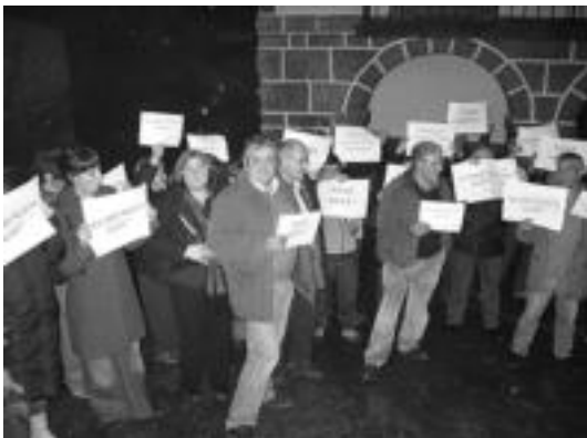
Kaltetutako familiari babesa azaldu zioten batzarren ostean. I. GARCIA

Udalbatzarra amaitu ostean, udaletxe kanpoan kontzentrazioa egin zuten kaltetutako familiari elkartasuna adierazteko, Hurrengo noiz? , Hurrengo noiz? Elkartasuna familiari eta Noiz arte? leloekin. Jaurritzak nahiz PSE-EEK, EAK, EBK eta PPK ere gaitzetsi dute ekintza eta sendiari elkartasuna adierazi. Bestalde, kontzentrazioaren ondoren, Gerra zikinarik ez! leloarekin Sustraiak-i babesa adieraziz bildu ziren.