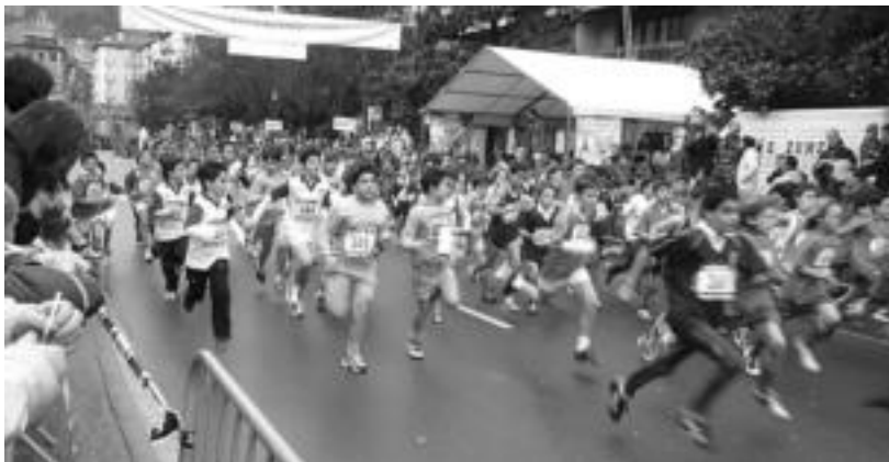
Iaz ere partaidetza altua lortu zuen Ero-Etxe krosak; aurten ere hala espero dute. HITZA