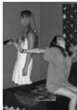
Taldeen antzezian bat. HITZA

Tolosaldea Goi mailako Lanbide Heziketa Institutuak jakitera eman duenaren arabera, Gestio kontablea izeneko ikastaroa antolatu du, eta laster hasiko da. Ikastaroa goizez emango dute, eta lanategietan praktikak egiteko aukera izango du ikastarotant parte hartzen duenak. Matrikula doan izango da. Informazio gehiago nahi duenak edo izena eman nahi duenak ikastetxera jo dezake edo 943 65 11 47 telefono zenbakira deitu.