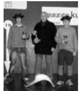
Beotibarreko kadeteak. HITZA

Etzi, Uzturpe pilotalekua izango da partida gehiagoren eszenatoki. Bi izango dira, hain zuzen, 11:00etatik aurrera ikusgai izango direnak: lehena Udaberri Txapelketaren barruan jokatu da eta bi talde nagusien artekoa izango da, Beotibar eta Gazteleku 1. Maila berean, baina Euskal Herriko Kluben Txapelketaren barruan, Beotibar 2 taldearen eta Donostia Jai Alairen aurkakoa, hain zuzen ere.