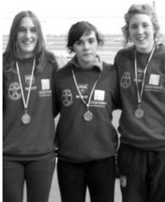
Tolosa C.F. atletismo taldeko neskek, euren dominekin.