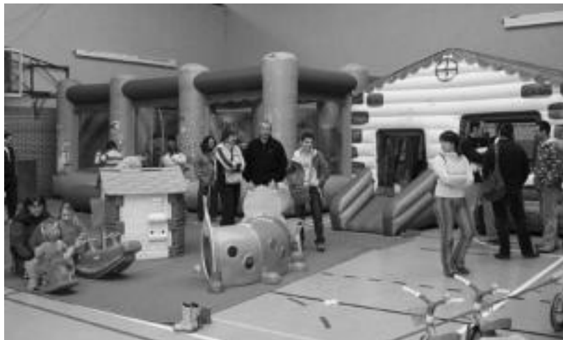
laz ere Haur Festa erraldoia antolatu zuen Uzturpe ikastolako Kultur Astearen baitan. JAIONE ASTIBIA

Hilaren 27ra bitarte, haurrentzako festa, hitzaldiak, dantza saioa, irteera, argazkiak, musika... izango dira