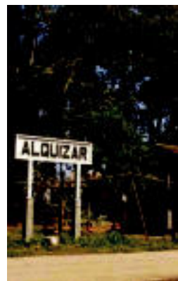
Kubako Alquizar herria.

HERRITARRAK ▶ Hitzarmena adostu aurretik, alkizarren iritzia jasoko du, kontsulta bidez ▶ 4-5