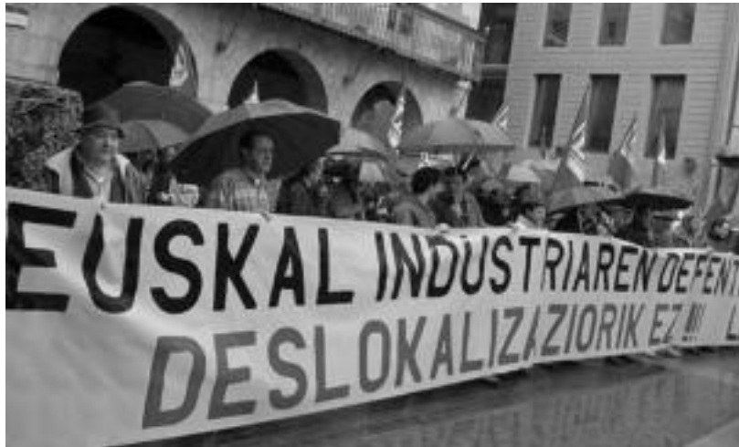
Udaletxe parean egin zuten konzentrazioa, atzo; ondoren, auto karabanan Tecasa-ra heldu ziren. N. LATABURU

Tolosako udaletxean egin zuen atzo konzentrazio informatiboa, «euskal industriaren defentsan»; ondoren, auto karabanan Tecasa lantegira abiatu zen