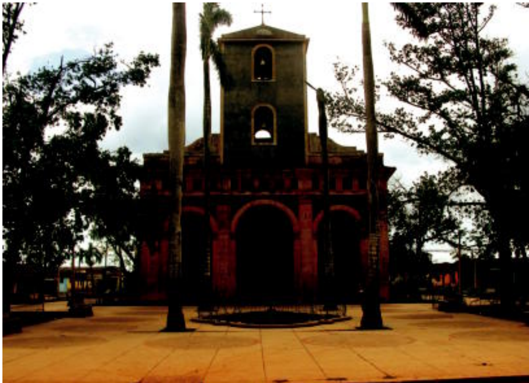
Kubako herriaren elizaren irudia.