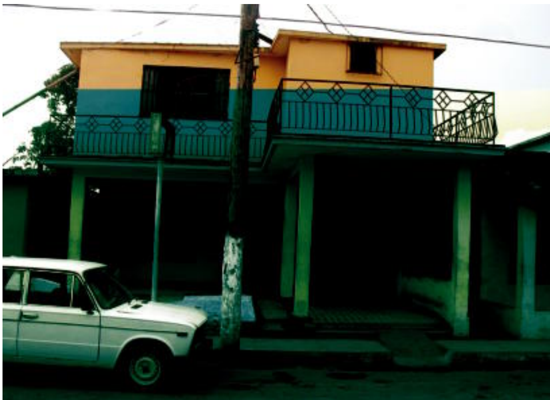
Alquizar herriko etxebizitza bat; kalte handiak jasan zituzten hainbat herritarrek beren etxeetan Txarli urakanagatik. LUIS MARI INTZA

Alkizako Udalak, udalbatzar batean, Alkiza eta Kubako Alquizar herrien senidetze hitzarmen prozesu bat burutzeko udal konpromisoa adieraztea erabaki zuen. Hitzarmena burutu aurretik, ordea, herritarren iritzia jakin nahi du Udalak eta, horregatik, udalbatzar berean, gai horren inguruko herritarren interesa jakin nahian Agenda 21eko herri batzarraren bidez kontsulta egitea erabaki zuen. Oraindik ez dago bilera horren eguna zehazturik, baina hilaren bukarean izango da.