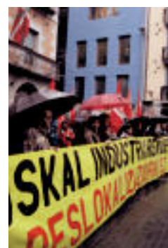
Kontzentrazioa, atzo, Tolosako udaletxe aurrean.

Deslokalizazioaren aurka kontzentrazioa eta auto karabana egin zuen atzo LABek ▶ 2