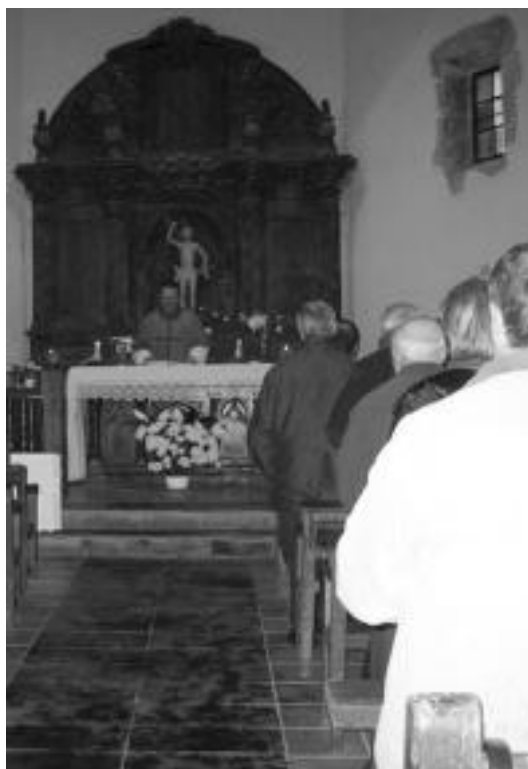
Orendaingo San Sebastian baselizan iaz ospatutako mezatan jende andana bildu zen. NOELIA LATABURU

Eskualdeko hiru herritan izaten da ospakizunik, erlijioa eta musika batuta