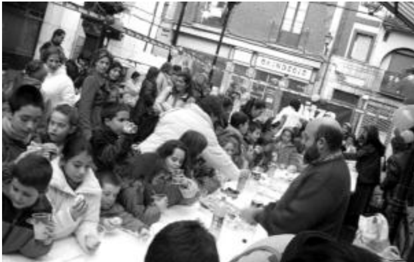
Arratsaldeko bikaina egin zuten haurrek Berdura Plazan Alde Zaharreko merkatarien eskutik. JAIONE ASTIBIA

Horrela, hantxe bertan, jaialdiari bukaera emateko, 122 parte-hartzaileen artean Tolosako Alde Zaharreko Merkatariek eskainitako hainbat eta hainbat opari zozketatu zituzten. Han bertan suertatu zirenek eskura jaso zuten egokitutako saria: gainerakoei helduko zaie. Nola? Bada, ondoren datorren zerrendan begiratu eta zure izena hor badago, HITZAK Tolosan duen egoitzara joanda jaso lehenbailehen. Zorionak denei eta mila esker!