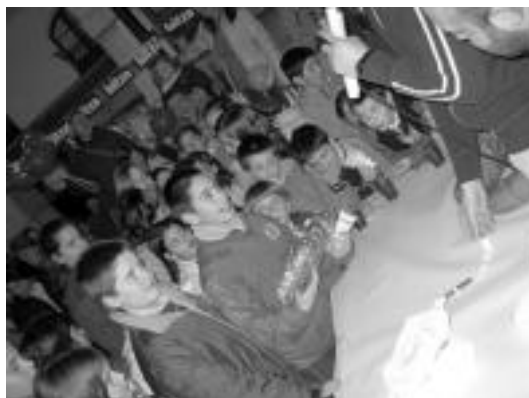
Parte-hartzaileei sariak banatu zizkieten antolatzaileak.