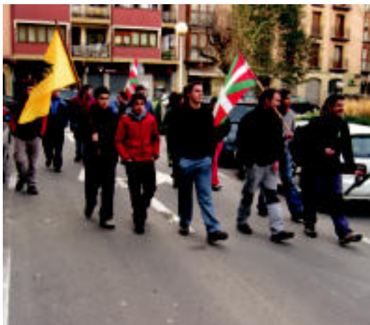
Eskualdeko hainbat gazte, atzokoan, martxan oinez. IMANOL GARCIA

HELBURUA ▶ Etxebizitza arazoari «okupazioarekin» erantzun behar zaiola esan zuten, besteak beste ▶