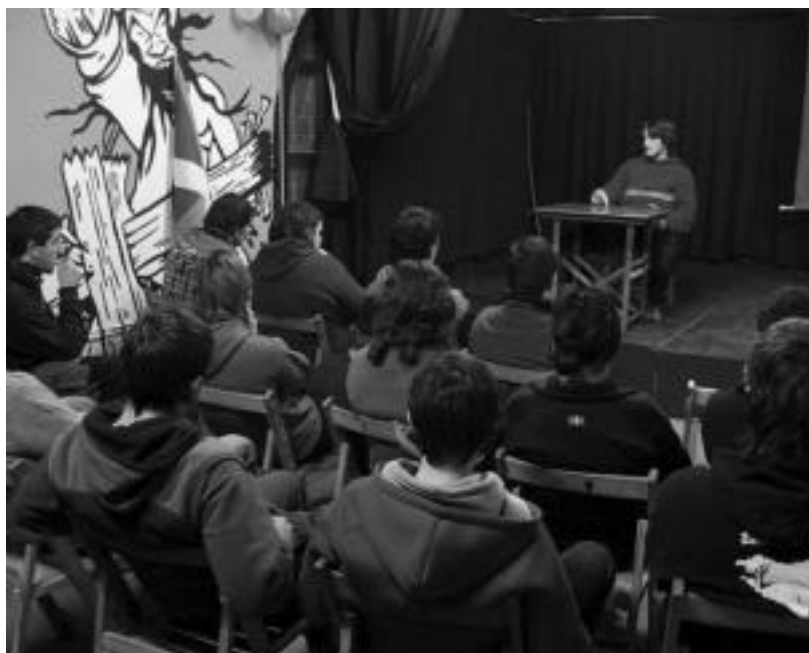
Etxebizitza eta gazteriaren inguruan hitz egiten, atzo, martxaren baitan, Villabonako Gaztetxean. I. GARCIA

Hainbat ekitaldi bururu zituzten atzo Villabonan, Anoetan, Tolosan eta Ibarren, Tolosaldeko Gazteriak antolatuta