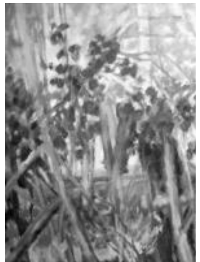
Natura. Zuhaitzak, ibaiak, basoak... askotariko elementuak margotu ditu Tapiak. I. ETXEBESTE

tzen». Gisa horretara margotu ditu ibaiak, basoak, zuhaitzak, herriak... eta erretraturen bat edo beste ere bai.