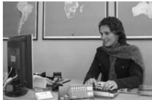
N. Goikoetxeak Bai Euskarari Ziurtagiria eskatu du Bidaiderako. i.e.

Arrazoi asko daude enpre- sek Bai Euskarari Ziurtagiria eskuratzeko. Alde batetik, bai euskararekiko bai euskaldu- nekiko erantzukizun soziala, hots, enpresek normalizazio- ren bidean laguntzea. Kalitatea eta lehiakortasuna da beste arrazoiak, egun euskara balio erantsia baita, kalitatearen