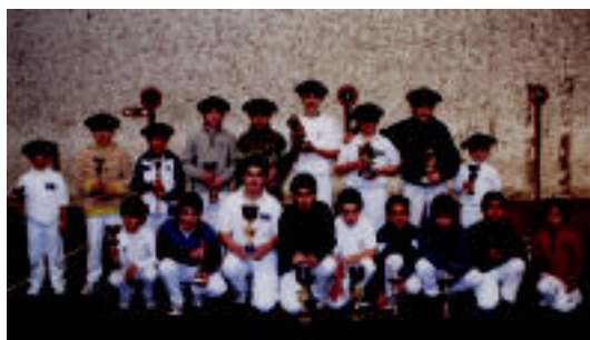
Txapelketan saria jaso zuten pilotariak, Elorri pilotalekuan.

Intxurre Pilota Eskolak antolatu du, 4 eta 14 urte bitartekoentzat ▶ 5