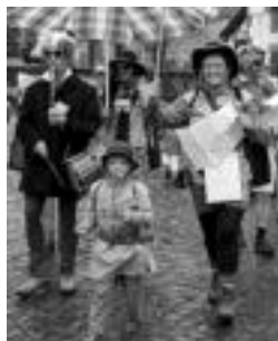
lazio Ihoteetako irudi bat. J. A.

Igandekoak ere balio bera dute eta Txokon eta Peritzan daude salgai. Hau 14:30ean, Erletako eskolako jantokian izanen da. Jakiak, berriak, honakoak: urdaiazpikoa, zainzuriak, otarrainskak, frijituak, bakailo Bizkaiko erara, entrekota guarnizioarekin, goxua edo sorbetea, eta bukaerakoak.