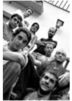
D´Callaos taldea. HITZA

Bestalde, musikak ez du etenik Tolosan eta gaurkoan ere Bonberenean beste kontzertu batek hartuko du protagonismoa. Asgarth taldearen eskuetik. Talde donostiarrak bere azken diskoaren kantuak aurkeztuko ditu, 22:30etik aurrera, zuzeneko kontzertuan. Garrasia du izena eta iaz plazaratu zuten. Aurreko hiru diskoetako abestiekin ( Jainkoen egoitza , Etorrizunaren sustraia eta III ) tartekatuko dituzte, halaber, kanta hauek.