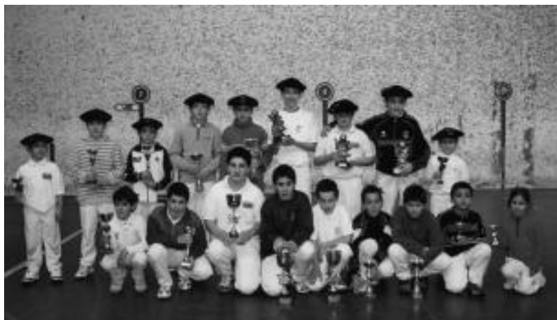
Alegiako Eguberrietako Pilota Torneoa sarituak izan ziren pilotari gazteak, Elorri frontoian.

Intxurre Pilota Eskolak antolatuta, 4 eta 14 urte bitarteko 64 pilotari aritu dira