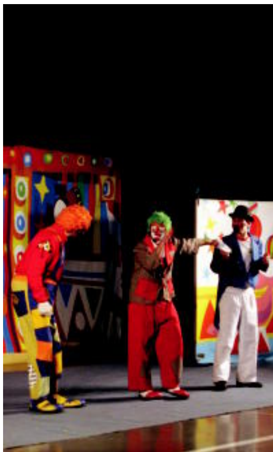
Poxpolo, Mokolo eta konpainia, atzo, Asteasuko kiroldegian. N. URBIZU