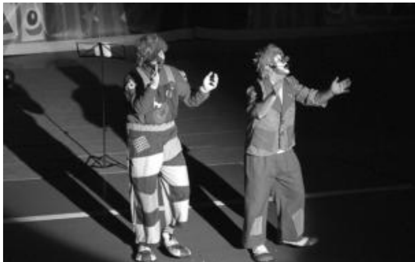
Poxpolo eta Mokolo pailazoak, Gabon-kantak abesten, atzo. N. URBIZU

Hurrek ederki asko igaro zuten atzoko arratsalde pailazoekin batera, kantuan, dantzan eta algara artean