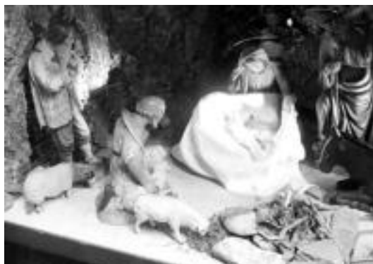
Aspaldikoak. 60 urte inguru ditu Malumbres dendan jarritakoak. I. T.