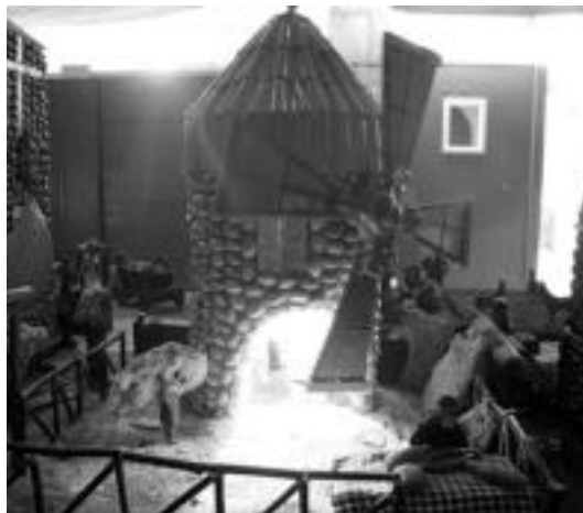
Mugimenduak. Errotak biraka, ahateak igerian, kanpaia joz dabilena... mugimenduak dira nagusi Peña Frascuelok eginkoan. I. T.