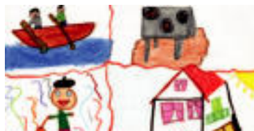
Nerea Eizaguirre Caminos (6 urte, Tolosa). «Nire herrian dauden gauzak: estropadak, Babarrun Festa, Inauterik eta nire etxea», azaldu digu Nereak bere marrazkian buruz.