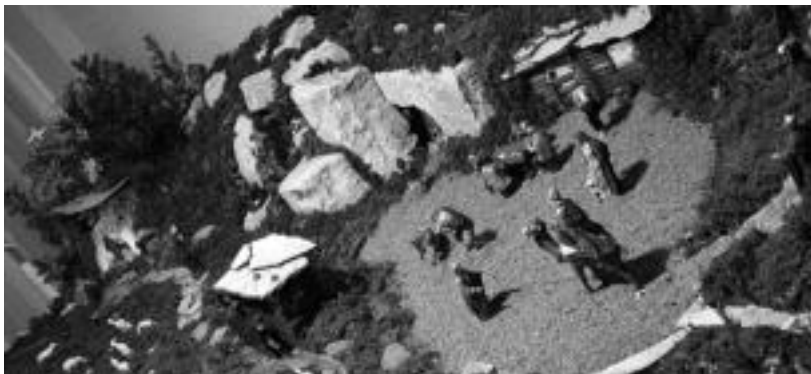
Afizioa. Orkatz Erbitirentzat afizio bilakatu da jaiotzak egitea. Irudian, aurten egin duena. JAIONE ASTIBIA