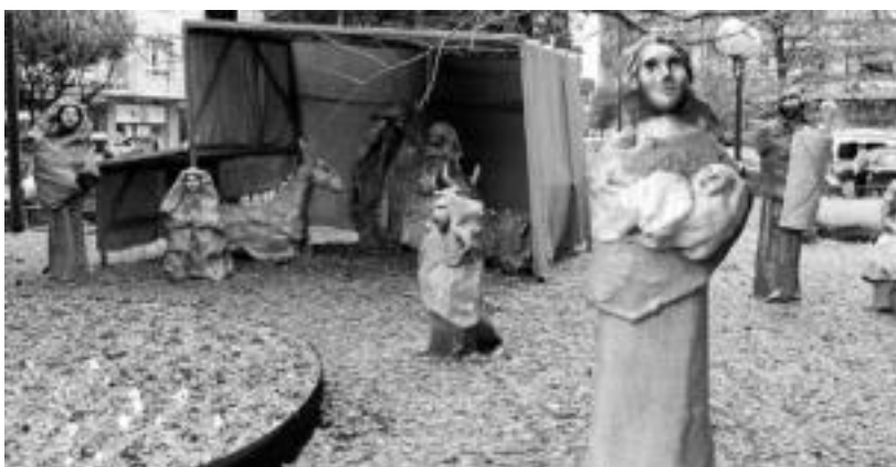
Tolosa. Ezbeharren bat jasan ohi du urtero Gernikako arbolan jartzen duten jaiotzak. I. TERRADILLOS