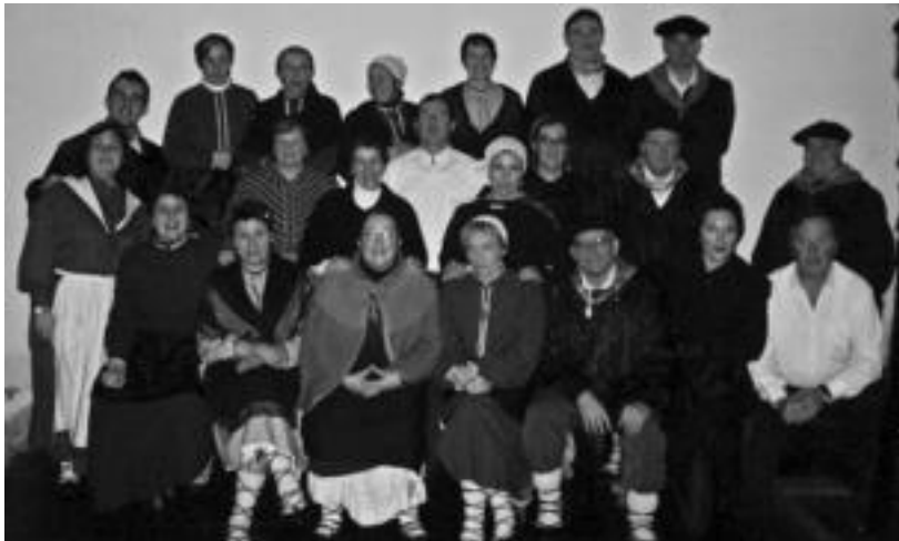
Gabon Abesti Sariketa Probintzianaren parte hartu zuten Eresargi abesbatzako zenbait kide. HITZA