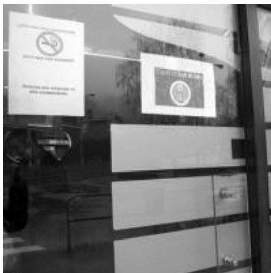
Tolosako lurre txokolategian tabakoa saltzen zuten orain arte; orain tabakorik gabeko gune izatea erabaki du arduradunak. I. ETXEBESTE

«Erretzeari uzteko ezinbestekoa da borondatea izatea; sendagileek eta guk laguntza eskaintzen diegu hala nahi dutenei»