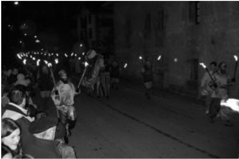
Gaur iluntzean iritsiko dira Hiru Errege Magoak herrietara, iazko Leitzako irudi honetan bezalatsu. J. ASTIBIA

Hiru Errege Magoen etorrera iragartzera paje-laguntzaileak etorriak dira eta herrietako gaurko ongietorrien hitzorduz beteta eramana dute agenda atzokoan