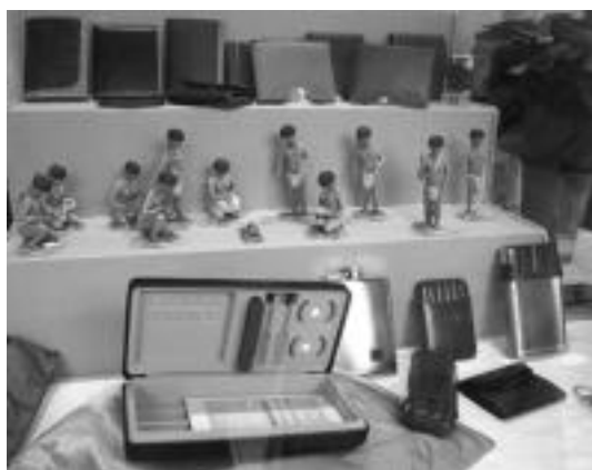
Estankoetako erakusleihoetan ez dago tabako markarik iragartzetik; bestelako produktuak jarri behar izan dituzte Tolosako Zabalan. I. E.