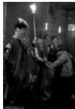
Atzo, pajeak Leitzan. J. ASTIBIA

19:00. Loatzo aldetik etorriko dira Erregeak eta Mendiondotik hasita kabalgatan ibiliko dira herriari barrena, plazaraino.