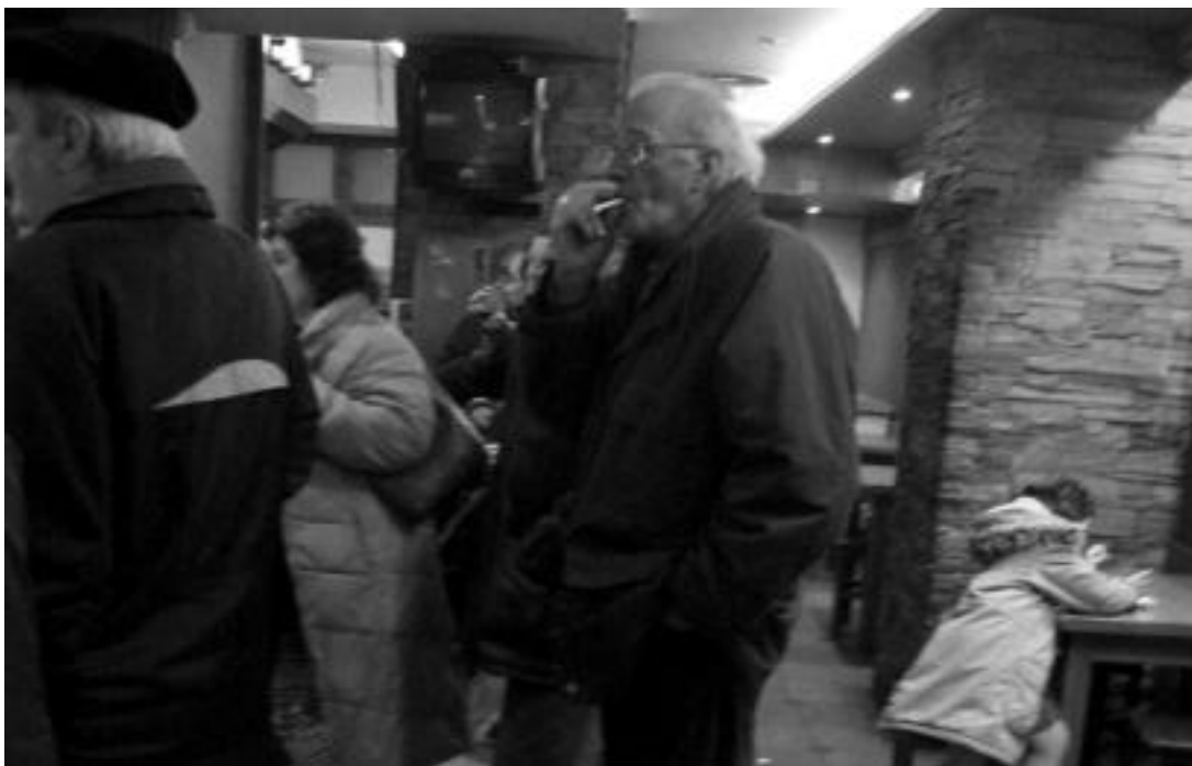
Tolosako ia taberna gehienetan bezala, erre daiteke Asteasuarran ere; «erretzen ez dutenek berdin-berdin jarraituko dute etortzen». N. LATABURU

«Orain arte ez dugu aldaketa nabarmenik nabaritu; goizegi da balantze egiteko». Horixe da Tolosaldeko eta Leitzaldeko tabernetako, estankooetako eta farmazietako ordezkariak, orokorrean, tabakoarekin zerikusia duen lege berriari buruz esan dutena. Tabakoaren Aurkako Espainiako Legea indarrean da urtarrilaren 1etik Hego Euskal Herrian, eta baita gure bi eskualdeetan ere.