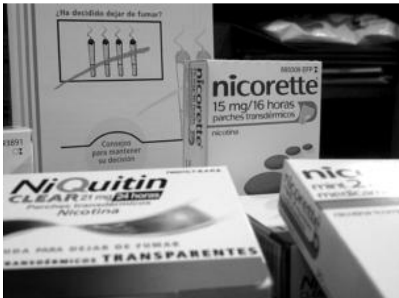
Erretzeari uzteko produktuak gero eta ugariagoak dira farmazietan: txikleak, partxeak, pilulak... I. ETXEBESTE