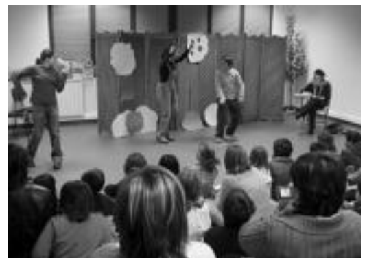
Txikienek Manbruren zain antzezlan irakurria eskaini zuten —goiko argazkian— eta DBHkoek Hollywood-eko izarrak —behekoa—. i.g.