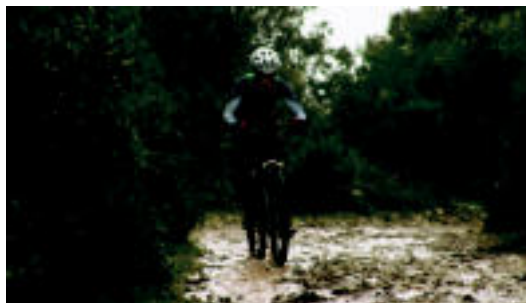
Luquin, Europako Txapelketan, proba gogorari aurre egiten.

Mendiko duatloian ari da; Olaederra kiroldegiko gerente berria da ▶ 4