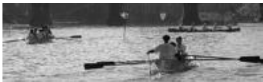
Jarraitzaile asko lortu ditu sanjoanetako estropadak.

Tolosaldeko Arraun Klubak (TAK) bere egitasmoen berri emateko ekitaldi informatiboa egingo du gaur, 20:00etan, udaletxeko batzar aretoan. Deialdia irekia da. Bertan jorrratuko dituzten gaiak honakoak izango dira, besteak beste: klubaren sorrera eta hastapeanak erakusteko bideoa; egungo egoeraren berri ematea; eta Euskadiko Arraun Federazioak antolatutako batel lehiaketan ariko diren TAKeko 10 tripulazioen aurkezpena ere egingo dute, kategoria guztietan izan-