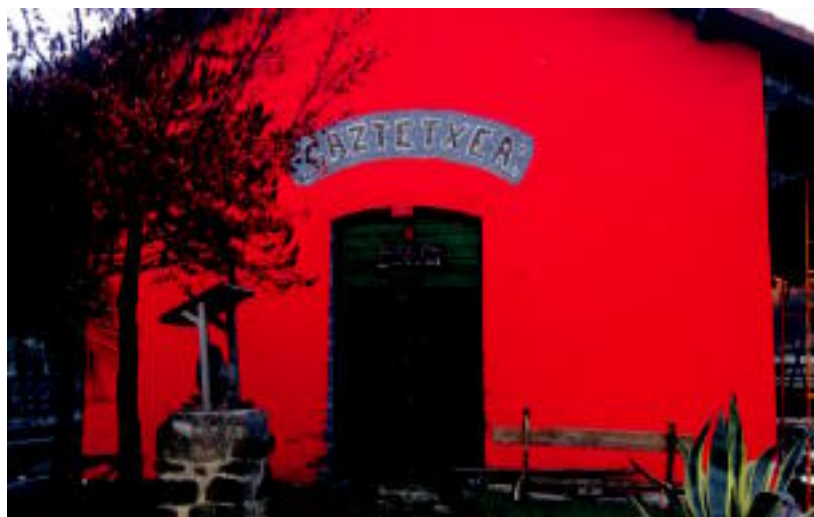
Alegiako Gaztetxeak aurten ere hainbat ekintza egiteko aukerak eman ditu. N. URBIZU

la hilabete pasatu da Gaztetxeak egitarau berezia hasi zuenetik; azken aste honetan ikustekoak izango dira nagusi