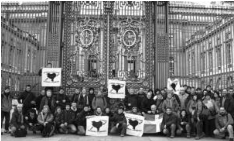
Euskal Herritik joandako 60 senitarteko eta lagun inguru izan ziren epaiketan. HITZA

«Espainiarekin batera, Frantziak ere jazarpen molde ezberdinetan duen paper aktibo» salatu zuten epaituek