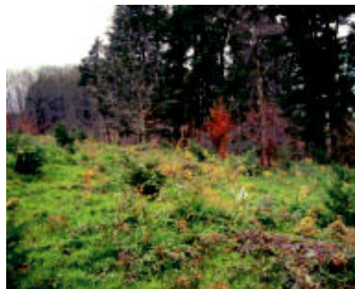
Languarren izeiekin egindako «bixikizioa». HITZA