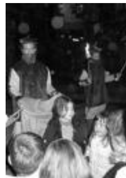
laz etorri ziren pajekak. J. ASTIBIA

Bitartean, kalejiran parte hartu duten guztiak txokolate beroa izanen dute zain Labetxean, Aurrera elkartearen bitartez. Gaur gauetz helduen txanda izanen den bezala, bihar