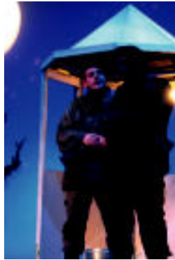
Erreleboaren irudi bat. HITZA

Antzezlanean «esperientzia, inoentzia, adiskidetasuna, inbidia, borroka, leialtasuna...» agertzen dira, «denak batera, denak gau batean. Bata beste-