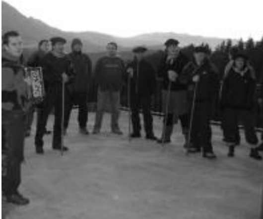
Baserriz baserri ibili ziren bedaiotarrak. HITZA