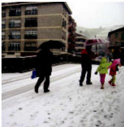
Bi eskualdeak zuri-zuri esnatu ziren atzo: irudian, Leitzako kale nagusia (ezkerrean) eta Villabona-Zizurkilgo Zubi Zaharra (eskuinean). JAIONE ASTIBIA / IMANOL GARCIA