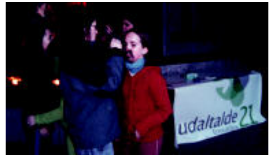
Haurrek aurpegia margotu zuten jolasean hasi aurretik. HITZA