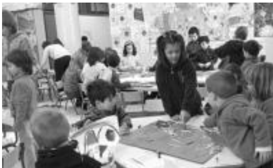
Leitzaldeko haurrak, atzo, Gabonetako aisialdi saioetan.

Areson, berriz, gaur ekingo diete Gabonetako oporraldirako antolatutako aisialdi saioei. Gaur eta ilbeltzaren 3an izango dira saioak, eskolako areto handian. Goiz osoan izango dira saio horiek Ainhoa Antizar, Naiara Agirre eta Ireber Arangoa begiraleen gidaritzan.