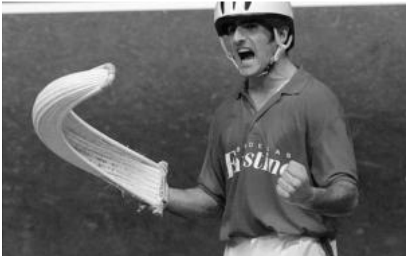
Etzi jokatu du finala Zeberio elduindarrak Urrutiaren aurka.

Urrutiaren aurka jokatu du etzi; fisikoki zein moralki «oso egoera onean eta ilusio handiarekin» aurkitzen dela dio