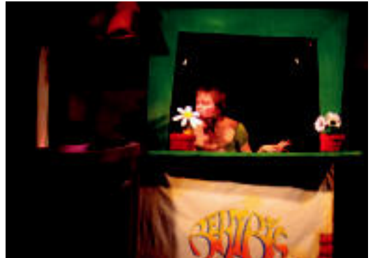
Behi Bi's taldeak txobxongilo emanaldia eskaini zuen atzo.

Urte Berri Egunean, igandea, meza nagusia parrokian