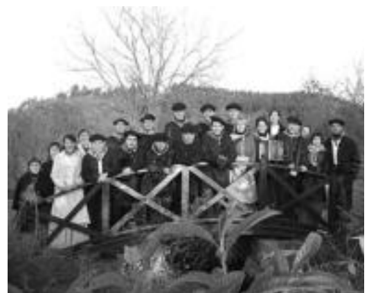
Goian, Belauntzako gazteak Olentzeroren eskutik opariak jasotzen. Behean, abestera irten ziren Muxkil elkarteak.