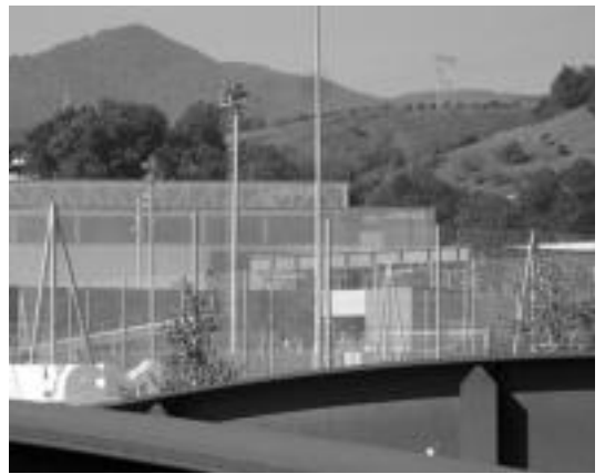
Baliteke Usabal azoka gune bilakatzea urtarrietik aurrera. I. ETXEBESTE

Afera horren harira, Leidor aretoko berrikuntza lanetan ere izango da aldaketarik. Izan ere, Usabaleko gastuei aurre egiteko Leidorreko lanak bertan behera utziko dituzte, eta Gipuzkoako Foru Aldundiak lan horietarako emandako diru laguntza kultur ekimenetarako bideratuko dutela eman dute jakitera. Hori dela eta, Leidor aretoan 2006. urterako aurreikusten zizuten kultur ekimenak Ferialekuan egingo dituzte, besteak beste, «ekinean izango diren abesbatzen emaldiak eta antzezlan batzuk». Kontzertuak ere bertan izango dira egoera aldatzen den artean.