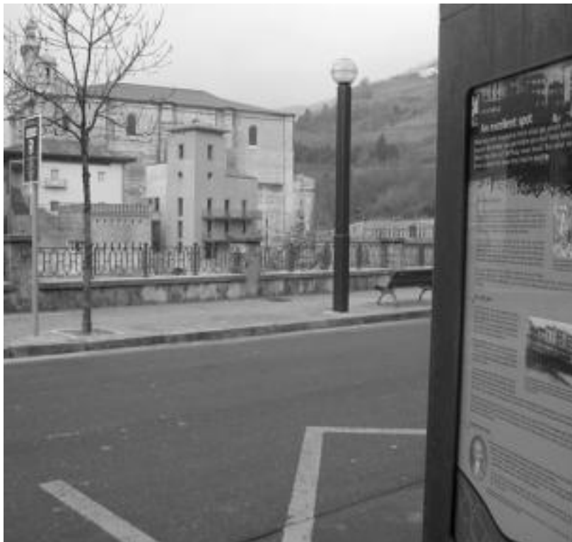
Ibaiondoko begiratokia; Errota, Zerkausia, Idiakez Jauregia eta Nafarroako zubia ikus daitezke.