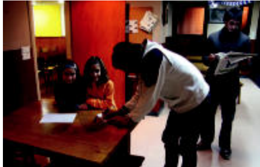
Txikiiek Urangaren eta Jauregiren sinadurak lortu zituzten. A. COLOMA

▶ HITZAK ez du bere gain hartzen egunkarian adierazitako esanen eta iritzien erantzukizunik.