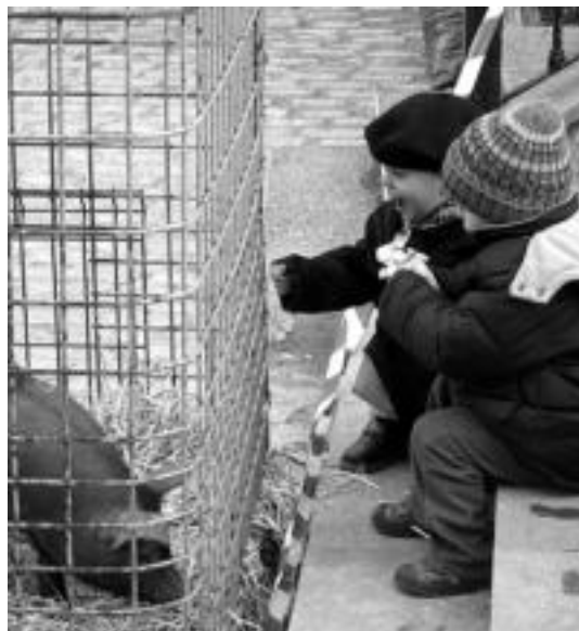
Bi haur, txerrixoei begira eta txistorra ogi artean jaten.

Herriko plazan elkartu dira bertako haurrak Ikaztegietakoeekin batera