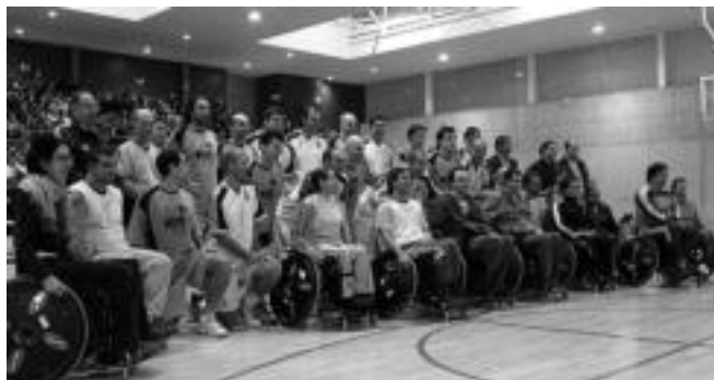
Gipuzkoak, Real Madrilekoak eta ezinduak, omendutakoekin batera. I. TERRADILLOS

Gipuzkoako saskibaloari omenaldia egin zioten herenegun Usabal kirolgunean