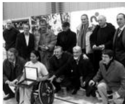
1966-67 urteko Atletico SS Fagor taldeko jokalariek. I.T.