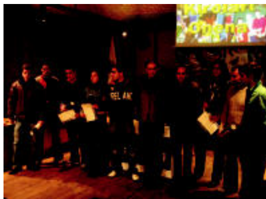
Aipamen berezia jaso zuten kirolariak, atzo, udaletxean.