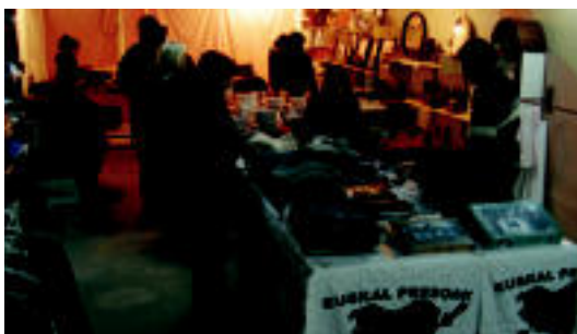
Jendea hasi da joaten plaza ondoko elkartasun dendara. I. GARCIA

Batez ere haur eta gaztetxoentzat; urtarrilaren 5a arte iraungo dute ▶ 5