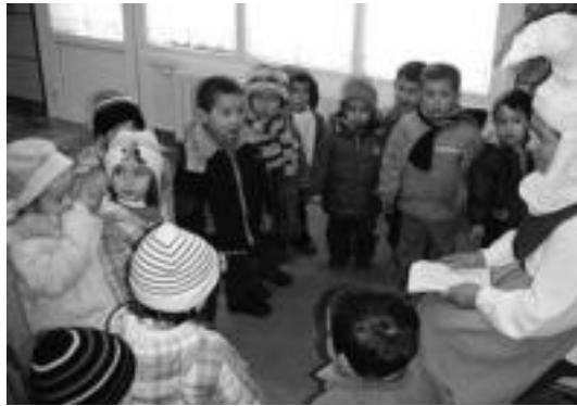
Lizartzako eskolara Mari Domingi etorri zen, atzo.

Herri guztietan ongietorriak egingen dizkiote ikazkin maitagarriari, Gabon-kantak nagusi izanez