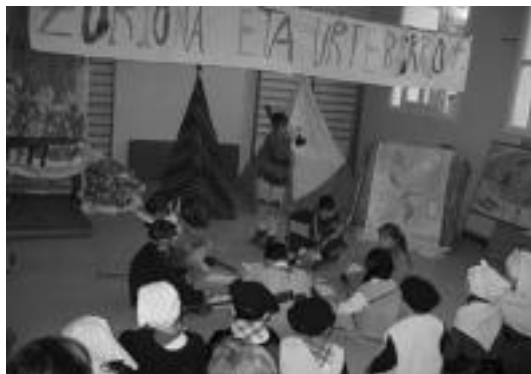
Aresoko eskolan, Ames-atzemailea antzerkia eskaini zuten. J. ASTIBIA