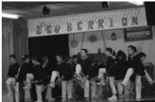
Leitzako Erletan, kantak, dantzak... denetik egin zuten ere. J. ASTIBIA