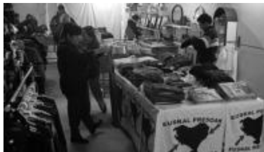
Elkartasun dendan dagoeneko mugimendua somatzen da. I. GARCIA

Bestalde, dagoeneko irekita dago presoen aldeko denda, Villabonako Errebote plaza on-