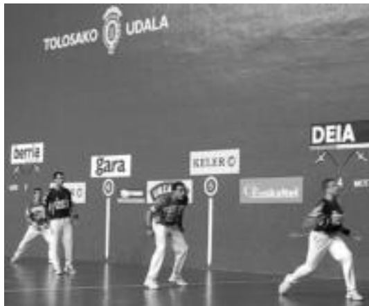
Pilolari profesionalak jokatuko dute Beotibarren hilaren 28an. L. M.

Hilaren 28an hiru partida izango dira; Gabonetako Torneoko bat, tartean