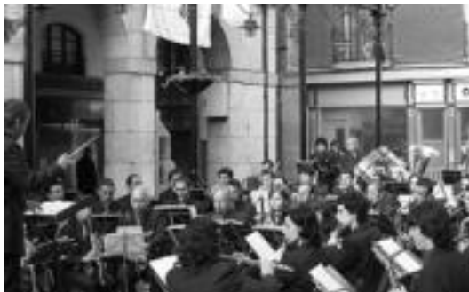
Tolosako Musika Bandak urtean zehar emandako emanaldi bat.