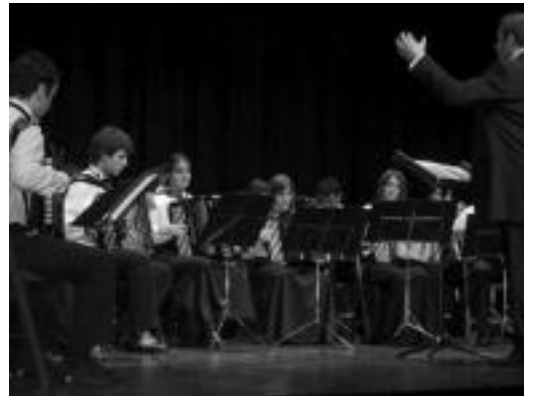
Ekainean eginiko 25. urteurrenaren emanaldia. J. SAIZAR

Gaur izango da, 20:00etatik aurrera, Usabal kiroldegian; 25 urte betetzen ditu aurten