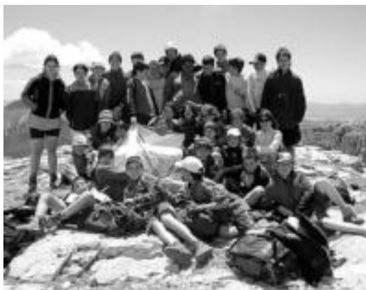
Bizkorrek taldekoak, aurtengo udan, Belagoa inguruan. HITZA

Historia. Duela hiru urte sortu zen Kirikiño aisialdi taldea. Gainberri, Jesusen Alabak eta Eskolapioak ikastetxeek bat egin zuten ikasturte horretan (2002-2003), eta Hirukide jaio zen. «Aisialdian ere hiru zentroetakoak batzearen beharra» ikusi zuten arduradunek, eta halaxe eratu zen aisialdi talde berria. Aurretik, Jesusen Alaben ikastetxean Alcor taldea 20 urtez arduratu zen eskolaz kanpoko ekintzetaz; eta Eskolapioetan, bestalde, 17 urte beteak zituen jada Txantxangorri aisialdi taldeak.