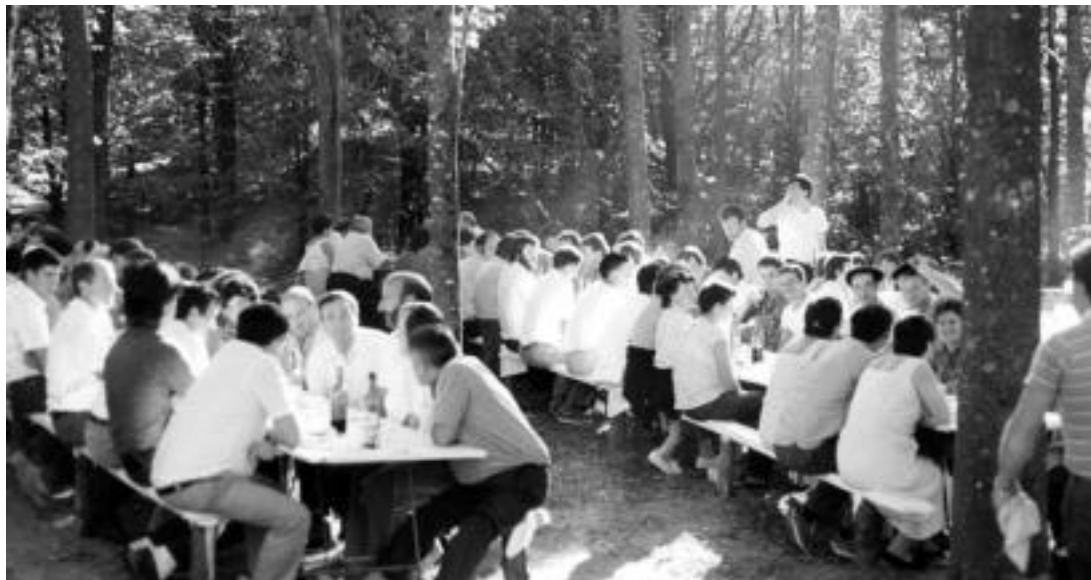
1985ean Uliko aterpearen inaugurazioan; hemen hasi zen hogei urtez, behintzat, bizirik dirauen gazteluarren eta orexarren arteko festa. HITZA

Aurten egin ditu hogei urte gazteluarren eta orexarren arteko festak; urriaren 12a heltzen deneko historia handiko festa ziurtatuta izaten dute bi herri horiek