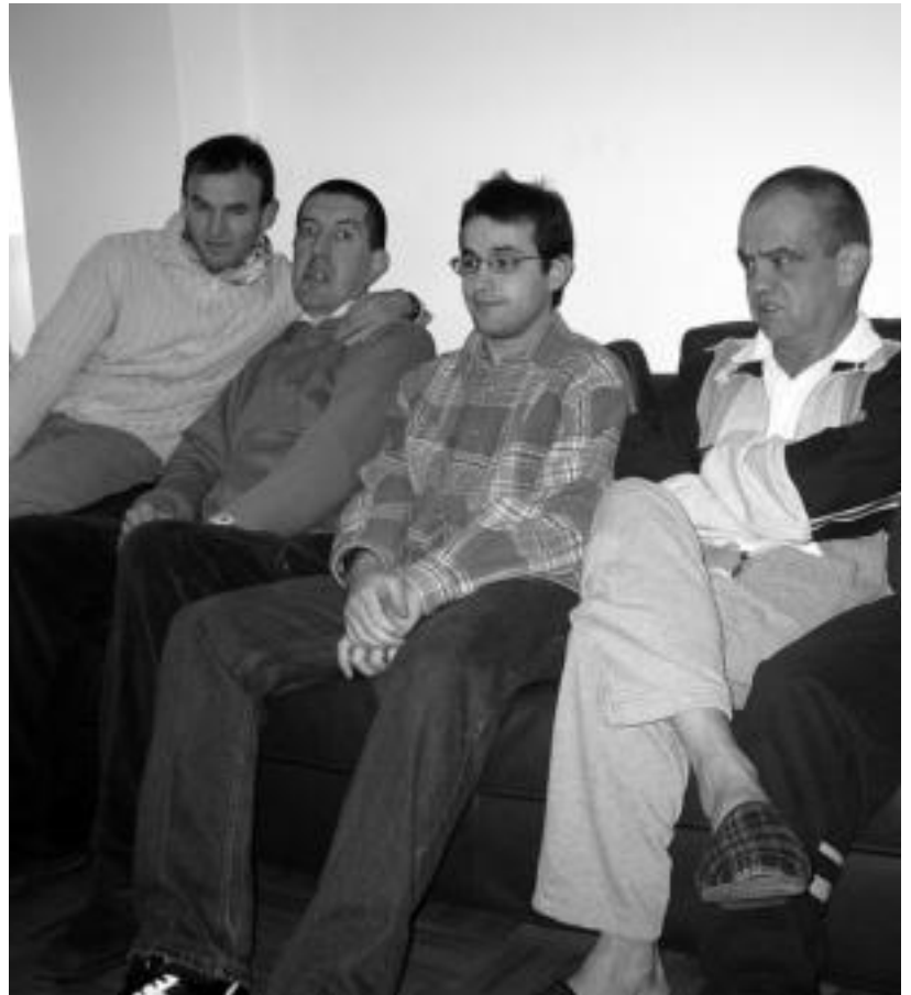
Tolosako etxeetako batean bizi direnetako batzuk, egongelan, telebista ikusten. NEREA LIZARTZA

Horixe da Atzegik etxeen saillean eskaintzen duena. Horrez gain, bestelako egitasmoez ere arduratzen da. Kontuak kontu, «guztien gizarteratzea lortzeko pauso ugari ematen» jarraituko dute aurrerantz ere.