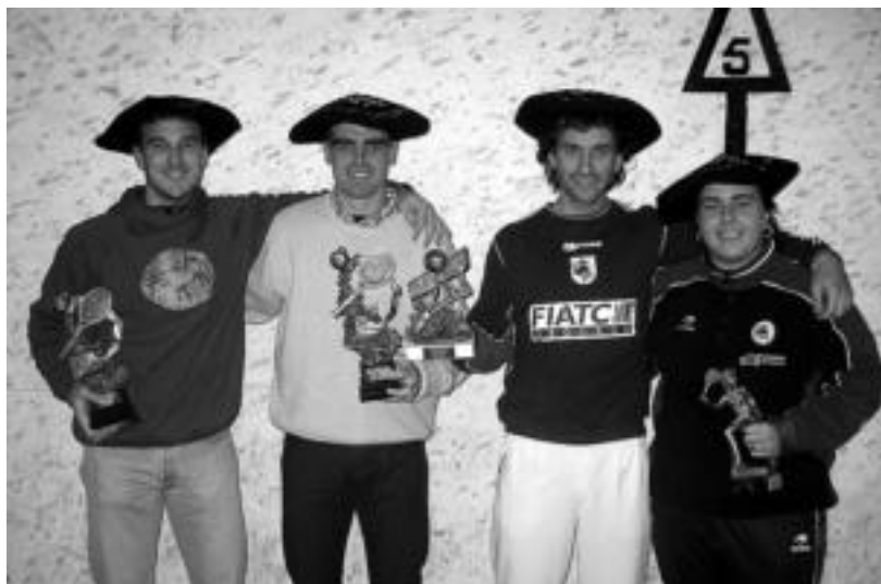
Frontenis txapelketan txapeldun atera ziren jokalaririk, herenegun, euren sariekin. BITTOR MADINA