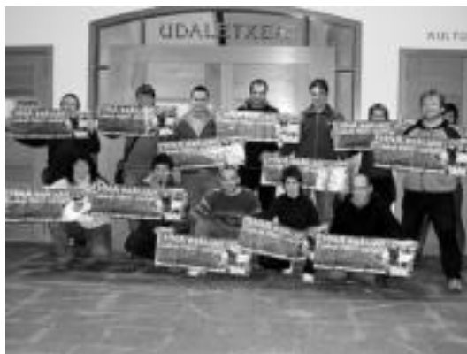
Tolosaldeko Bai Euskal Herriari ekimenak egindako agerraldia. HITZA

eta etzi, bai eta datorren asteburuan ere EHNA tramitatzeko. Hala, Tolosaldeko nahiz Leitzaldeko herritarrek euren herrietatik mugitu gabe egin ahalgo dute eskaria, izan ere, herri guztietan jarri dute hitzordua horretarako.