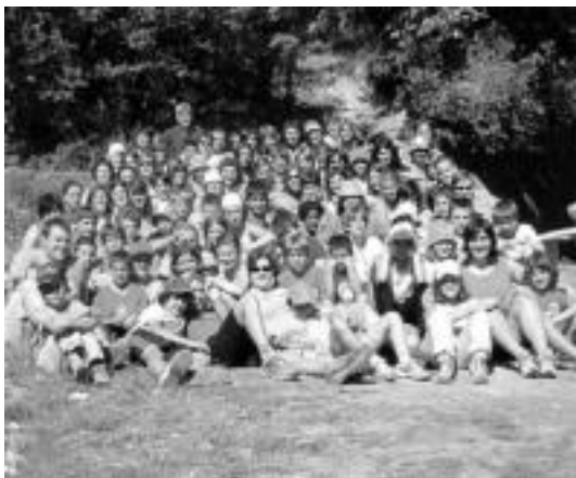
Atsedena taldeko gazteak eta begiraleak, azken kanpamentuan. HITZA

Ekintzak. Talde bakoitzak bere egutegia du bileretarako, asteburuetarako eta irteeretarako, baina badaude urtean zehar elkarrekin egindako ekintzak ere. Eguberrietako irteera da horietako bat. Inauterietako konpartsa beste bat, taldea sortu zenetik urterotik ateratzen dutena. Kanpamentuei dagokienez, azken urteotan Peñaloscintosen (Errioxa, Espainia) altxatzen dute Atsedena taldearen kanpa, «guraso askoren laguntzaz: muntaian, sukaldetan...», normalean uztaile bukaeran eta abuztuan. Bestetik, urtean behin begirale guztiak asteburu batean elkartzen saiatzen dira, «asteroko dinamikatik atera eta elkarrekin fede nahiz bizi esperientziak elkarbanatzeko. Aurten gure proiektua berritu nahi dugu».