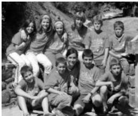
Kazkabarrako hainbat gazte eta begirale, Garden (Nafarroa).

Harremanak okertu egin ziren eta begiraleek taldeetik atera beharrean ikusi zuten beren burua, neska-mutilekin ekintzak antolatzeko gogoak jarraitzen bazuen ere. Zenbait guraso ere laguntzeko eskaini ziren. Egoera hartan, inoiz baino indar gehiagorekin ikusten zen taldea, eta egoitza bila hasi ziren». 1990-91 ikasturtean Laskorain ikastolara jo zuten begirale gazte haiek; ikastola Euskaraz Bizi proiektua indartzeko aisialdirako begirale bila hasitokotan zen. «Guk lokalak eskatu genizkionean, elkarlanean aritzeko aukera aztertu genuen». Taldeari Kazkabarra izena jarri, estatutu berriak egin eta ekintzak antolatzen jarraitu zuten, euskara eta natura ardatz hartuta. «Ikastolako umeen erantzun onak animatu egiten gintuen; oso urte onak izan ziren: begirale asko, ume asko, ideia asko...»