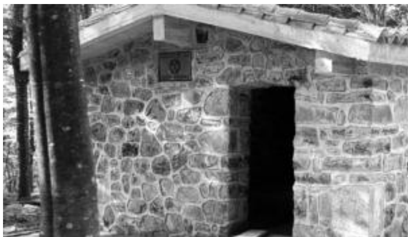
Itxura hau hartu zuen —eta egun ere itxura horixe du— Mikeleteen etxe berrituak.

alkatetzan. Proiektua eskuan hartuta, Gipuzkoako Foru Aldundira joan ziren, eta, han, berritze lanak hasteko diru laguntza eman zien. Asmoa kontuan izanda, Tolosako mendizale elkarte batzuekin ere harremanetan jarri ziren haien laguntza ere lor zezaten. Berastegiren eta Gazteluren lurrek bat egiten duten tokia den arren, Mikeleteen etxea —ondorengo aterpea— Gazteluko lur-erri zegokien zati bat eta gainontzekoa, berriz, Diputazioari; azken honek bere lurretan egiteko baimena eman zion.