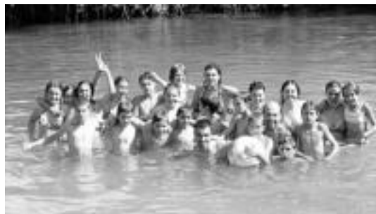
Txiribitu taldekoak, udako kanpamentuan. HITZA

Taldeakideak. Begiraleak eta 9 eta 14 urte bitarteko 35 gaztetxo, lau taldetan banatuta: Pon-