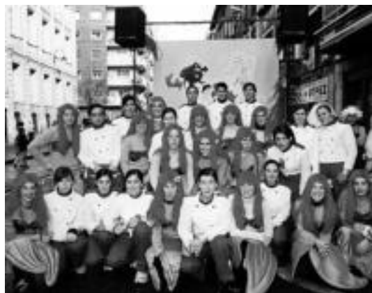
Ttenttek taldeko hainbat gazte, Inauterietako konpartsan.