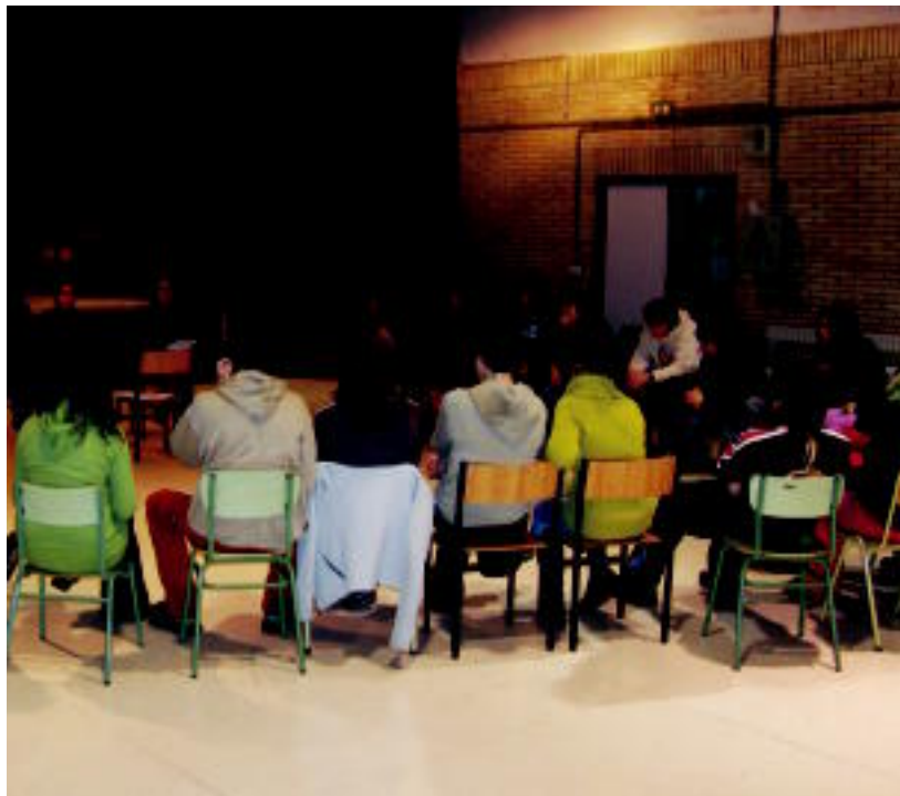
25 bat lagun elkartu zen Laskorainen antolatutako Herri Eskolan; «balantze ona» egin dute.

TOLOSALDEA ▶ «Inposatutako jai egun arrotzari erantzuteko», lan eguna deitu zuten atzo Amezketan, eta Tolosan Herri Eskola eta manifestazioa egin zuten