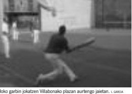
Joko garbin jokatzen Villabonako plazan aurten jokatzen. I. SARRA

behera utzi behar izaten dituzte partidak. Plazako denboraldi apiriletik uztailera izaten dira, pilotako beste modalitate bat, desberdina, baina errebotearekin erlotzatuta. Bizen arteko berdintasunak eta desberdintasunak azaltzen saiatuko gara. Joko garbitzen kasuan, talde bakartzeko hiru jokalaririk, bi aurrelari eta atzetarria. Hiruek saskia erabiltzen dute. Normalean plaza librean jokatzen da eta pareta bakarria dute aurrean. Horregatik eguraldi ateratzen behar da. Hori dela eta, askotan bertan