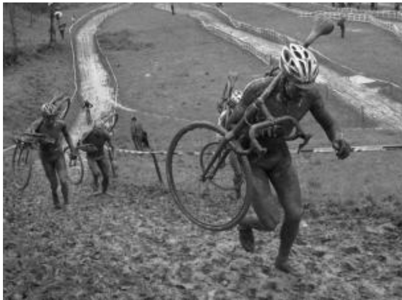
Lokatari aurre egin behar izan zioten txirrindulariek proba guztian zehar. I. GARCIA

Bizkaitarrak hasieratik hartu zuen abantaila; eguraldiak proba gogortu zuen