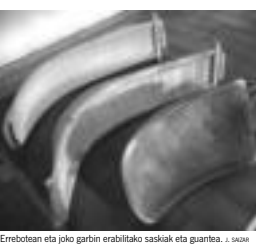
Errebotean eta joko garbin erabiltzeko saskiak eta gurtia. I. SARRA

JOKO GARBI Lekua. Plaza irekian pareta bakarrean edo ezker paretan. Negean fronto estalian jokatzen da. Jokalariek . 3 jokalarik saskiarekin: 2 aurrelari eta atzetarria bat. Epaileak . Epaile bakarra izaten da. Tantoa . 40 edo 45 tantotara, txapelketaren arabera. Jokoa . Ez dago jokorik.