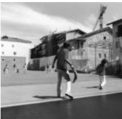
Errebote partidu bat Villabonako plazan. I. SARRA

Villabonak kirol berri bat dauka, oso leku gutxi dagoen jokatzen dena eta herria berrizten duena: errebotea. XVIII. mendean erdialdetik datortzen pilota joko hau tenisaren familiakoa izan daitekeela diote batzuek. Zumezko saskiarekin jokatzen diren joko hauetan lehena laxoa izan zen, gaur egun Euzkan aldean berreskuratzari diren pilota jokoak.