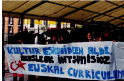
Eskualde mailako manifestazioa egin zuten ikasleek Tolosan. HITZA