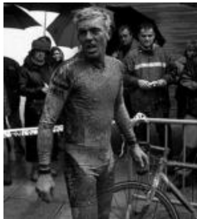
Seco, proba amaitu berritan. I. GARCIA