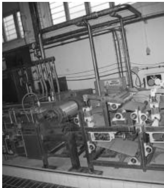
Papergintzarako makina pilotoa dute eskolan. I. ASENSIO