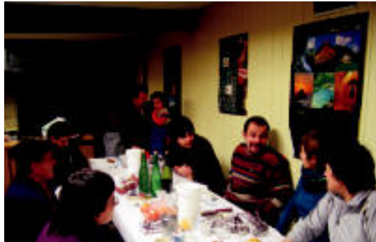
Bideak garbitu ondoren bazkarian elkartu ziren Amezketan. N. URBIZU

▶ HITZAK ez du bere gain hartzen egunkarian adierazitako esanen eta iritzien erantzukizunik.