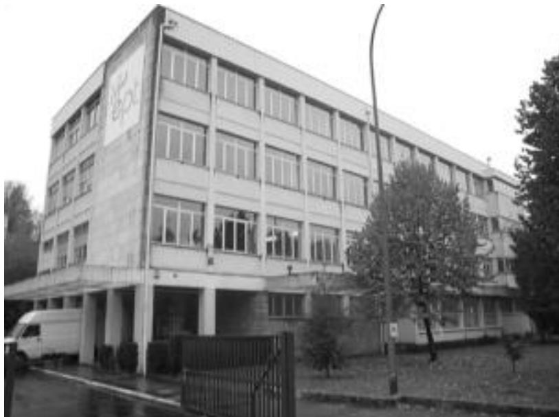
Berazubi auzoan kokatzen da Paper Eskola; 40 urte beteko ditu hilaren 15ean. IÑIGO ASENSIO

Hilaren 15ean 40 urte beteko ditu Tolosako Paper Eskolak; ate irekien jardunaldiak antolatu dituzte, bereziki Tolosaldeko biztanleei «gizartean txertatzeko eta hemen gaudela aldarrikatzeko»