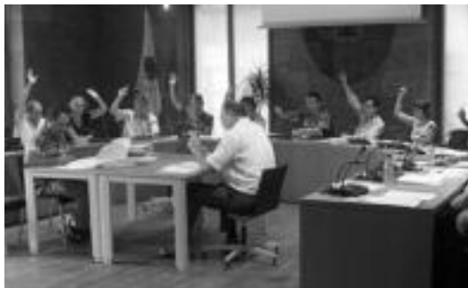
Tolosako Udaleko osoko bilkuren arriboko irudia.

Osoko bilkuran ekarpenak egin zituzten alderdiek eta herriarrek. Onintza Lasa Udala