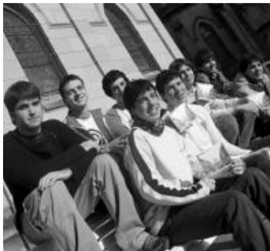
Bonberenea txaranga musikotzaileetako batzuk. N. URBIZU

Gazte hauen ibilbidea motza bezain berezia da: Deabruak Teilatuetan talde tolosarraren