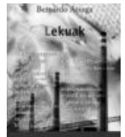
Liburuaren azala.

Izenburua. Lekuak . Egilea. Bernardo Atxaga. Argitaletxea. Pamiela. Urtea. 2005.