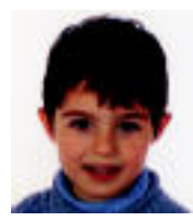
URTE ASKOAN EKAIN. GAUR 5 URTE. ZORIONAK ETA MUXU BAT FAMILIAREN PARTEZ.