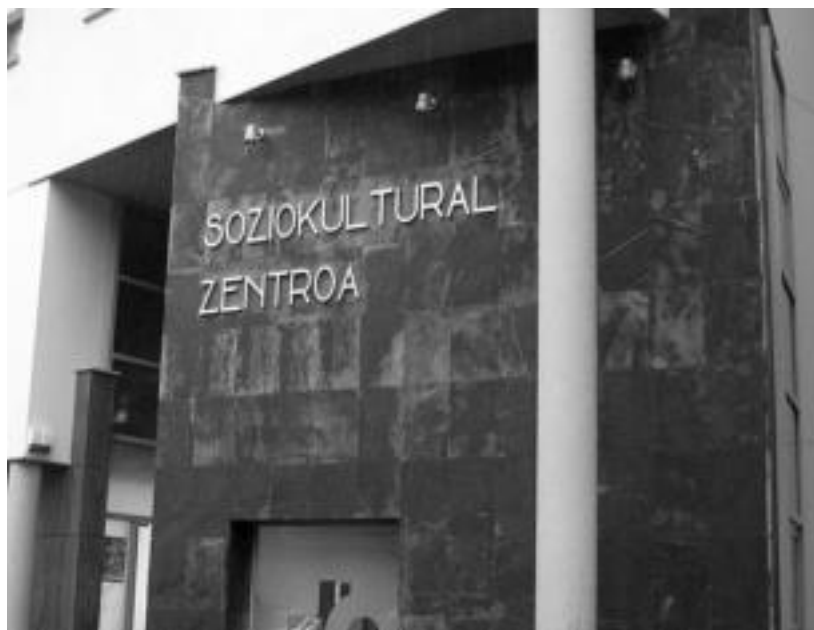
Soziokultural Zentro berria; martxan dira dagoeneko bertako zerbitzu guztiak. I. GARCIA

Osakidetzako kontsultategia, KZgunea, elkarten bulegoa, erabilera anitzetarako bi gela eta liburutegia ditu