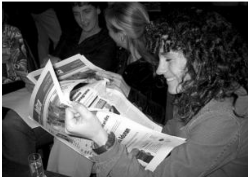
Zenbait lagun, TOLOSALDEKO ETA LEITZALDEKO HITZA irakurtzen. JOXEMI SAIZAR

Eusko Jaurlaritzako Kultura sailak 37.437 euroko diru laguntza emango dio TOLOSALDEKO ETA LEITZALDEKO HITZARI, iaz baino 29.925 euro gutxiago