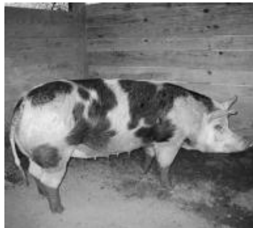
Afrodita izena jarri dioten txerriari atzo egindako argazkia.