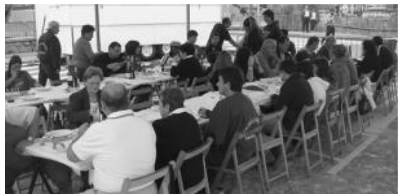
Babarrun jatea egingo dute Amezetan; argazkian, Tolosan egindakoa, Berazubiko festetan. M. SAN SEBASTIAN

Triki poteoa egingo dute bazkariaren aurretik; Hernanira joateko autobusa antolatu dute festarekin han jarraitzeko