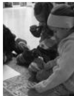
Guztien eginahala behar! J. ASTIBIA

Izan ere, jostetan hasi aurretik, gurasoek hitzaldia izan zuten Olatz Aldabaldetretu pedagogoa emana, Kometa elkarte kidea bera, eta «jostailu eta jolas kooperatiboak» izan zituzten mintzagai. Bertan umeen heziketa eta formakuntza jostetan duen garrantziaz aritu ziren, «lankidetzeta, elkar-kidetzeta, partekatzea moduko baloreak erakusteko oso tresna baliagarria» dela kontutan hartuta: «Haurrak jolasean ari diren bitartean jarrera batzuk edo beste batzuk baloratu dai-