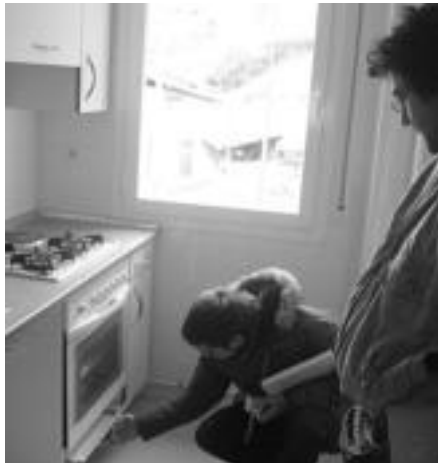
Etxebizitza barrutik ikusteko aukera izan zuten atzo horiek egokitu zaizkien herritarrek. I. TERRADILLOS