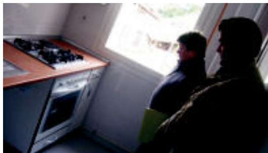
Bertan biziko direnak, atzo, etxebizitzak barrutik ikusten. I. TERRADILLOS

2003ko uztailaren 11n izan zen etxebizitzaren zozketa; ostiralean kontratua sinatu eta giltzak jasoko dituzte ▶ 6