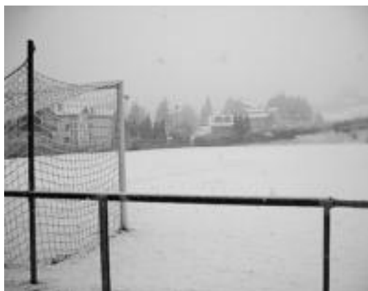
Otsailekoan ere, aurreko denboraldian, ondorioak eragin zituen. J. A.

Eguraldi kaskarra medio, Aurrerako bi taldeek ez dute jokatzetik izan