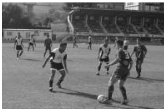
Berazubira jokatu zuen larunbatean Tolosak; artxiboko irudia da.