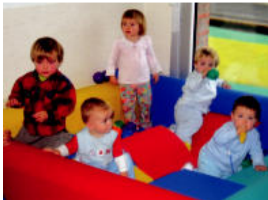
Kuttuna Haur Eskolako umetxoak, atzo, jolasean. J. GOIKOETXEA

ZERBITZUA ▶ Martxan da, eta 14 haur joaten dira; 25entzako lekua du ▶ 4