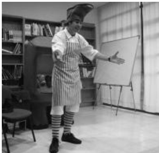
Liburutegian atzo egindako ipuin kontaketa une bat. I. GARCIA

Gorringo taldeak 'Antonino Apreta' ipuin kontaketa eskaini zuen atzo