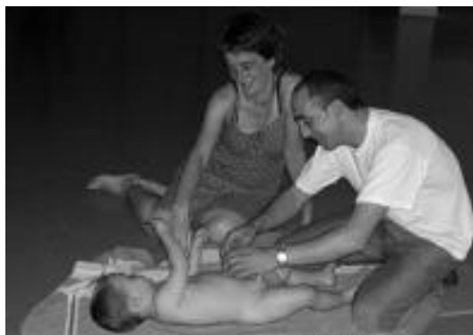
Haurdun daudenentzat masaje ikastaroa egingo dute. UROLA KOSTAKO HITZA

Ikastaroan parte hartu nahi duenak Haur Eskolan eman beharko du izena.