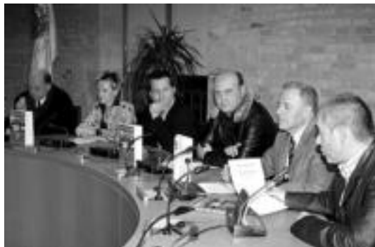
Iragan asteazkenean egin zuten aurkezpen ekitaldia.