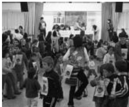
Euskararen aldeko festa egin zuten Erletan. J. ASTIBIA