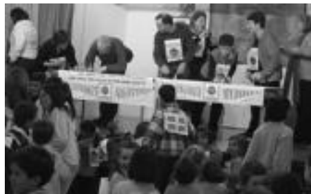
Irakasle eta langileek ere beste hainbeste egin zuten. J. A.