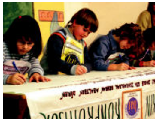
Bai Euskarari ziurtagiria dutenek abian jarri dute ekimena. J. ASTIBIA

Atzo, konpromisoak sinatu zituzten Erleta eskolan, festa giroan ▶ 7