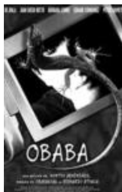
Filmaren kartela. HITZA

beraz, asteburuan etxeko idazle baten lana pantaila handira moldatuta ikusteko. Estreinaldiaren garaian sarrerak lortu ezinik ibili zen jendeak egun hauetan izango du filma ikusteko aukera etxetik oso urrun joan gabe.