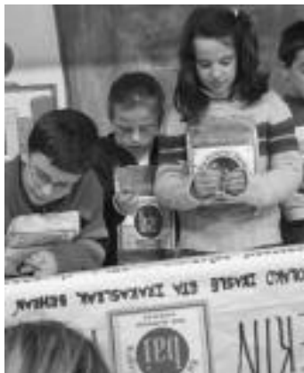
Ikasleek konpromisoak sinatu zituzten. J. A.

Bai Euskarari ziurtagiria duten eragileek abian jarri dute 'Herria euskaraz jantzi' ekimena hurrengo hilabeteetarako