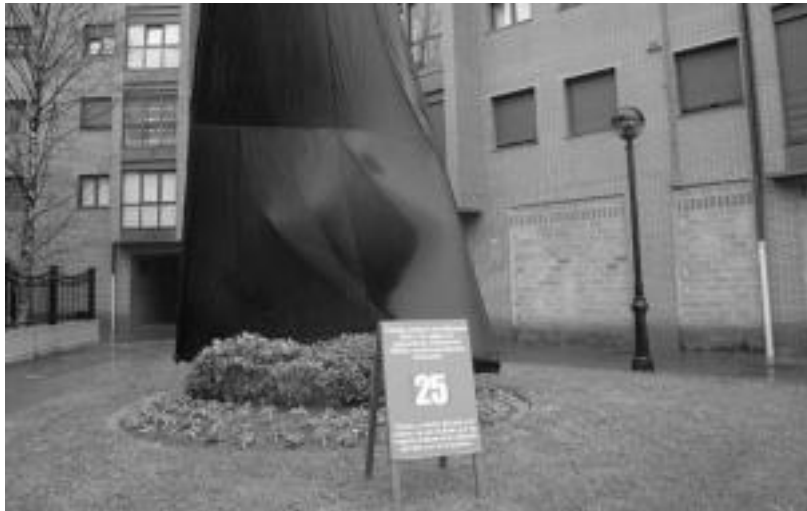
Tolosako hainbat eskultura estali zituzten, emakumeenganako indarkeria salatzeko.