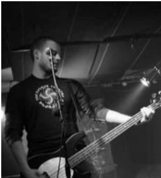
Lehendakaris muertos taldeak gaur joko du, 22:30ean. HITZA

Bonbereneako eszenatokia, bestalde, festa kolorez jantzikoa da datorren astean; izan ere bere 6. urteurrenaren ospakizunei hasiera emango diete