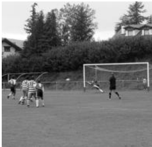
Abruzatezaina penalti bat gelditzen, arxiboko irudian. JAIONE ASTIBIA