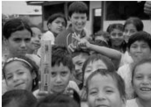
Ekuador, India eta Honduras laguntzea izango du helburu. HITZA

Ibarratik Misio taldeak herri-tarrek parte hartzeri animatzen ditu, horrela, dituzten