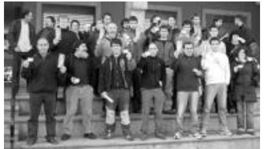
Bide Eginez-eko batzarkideek EHNA egiteko deia luzatu zuten. HITZA

Anoetari eta Euskal Herriari buruz atera dituzte ondorioak ezker abertzaleko kideek