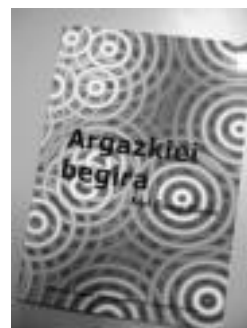
Olerki liburuaren azala.