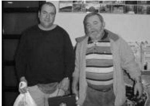
Mus Txapelketako irabazleak euren sariarekin.

Bada zertaz gozatua oraindik herrian, etzitik igandera hainbat ekitaldi izango baitira.