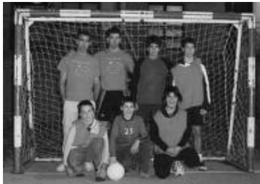
Aurtengo futbol txapelketako irabazlea izan den taldea. HITZA