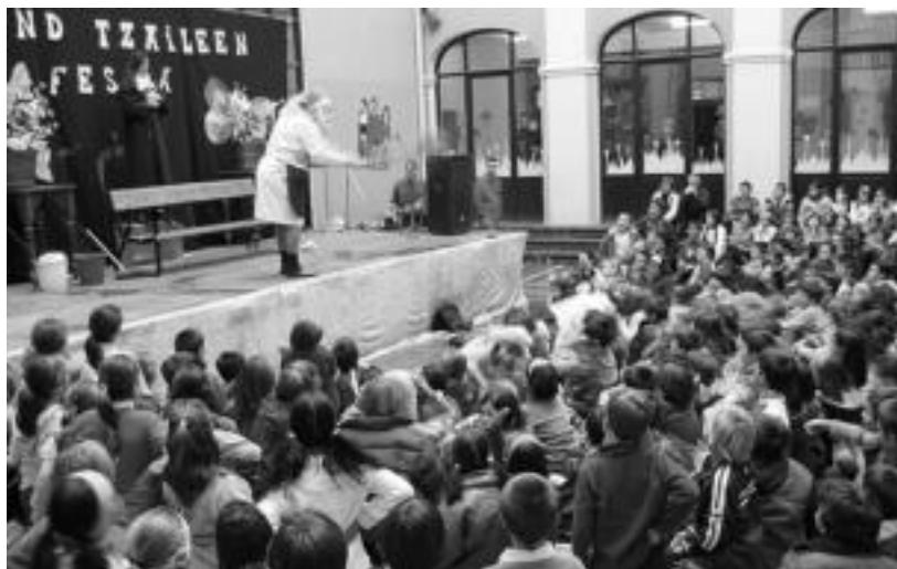
laz bezala aurten ere askotariko ekitaldiak antolatatu dituzte Hirukide ikastetxean. LEIRE MONTES