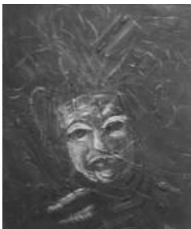
Indigenen tradizioa. Kulturaren adierazle. HITZA