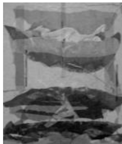
Emakumea biluzik. Beste gai bat jorratuz. HITZA

teko aukera badago, eta haien prezioak tabernan bertan aurrki daitezke.