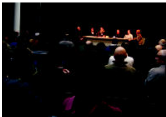
70 lagunek hartu zuten parte bileran, Tolosako Kultur Etxean. N. LATABURU

PROIEKTUA ▶ HITZAko ordezkariak, lehenengo bileran, babesa eskertu eta lasaitasuna eskatu dute ▶ 2