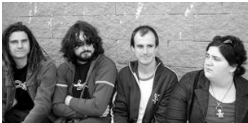
Zea Mays taldeko partaideek kontzertua eskainiko dute gaur, 22:30ean, Bonberenean. HITZA