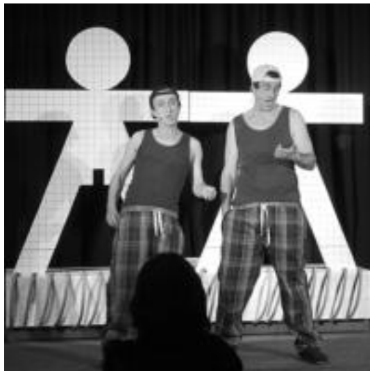
Larru Haizetara antzezlaneaneko une batean.

Zizurkilgo Atxulondo kultur etxean izango da, eta ondoren Umorezko Bakarrizketen Lehiaketako Sariak banatuko dira