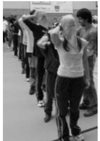
Orientazio jolasean aritu ziren. I. TERRADILLOS