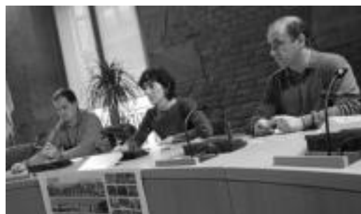
Atzo eguerdian jakinarazi zituzten irabazleen izenak. NOELIA LATABURU

300 herritarrek bidali dituzte argazkiak; irabazleek euren sariak jaso zituzten atzo