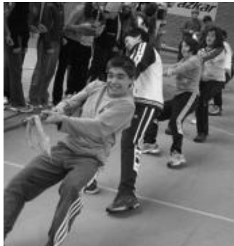
Ederki saiatu ziren gaztetoak sokatiran. IÑIGO TERRADILLOS