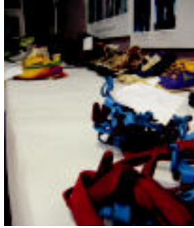
Eskiak, botak, jertseak, zirak, niki eta galtza termikoak, zakuak, kanpin dendak... daude salgai. LEIRE MONTES