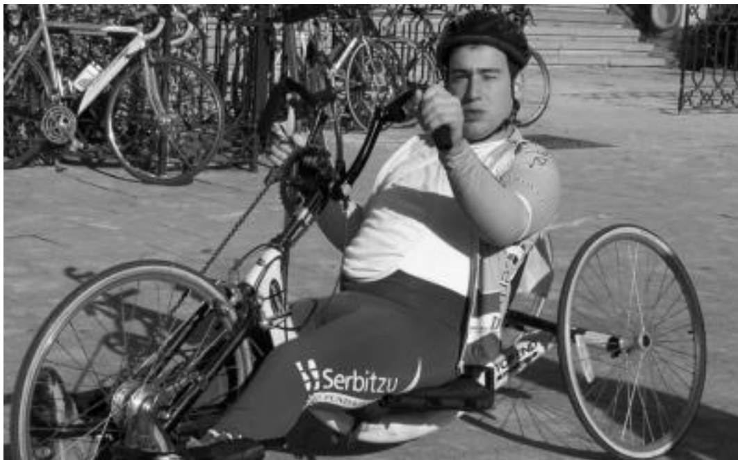
54 atleta elbarrik parte hartuko dute aurtengo edizioan. KEMEN

1983an atera ziren lehen aldiz elbarriak Behobia-Donostia proban; Kemen elkarteak gero eta ezindu gehiagok kirola egitea lortu nahi du