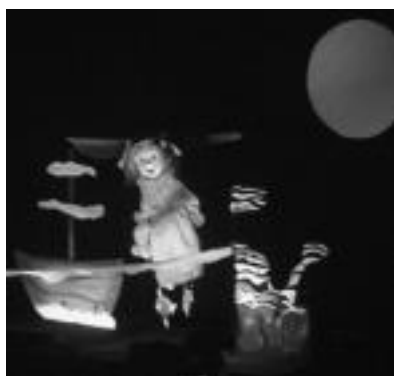
Amezketan egindako txotxongilo emanaldia —ezkerrean— eta Alkizan jolasean.