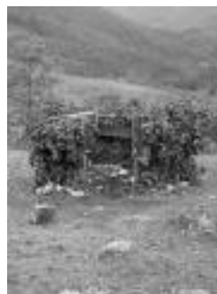
Horrelako kuxidaderik! J. L. H.

Derrigorrezko Bigarren Hezkuntzako 4. mailako ikasleak ikasturte bukaeran egin nahiko luketen ikasbidaia ahalbideratzeko beste ideia bat izan omen da honako hau: «Ehiza denboraldiaren bukeran kartutxo-azalak bildu behar izaten dituzte ehiztariak eta lan hori egiteko prest gaude, diru baten truke», dio; «prezio kontuak ehiztarien