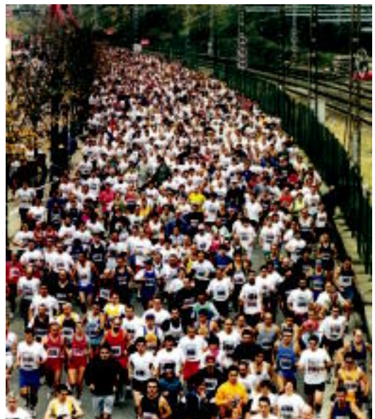
Santurtzi-Bilbo maratoi erdia; sardin saltzaileen bidea jarraituz.

Europar ere sona handiko lasterketak egiten dira. Iraila bukaeran izan zen Berlingo maratoi. Milaka pertsona elkartu zen, kirola eta jai uztartuz. Londresko maratoi da famatuena, baina. Ohi legez, udaberri partean egingo da, apirilaren 23an, eta 40.000 lasterkari inguru bilduko ditu. Saso berean, Rotterdango maratoi ere jokatu da. Ibilbide-erik ederrena, ordea, Pariskoak du eta apirila hasieran izaten da. Apurka-apurka haziz doa. Iaz 35.000 lagun inguru elkartu zituen.