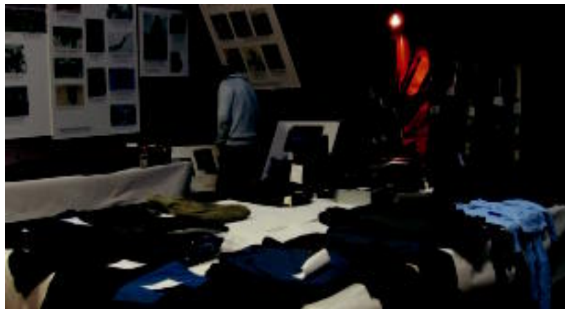
Bihar arte dago zabalik merkatu txikia; euskal mendizaletasunaren historia ere ezagutu daiteke.

TOLOSA ▶ Mendiko materialaren merkatu txikia antolatu du Oargi elkarteak, Mendi Hamabostaldiaren baitan; aukera zabala dago, eta modu onean