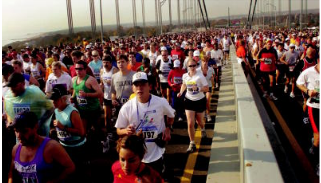
New Yorkeko maratoi entzutetsua da, dudu izpirik gabe, munduko lasterketa herrikoia eta koloretsuena.

Duela zortzi urte sortu zen Donibane Lohizune eta Hondarribia arteko maratoi erdia. Ibilbidea Thiers bulebarrean