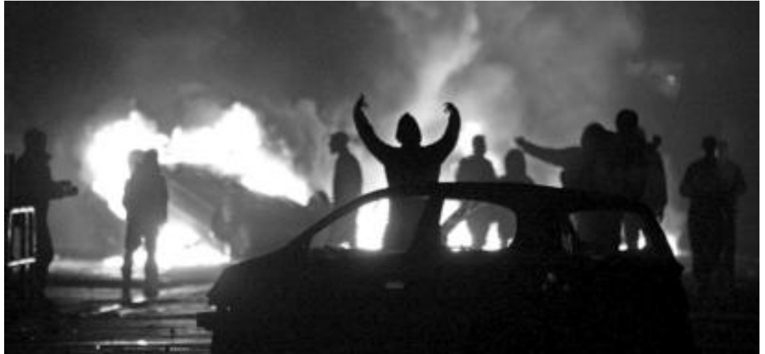
Pariseko Aulnay sous Bois auzoan gazteek su eman zieten hainbat autoei. Argazkian, hilaren 3an gertatutakoaren irudi bat.