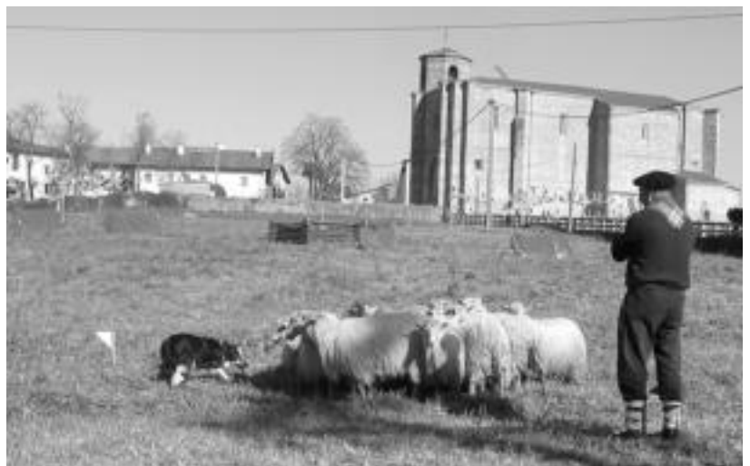
Artzain zakur lehiaketa izan zen eguneko ekitaldirik bereziena, atzo, Amasan.

San Martin jaiek jarraipena izango dute gaur Amasan. Herrikoen eta gazteluarren arteko lehia izango da ekitaldi erakargarrienetakoa. Eguerdian izango da hori. Goizean goiz haurren krosa egingo dute. Apustu eta gero, herri bazkaria egingo dute txekor jatearekin. Txiste kontalariak arratsaldetan eta gauean, azkenik, bertso jaialdia eta dantzaldia Abiba DJ-arekin.