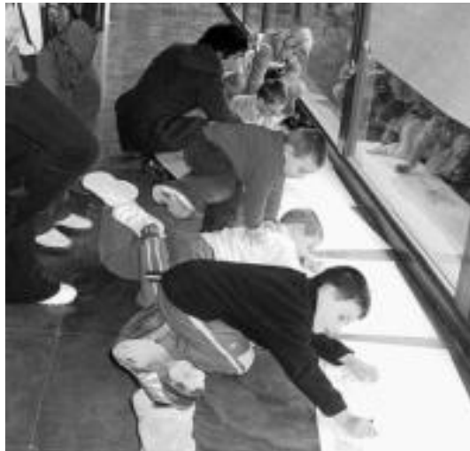
Nolako Asteasu nahi duten marraztu zuten haurrek. HITZA

Beste egitasmo batzuk ere martxan dira herrian Agenda 21aren inguruan. Aurreko astean bi ekintza burutu zituzten. Alde batetik, ostegunean Pello Errota ikastetxeko guraso elkartearekin bilera izan zuten, eta bertan Agenda 21ari buruzko azalpena egin zen. Gurasoen gehiengoak zerbait positibotzat jo zuten proiektua, baina bestelako iritzia ere izan ziren. Adibidez, guraso batek Asteasun Agenda 21a ezartzeko interesa berandu iritsi dela aipatu zuen. Herritarrek parte hartzea deitu gabe, Asteasuk