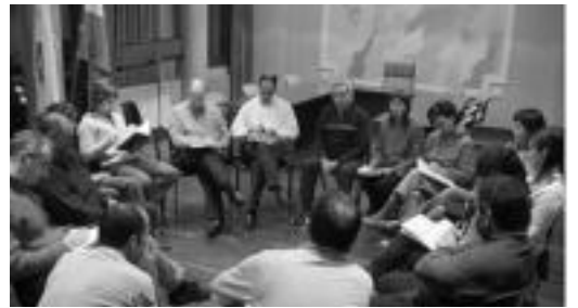
Herenegun arratsaldean egindako bileraren une bat. I. GARCIA