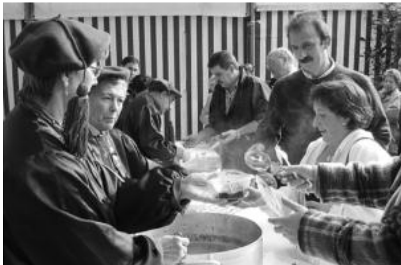
Babarrun Astearen harira antolatu ditu Gure Kaiola elkarteak lehiaketa eta herri bazkaria. JOXEMI SAIZAR

Ferialekuan bertan prestatu beharko dute babarruna parte-hartzaileek, 08:30etik aurrera, eta «13:00etan izango da babarruna ateratzeko ordua». Babarruna antolatzaileek jarriko duten bezala, norberak eraman beharko ditu prestatzerakoan erabiliko dituen osagaiak. Gure Kaiola elkartearen esanetan, «arauak betetzen ez