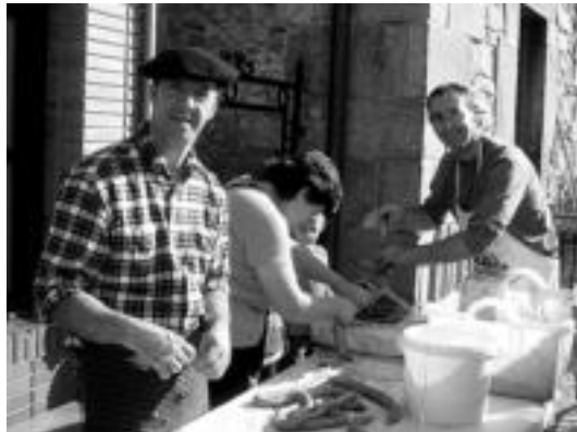
Eguerdi aldera erakustaldi polita egin zuten herriko plazan.

160 lagun bildu ziren plazan bazkari legea egiteko; antolatzaileak oso gustura daude izandako harrerarekin