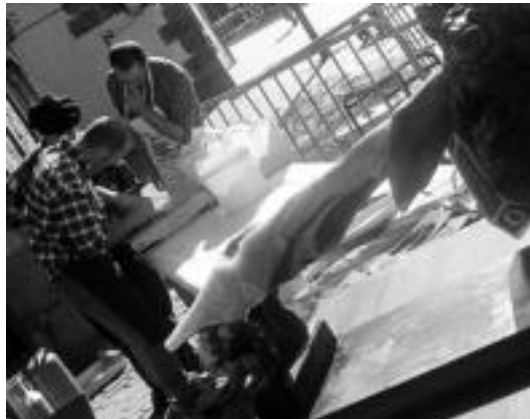
Itxura hau hartu zuen urdaiazpikoak erakustaldiaren ondoren. I. T.