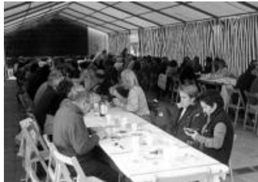
160 lagun inguru bildu ziren babarrun jatean. I. TERRADILLOS