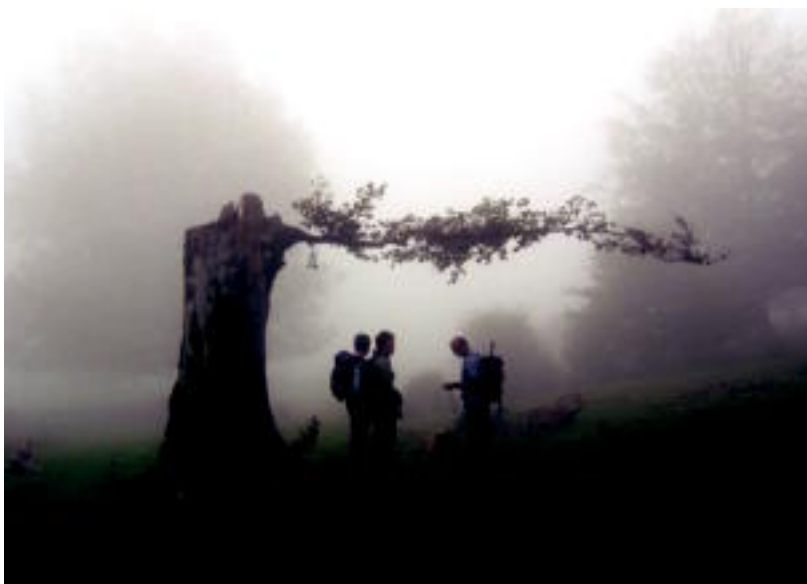
Aizkardi (Villabona). Hauxe bezalako paraje ederretaz gozatzeko aukera izango dute mendizaleek.

TOLOSALDEA ▶ Andoin-Santa Luzia irteera antolatu du Villabonako Aizkardik, eta Sodupe-La Arboleda Tolosako Alpino Uzturrek; izen-emateak, zabalik