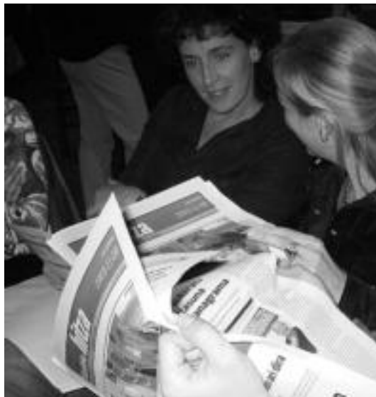
lazko harpidedun ordaintzaileen kopurua mantendu egin da. HITZA

45 eurokoa izan da aurtun eskualdeko euskarazko egunkaria egunero etxean jasotzeagatik harpidedunei eskatu zaien diru kopurua. Urrian ze-