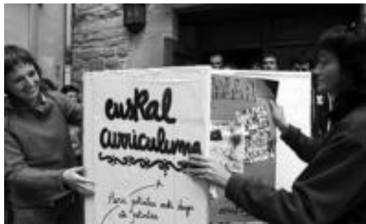
Tafallan eman zioten hasiera herriz-herriko ekimenari. ARGAZKI PRESS

Amazabaleko ikasleek beren ekarpena egingen diote Curriculumari, arratsaldeko ongietorriko ekitaldian, plazan