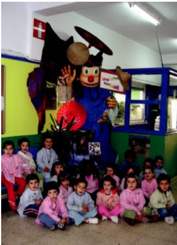
Samaniego ikastetxeko txikiak, mundu osoko jantziekin dotore-dotore apaindutako Mantto maskotaren inguruan. HITZA