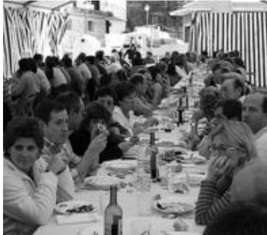
Hauspoak antolatutako iazko babarrun festa.

Bestalde, bazkarirako txartelak Ibarako tabernetan edo elkarteetan eskatuta lortu ahal izango dira, helduentzat 12 euroren truke eta haurrentzat 3 euroren truke. Hauspoa elkar-teak gonbita luzatzen die herri-tar guztiei bihar herriko plazara azaldu, erakustaldi berezia ikusi eta «babarrun eder» batzuen bueltan egun-pasa polita igarotzeko.