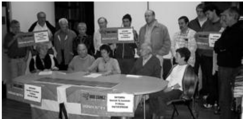
Herenegun arratsaldean aurkeztu zuten Bide eginez barne eztabaida prozesua. HITZA

Bi egunetan egingo dituzte batzarrak herriz herri; Tolosan, hilaren 12an izango da horietako lehena, Kultur Etxean