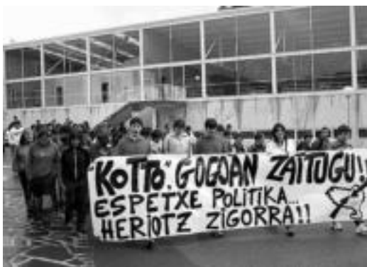
Amazabaleko ikasleek herriko kaleak zeharkatu zituzten.

Sakabanaketa salatuz, manifestaldiak egin dituzte Tolosaldeko eta Leitzaldeko ikasleek