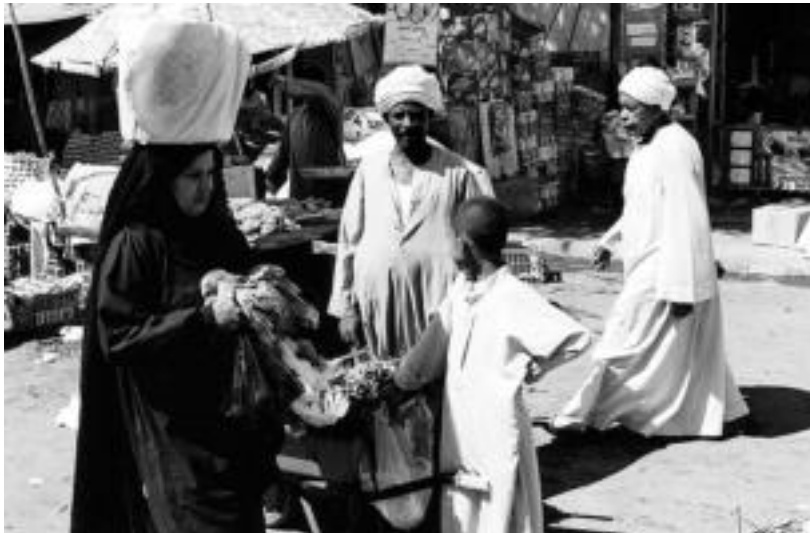
Magrebeko herrialdeetako ohiturak eta kultura ezagutzeko aukera izango da jardunaldien bidez. I. ETXEBESTE

Hitzaldiak, proiektzioak, erakusketa... izango dira jardunaldi horien ardatz; hilaren 8an hasi, eta 12an bukatuko dira