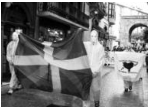
Solidarioak joan ziren buruan Tolosako manifestazioan.