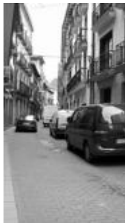
Auto asko ibiltzen da kalean. o. e.

San Joan kalean sarbidea izateko txartela eskuratu nahi duten bizilagun zein dendariak Udalera joan behar dute. Kasuan kasuko tasa ordaindu beharko da, eta ordutegia errespetatzea behartuko dute.