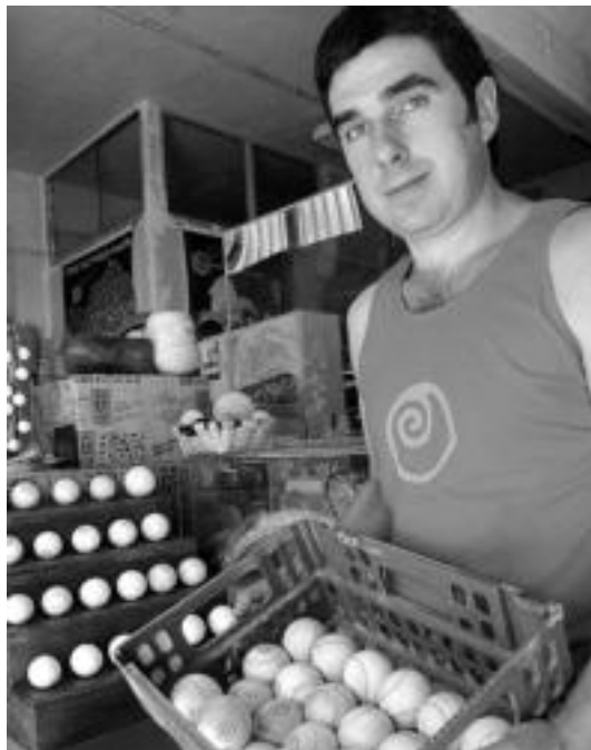
Egunean pilota dezente egiten dituzte.

Orain urte batzuetatik hona pilotak egiteko modua ez dela asko aldatu dio, nahiz eta zenbait berrikuntza egon badauden. Esaterako, lehen egurrezko bolatxo bat, ezpela izenekoa, erabiltzen zen pilotaren bihotza egiteko, eta egun plastikozko kanikak erabiltzen dituzte. Material aldetik sumatzen den aldaketa nagusia hori