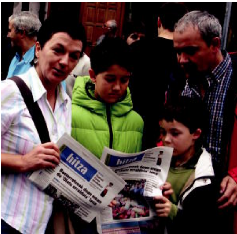
Atzo, BUSTURIALDEKO HITZAREN 0 alea banatu zuten eskualdea osatzen duten 20 herrietan. HITZA

egunkariak, eta Elantxobe, Ereño, Gautezig-Arteaga, Gernika-Lumo, Ibarrangelu, Mendata, Muxika, Forua, Kortezubi, Murueta, Nabarniz, Ajangiz, Arratzu, Bermeo, Busturia, Ea, Morga, Mundaka, Errigoiti eta Sukarrietako berri emango du, asteartetik igandera. «Kalitatez dugu helburu, pluralak izango gara eta euskaltzaleak».