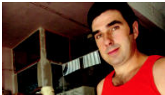
Egunean pilota dezente egiten ditu Oterok.

Anoetan duen pilota lantegia da pala luzeko profesional izandakoaren frontoia egun; ahuntz larrua erabiltzen du ▶ 3