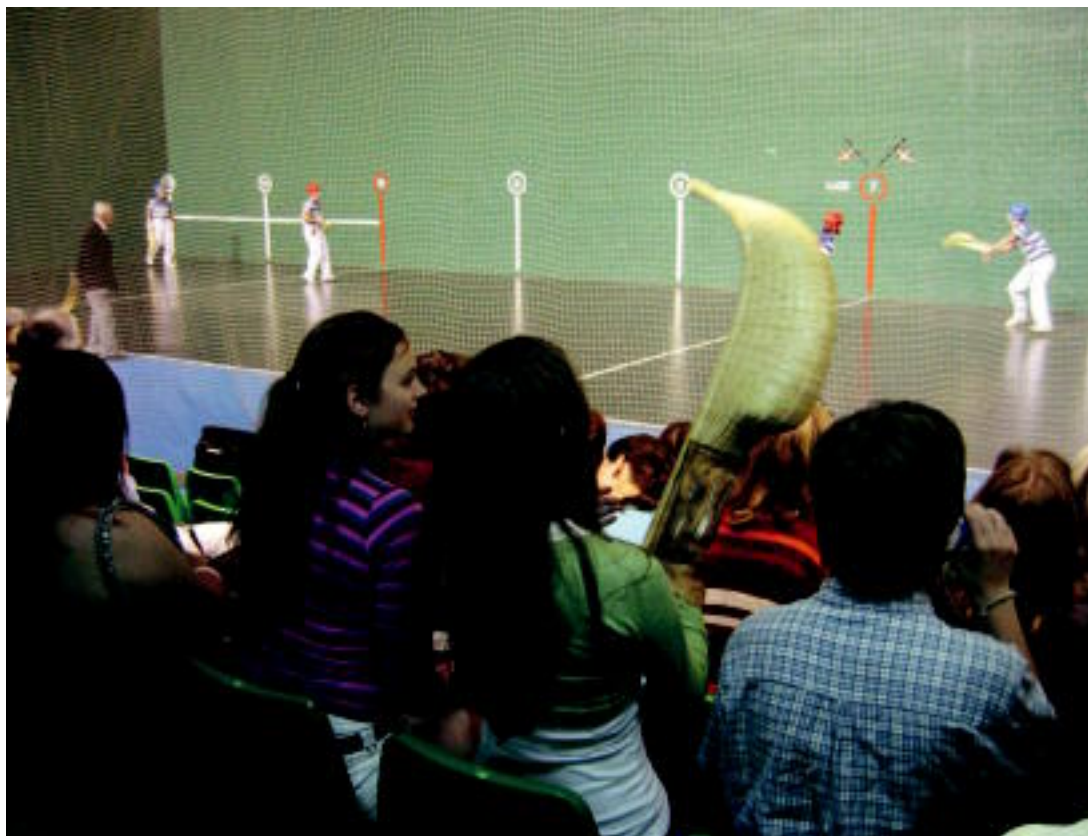
Zesta-punta erakustaldia egin zuten atzo abesbatzetako kideentzat Beotibarren; ikusleen artean bi saski banatu zituzten, aztertzeKO. IMANOL GARCIA

EPAIA ▶ Gaur emango dute Usabal kirolgunean izango den itxiera ekitaldian; 11:00etan hasiko da ▶ 6-7