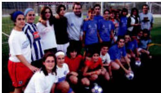
2005-2006 Ligarako Tolosa taldea, ia osorik, Usabalen.

Bikain ari da Emakumezkoen Ligako Tolosa, berriro iguera fasearen bila ▶ 4