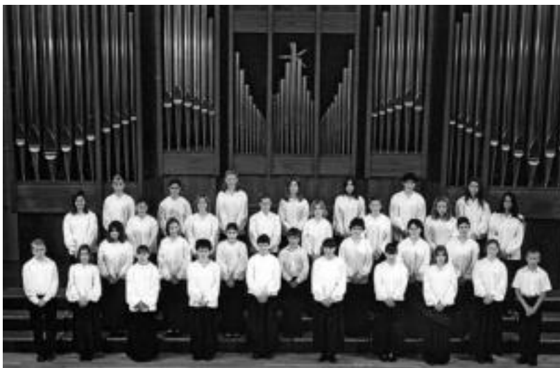
Israelgo Tel Aviv hiriko Bat Kol Children's Choir ere Haurren Abesbatzekin lehiatuko da biharkoan. HITZA

hiru abesbatza finalistetako bat bezala Londreseko Let the peoples sing ospetsuan parte hartzeko. 2003an, Amerikako Estatu Batuetako zuzendariaren batzarrean nazioarteko gonbidatu gisa abestu zuen.