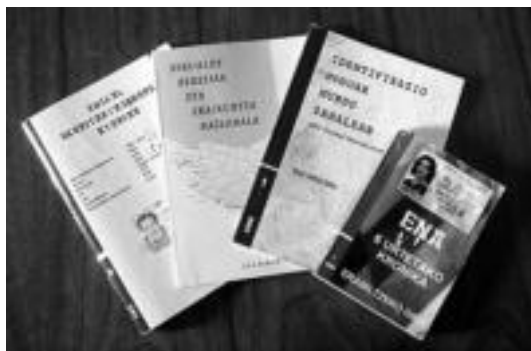
Euskal Nortasuna Elkarteak argitaratutako zenbait libururik. HITZA

Biharko ekitaldiak 11:00etan hasiko dira, Euskaldunki konpartaren kalejirekin. Ordu berdinean egingo da harrera, adarra eta txalapartarekin.