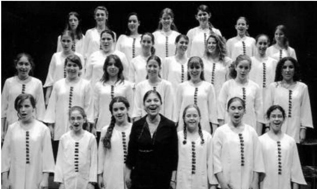
Hungariako Kecskemét hiriko Miraculum Children's Choir-ek eskainiko du emanaldia biharkoan Haurren Abesbatzen lehiaketan.