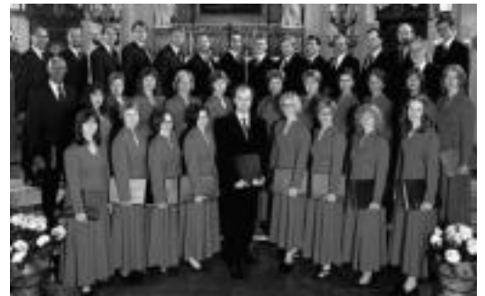
Suediako Maria Magdalena Motettkör-ek jardungo du gaur. HITZA

Musika erlijioso, folklore eta polifonia sailetan parte hartzen duten abesbatzek jardungo dute gaur 37. Abesbatza Lehiaketan: 11:00etan hasiko dira musika erlijiosoa interpretatuko duten abesbatzen saioak, 16:00etan eta 19:30ean folkloreakoak, eta 19:30ean polifonian lehiatuko direnak.