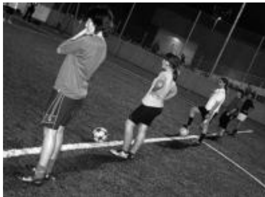
Lan saioetako batean, neskek entrenatzaileen aginduei adi. I. ETXEBESTE

Astean hirutan elkartzen dira Tolosa CFkoak Usabalen. Astelehenetan eta asteazkene-tan denak joaten dira lan saio-etara, eta ostiraletan «fitxa dugunak baino ez». Izan ere, 25 jokalarietatik 19k soilik dute partiduetan zelaira ateratzeko