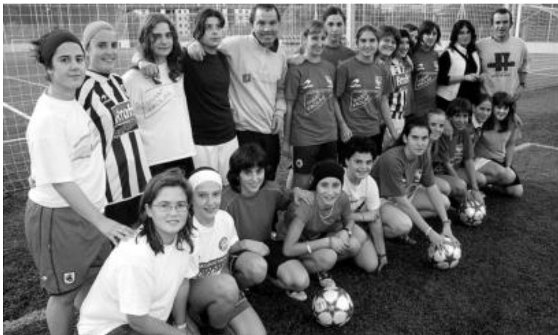
Tolosa CF osatzen duten neskek igoera fasea jokatzeko dute xede. Hogeita bost jokalarik daude taldean; batzuk falta dira argazkian.