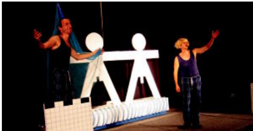
Romeo eta Julieta euskaldunak ere igo ziren Tolosako Kultur Etxeko taula gainera ostiralean.

TOLOSALDEA ▶ Kultur ekitaldi ugari izan da asteburuan, tartean 'Larru haizetara' antzezlanaren estreinaldia