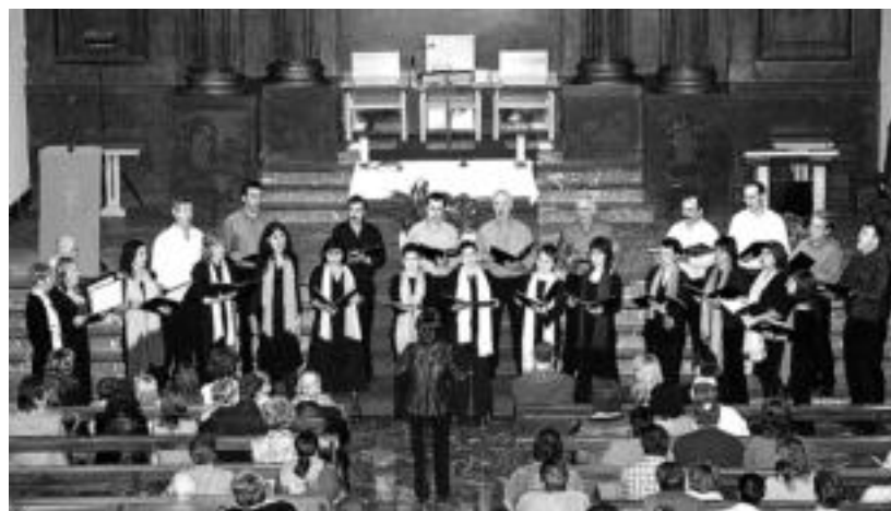
Gaztetxoaren ondoren, Txintxarriko helduek sei abesti kantatu zituzten. EDUARDO ARRAIET