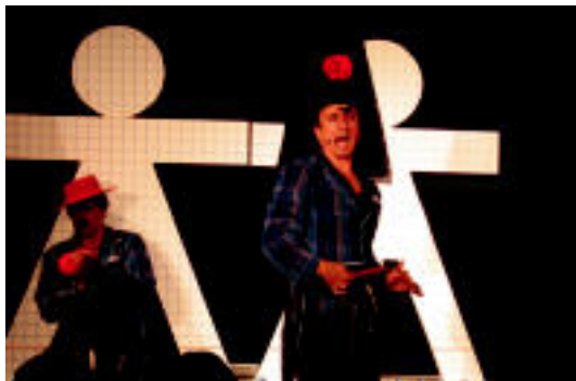
Andaluziako musika jarri zieten bertsoei bi aktoreek. J. SAIZAR

Ez dok Hiru bikoteatroaren Larru haizetara emanaldiaren estreinaldiak ez zuen jende asko biltzea lortu, baina bai joan zirenak barrez lehertzea. Umorea da nagusi bi aktore