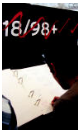
Ekarpenak egiten, atzo.

ALEGIA ▶ Txintxarri Abesbatza Kultur Elkartearen 45. urteurrena ere ospatu zuten igandean, emanaldi eta bazkariarekin ▶ 5