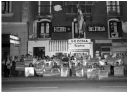
Urriaren 7an, Herri Biltokiari eginiko agur ekitaldian. HITZA

'Bide eginez' prozesua hasi dute; azaroaren 12an egingo dute lehen batzarra