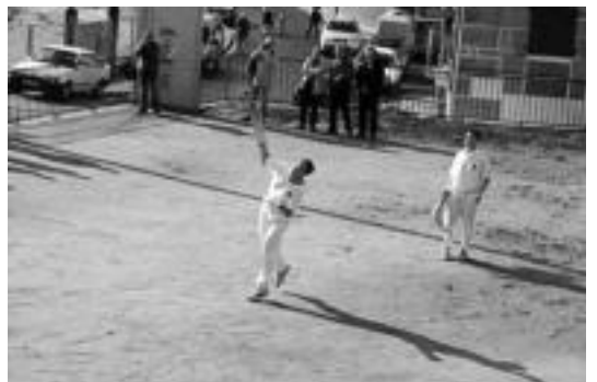
Behar-Zanako bi jokari partidaren une batean. HITZA