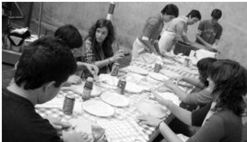
Alegiako gazte talde honek taloak egiten ikasi zuen atzo goizean. Goxo askoak egin zituzten. J. ASTIBIA

Gauean Batuketeko-rekin eta Lord Sassafra-ekin dantzaldia egitekoak ziren.