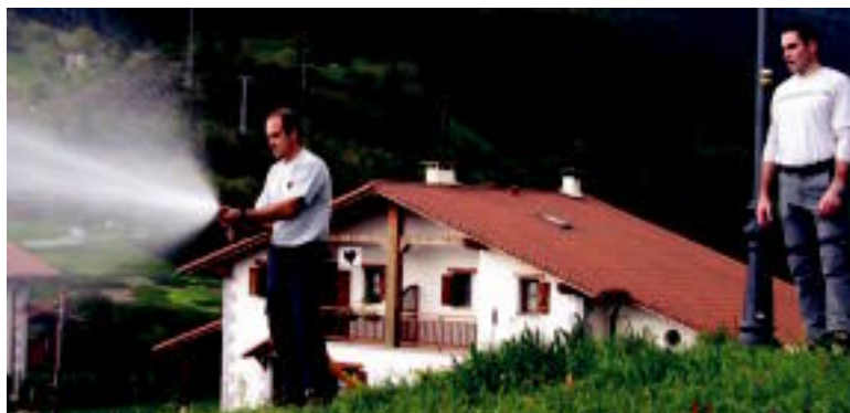
Bi suhiltzaileek pausoz pauso azaldu zizkieten herritarrei egin beharrekoak, azken punturaino, hau da, mangeratik ura botatzeraino. I. TERRADILLOS