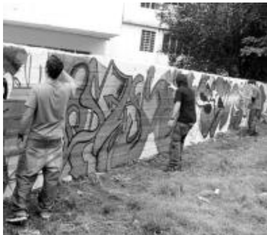
Irudiak eta koloreak nagusi Bonbereneako hormetan. J. ASTIBIA

Ez zen, ordea, musika saio bakarra izan atzoko festan. Handik aurrera, Kuraia taldeak bere azken lanaren aurkezpena egiteko baitzen hantxe bertan, Piztu da piztia diskoa, alegia.