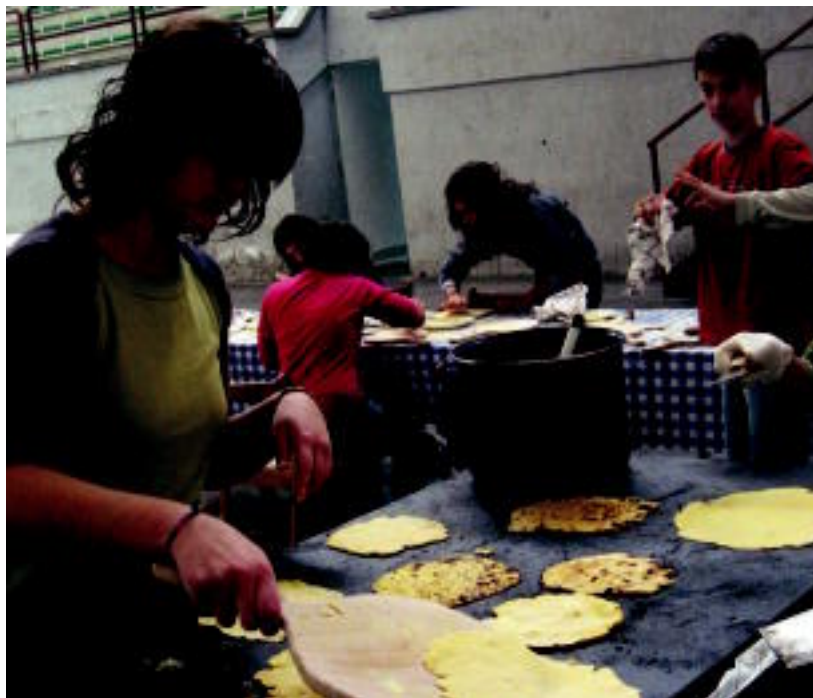
Alegian, talogintza tailerran parte hartu zuten gazteek atzo, Kultur Astearen lehen egunean. J. ASTIBIA

KULTUR ASTEA ▶ Auzo bazkariarekin agurtuko dute lehena; Alegian, Txintxarri Eguna ospatuko dute gaur ▶ 6