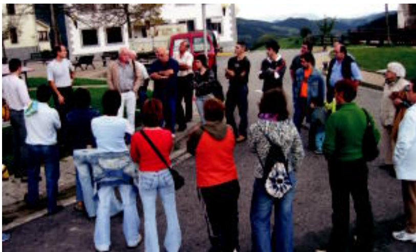
Herriko plazara bildutako jendeak adi entzun zituen suhiltzaileek emandako argibideak. I. TERRADILLOS

LEABURU-TXARAMA ▶ Tolosaldeko bi suhiltzaile izan ziren atzo herrian larrialdi baten aurrean sua itzaltzeko materiala nola erabili irakasten