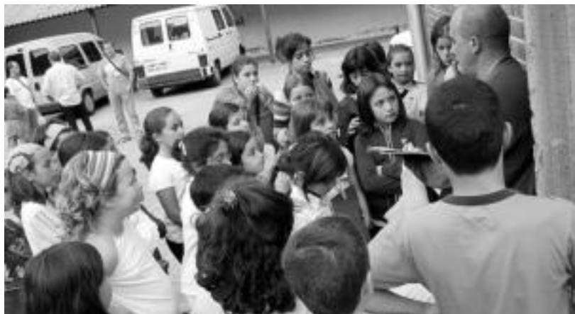
Auzoko umeak eta baita kanpokoak ere altxorren bila abiatu baino lehen, ariketak apuntatzen. J. ASTIBIA