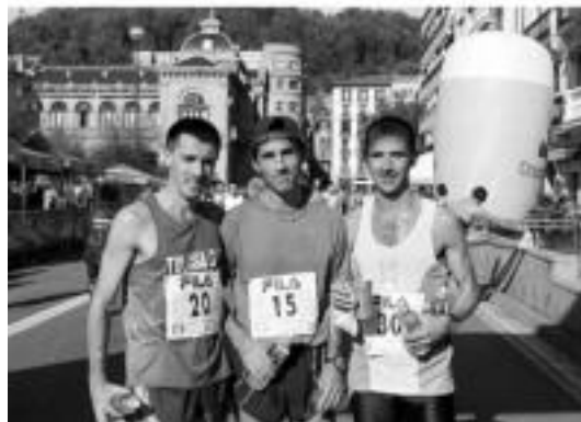
Arratibel, Otermin eta Gil izako edizioko eskualdeko lehenak. J. SAIZAR

Azkena. Ezin bada jarraitu, gel- ditu, astakeriarik ez egin. Kor- rikalari onak ere noizean behin erretiratu egiten dira, eta ez da ezer gertatzen.