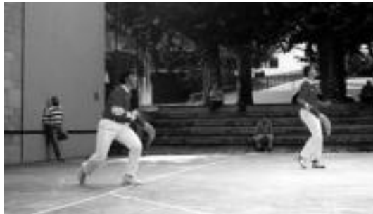
Behar-Zana taldeko bi jokalariek, erreboteko partida batean.