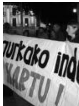
Konzentrazioaren une bat. HITZA

Gaur V. Skate Festa antolatuta dute Bonberenean. Honen harira, hainbat ekitaldi izango dira aukeran arratsaldeko lehen orduetatik. 15:00etatik aurrera graffiti erakusketa izango da etxean. Ondoren, 16:30ean, V. Bonberenea Skate Txapelketa izango da ikusgai, aurreko urteen arrakastari jarraituz. DJ batek giroa jartzen du. 19:00etatik 21:00etara, auzokideek antolatutako festa izango da. Gaur, 5 euroren truke.