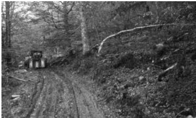
Maloko lotea, pagoa, ateratzen ari dira orain Leitzelarrean. Makinak lanean, herenegun. JAIONE ASTIBIA

Ehuneko hogeieko beherapenarekin, Zubillaga-Saralegi egur ustiapen enpresak hartu du Urdiñolako basoa