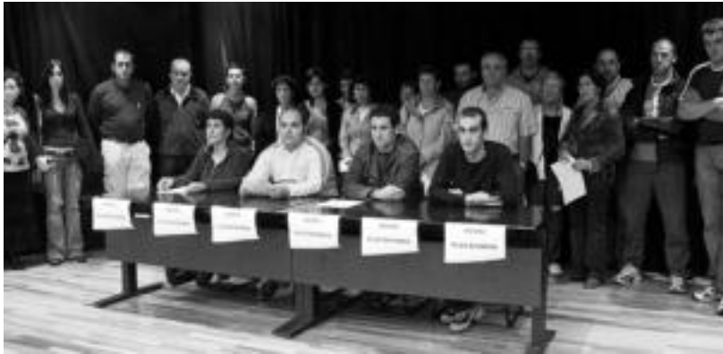
Ibarrako arau subsidiarioen harira sorturiko herri plataformaren aurkezpen ekitaldia, herengun. I. TERRADILLOS

Arauen tramitazioa gelditzea eta herri kontsulta egitea proposatzen dute