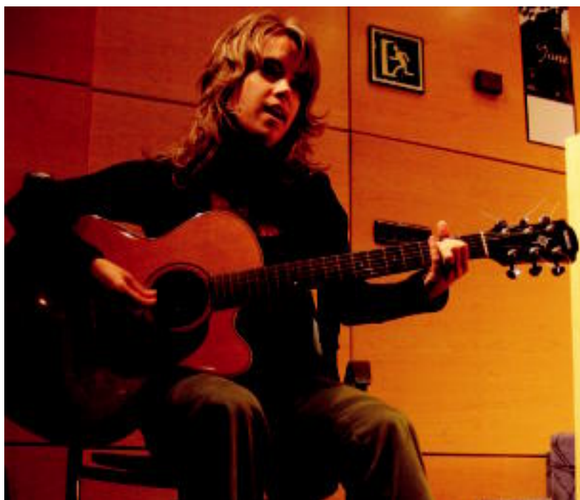
Jone anoetarrak abesti bat eskaini zuen, atzo, diskoaren aurkezpen ekitaldian. I. GARCIA

« ILUSIOA » ▶ Atzo aurkeztu zuen lana, Donostian; Bonberenea Ekintzak zigiluarekin grabatu du ▶ 4