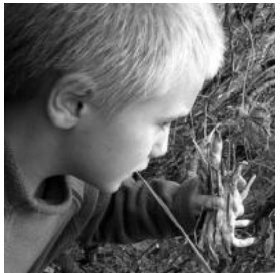
Samaniego ikastetxeko ikasleek babarrunak bildu zituzten. N. L.

Apirilean lurra behar bezala prestatu, eta maiatzean, San Isidron, hasten gara; gero hazia egiten hasten da. Landareak ura eta hezetasuna behar du; irailaren erdialdean biltzen hasten garen arte, belar txarrak eta lurra garbitzen dizkiogu. ◀