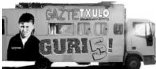
Gaztetxulo Busa Trianguloan geratuko da gaur arratsaldean. HITZA

«Euskarazko kultura gaztearen diagnostia egitea» omen da, antolatzaileen esanetan, solasaldi horien xedea. Urriaren 17an Donostiatik abiatu zen Gaztetxulo Busa , eta K be-laulandia izan zuten hizpide or-