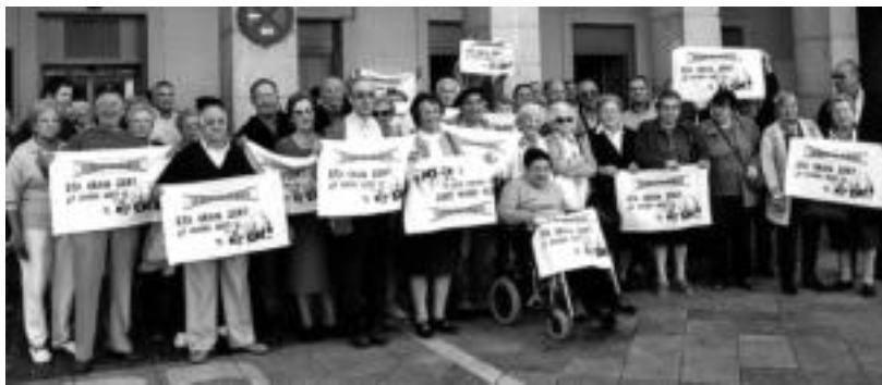
Tolosako Gerontologikoaren itxiera salatzen duen ekimen berria jarri dute abian plataformako kideek.

Hala bada, plataformaren leloa biltzen duen kartelak etxebizitzetako balkoietan zintzilikatzeko kanpainari ekitea era-