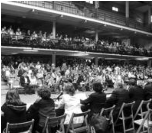
Frontoiko harmailak jendez bete ziren. INIGO TERRADILLOS