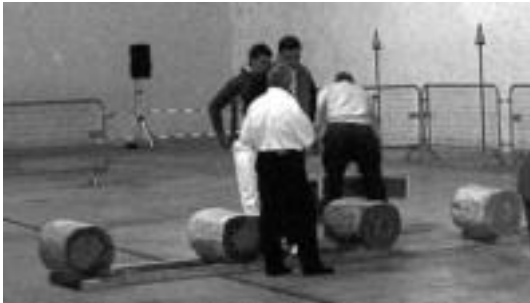
Pilotalekuan egurrak prestatzen apustuarekin hasi aurretik.

Bi aizkolari gazteentzat estreinako apustu ofiziala izan da, eta oso gustura daude egindakoarekin; halaber, «kirol zail eta gogor» honetan lanean jarraitzeko prest daudela aitortu dute.