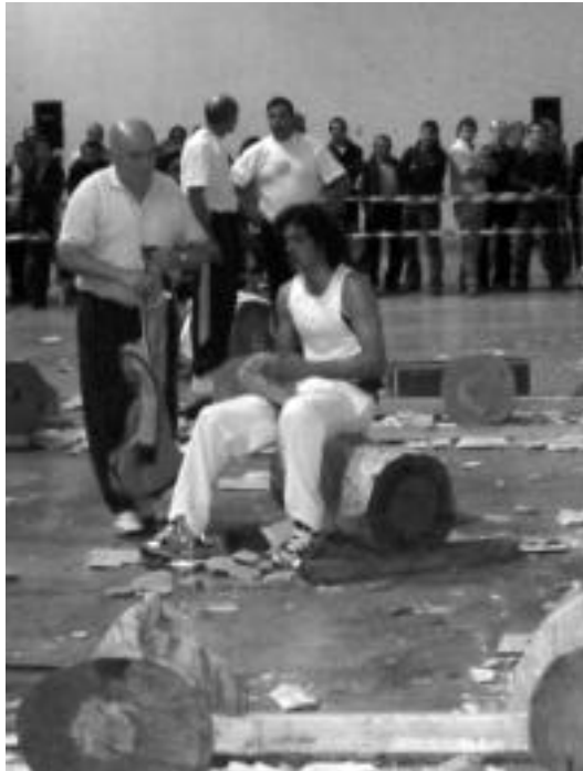
Jende ugari bildu zen Berrobiko Urreburu pilotalekuan. HITZA