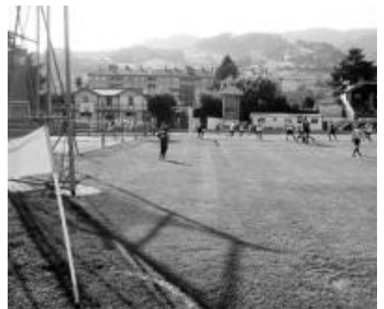
Berazubiri irabazi ezinik darrai Tolosak, zaletuen aurrean. IMANOL GARCIA

tzat hartuz. Hasiera ez zen baxterea izan, taldea irabaztera irten bazen ere. Indautxuk, 4-1-4-1 eskema erabili zuena, asko sufritu behar izan zuen puntua etxera eramateko, Tolosakoak gogor aritu baitziren erasoan. Lehen zatian bost kórner jaurti zituzten jarraian etxeokak, non azkenekoan Oruek langara bota zuen jaurtiketa. Baina baliokak ez zuten atearen bidea topatu neurketako «aukerarik argienean». Regillaga hegalean aritu zen, eraso une garrantzitsuak sortuz. Baina Indautxuk defentsa ona burutu zuen Bilboko Athletic taldeko Laka beg jokalaririk ohia bere hamakakoa izanik. Azken minutuetan Tolosak ez zuen presioa ondo burutu, eta balizko bi puntu galdu zituen. Etxeko hitzorduetan ez galtzea «garrantzi-