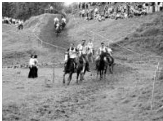
Denboraldian zehar Bidegoianen egindako lasterketa.

Bederatzi lasterketa jokatu dira urtarrilaz geroztik Gipuz-