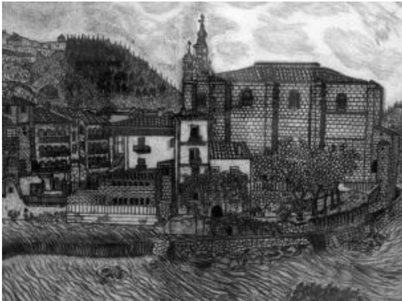
Tolosako Santa Maria eliza eta bere ingurua.