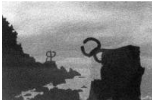
Agurtzane Nuñezeren lanetako bat. HITZA