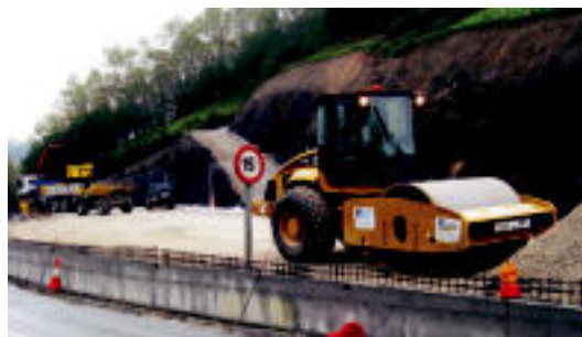
Lanak, Amezketa eta Abaltzisketa batzen dituen errepidean. M. S. S.

40 autorentzat lekua izango du; laster hasiko dira lurzorua txukuntzen ▶ 5