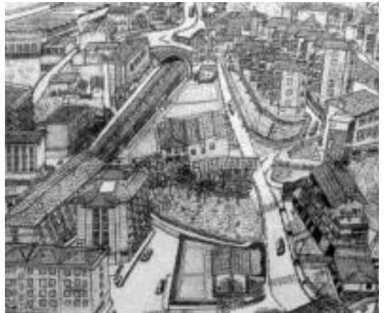
Anoetako herria azaltzen da erakusketako koadro batean. HITZA