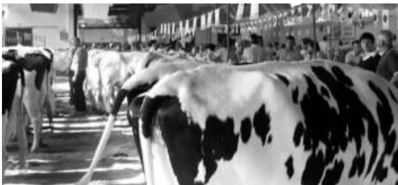
laz ere makina bat jende bildu zuen Probintziako Abelgorri Lehiaketak, Ferialekuan. OLAIJA ESKITXABEL

Suitza, frisoj, pirenaika, blonda, limousina eta txarolesa arrazako abelgorriak izango dira ikusgai, goiz osoan