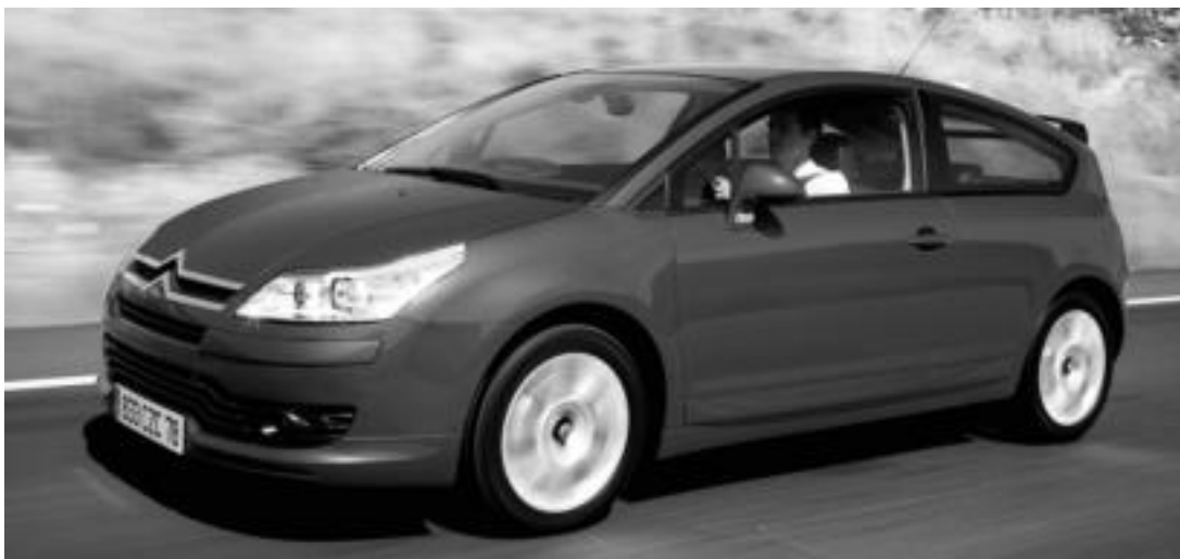
Citroen C4 izeneko autoa da Anoetako Irovisa Citroen saltokian salduenetakoa; «prezio eta kalitate harreman onagatik» hautatzen dute.