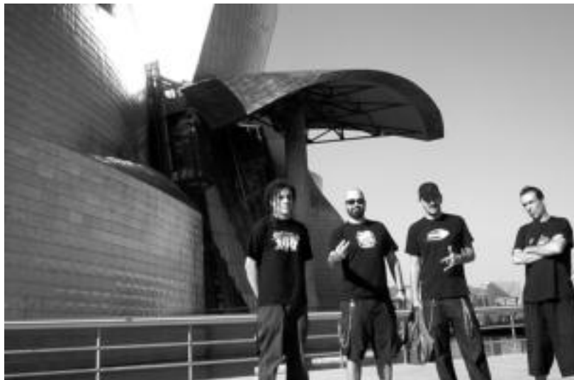
Def Con Dos taldea osatzen duen laukote madrildarra Bonbereneako taulan ariko da gaur gauean. HITZA