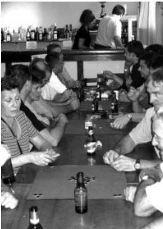
Mus txapelketak parte-hartze handia izaten du. I. TERRADILLOS

Igandea izango da jaiak emango duten azken eguna. Usadioei jarraiki, 11:00etan