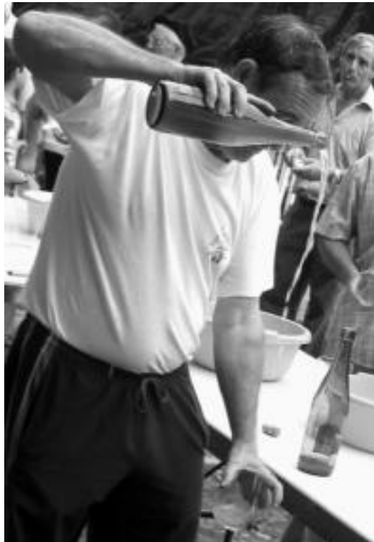
Asteburuan sagardo dastatzeko aukera izango da Adunan. J. ASTIBIA

Aurreko argudioak direla medio, Upelera izeneko Tolosaldeko sagardo asteburua antolatzea otu zitzaizen Adunako Muxkil elkartekoei, «sagardoak eta Tolosaldeak, historian zehar izan duten eta gaur egun ere daukaten lotura adierazteko asmoz. Gure festa edo asteburu honetan, sagardoaz gain, Tolosaldeako beste berezitasun edo baliabideak ere agra-