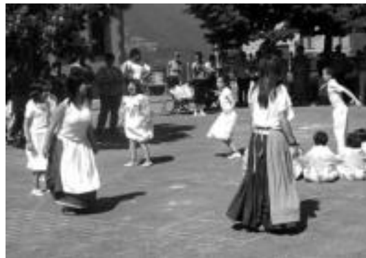
Herriko dantzariak egindako dantza saio bat.

Batuka. Modan jarri den gimnastika-dantza mota hau egiteko taldea osatu nahi dute. Astearen behin izango da, asteartean edo ostegunetan, gazte gelan, 19:00etatik 20:00etara. Sendabelarrak eta aromaterapia. Asteartean edo ostegunetan izango da. Inguruan ditugun landare sendagarriak erabiltzen ikasiko dute, eta baita aromaterapia ere. Gainera,