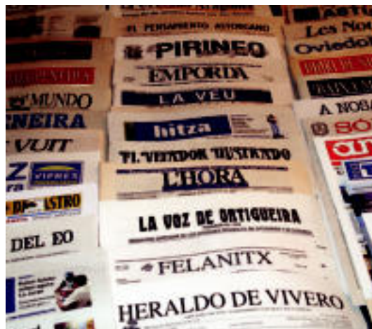
Txoko guztietako egunkariak bildu ditu kataluniarrak. J. M. RODRIGUEZ

«Oso egokia iruditzen zait HITZAN egiten duzuen, hau da, egunkariak eskualdeen arabera banatzea. Izan ere, ia denek dakigu Bush-i zer gertatzen zaion, eta gure seme-alaben ikastetxean pasatzen denari buruz ezer gutxi, aldi. Tokian tokiko egunkariak dira zailenak lortzen, baina gehiago asetzen naute, gertuko harremanak lotzen baitituz».