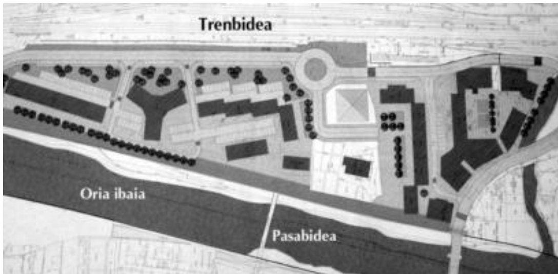
Ubare auzoko eraberritze obren aurreproiektuaren planoak. HITZA