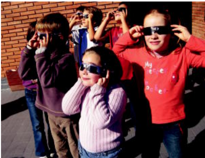
Ibarrako Uzturpe ikastolako haurrek, betaurreko ilunak jantzita, eguzkiari begira. INIGO TERRADILLOS

TOLOSALDEA-LEITZALDEA ▶ Bi eskualdeetako haurrek jakinmin handiz jarraitu zuten atzo eguzkiaren eklipse partziala, betaurreko ilun bereziak jantzita