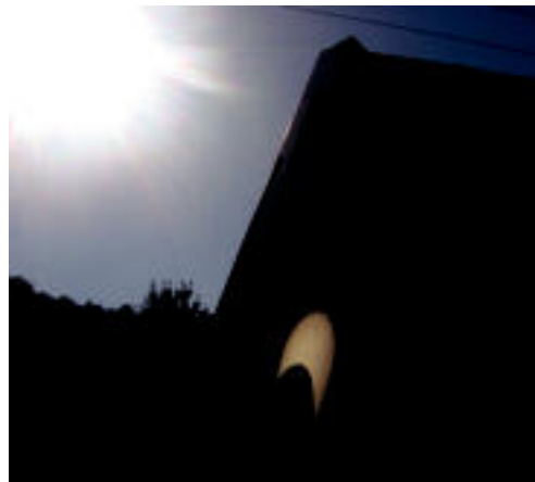
Teleskopioen bidez irudi bitxiak lortu zituzten Uzturpen. I. T.