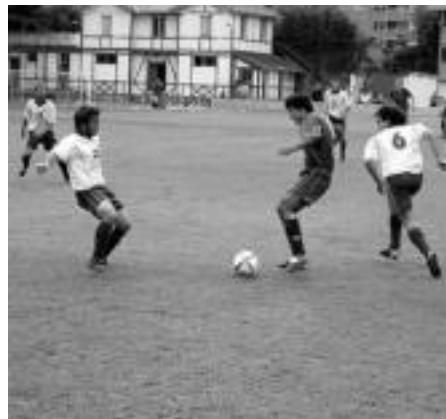
Tolosak balizko garaipena eskuratu zuen etxean. I. GARCIA