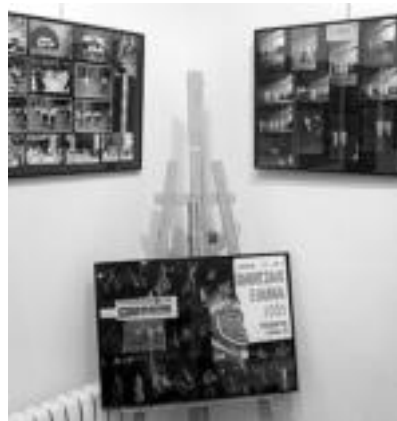
1974tik 2005era bitartekoak daude ikusgai. I. T.