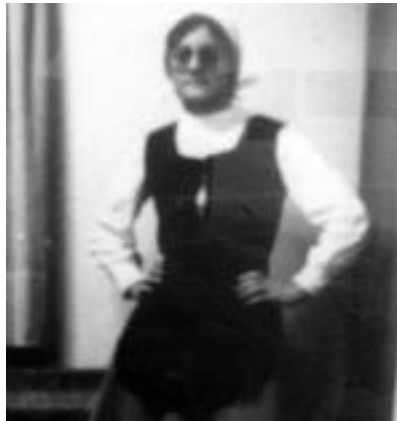
1974. urteko dantzari bat. I. TERRADILLOS