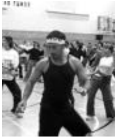
Gaur hasiko da aerobika. N.L.

Muñagorri Guraso elkarteak antolatutako ikastaroak gaur hasiko dira. Mantentze gimnastika asteartetan eta ostegunetan izango da, 18:00etatik 19:00etara, eta aerobik ikastaroa asteartetan eta ostegunetan, 19:00etatik 20:00etara. Bestalde, areto dantzen ikastaroa antolatze-ko asmoa dute, beraz, animatzen direnek guraso elkarte-aren eman beharko dute izena.