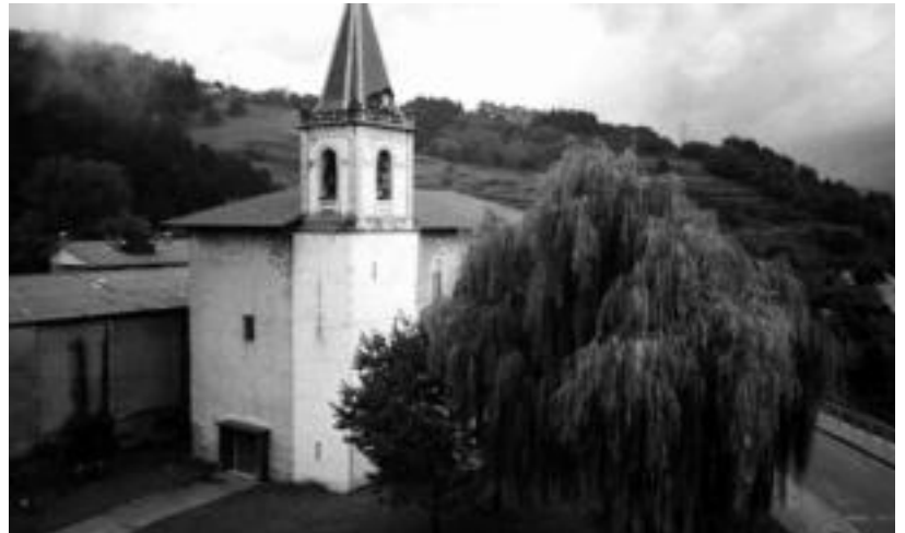
Ikaztegieta haurrek hain estimatua zuten zuhaitzaren azken irudietako bat. HITZA