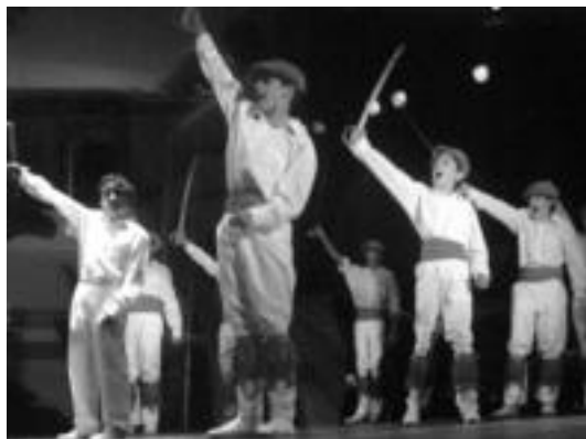
Alurr dantza taldeko mutilen taldea emanaldi batean. I.T.

Argazki erakusketa egongo da aste osoan; proiektzioa, euskal tresnen erakusketa eta jaialdi berezia izango dira