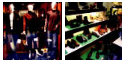
Marroia eta bakerak, beti modan. L. IBERKALLOS. Beltza eta marroia eramango dira gehien. A. L.