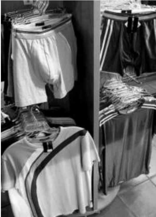
Gero eta mutil gehiago arduratzen da azpiko arroparekin. I. TERRADILLOS

Barruko arropa eroso eta ohial leunekoa da nagusi emakume nahiz mutiletan; orrazkerak ere erosoak eta bere mugimendu naturala errespetatuz eskatzen ditu gehien bezeroak negu honetarako