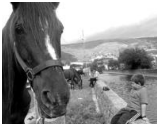
Gazteboak ere gerturatu ziren zaldien ikuskizuna ikustera. I.TERRADILLOS