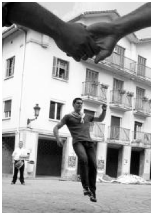
Atzoko ezkonduen dantza-sokaren une bat.