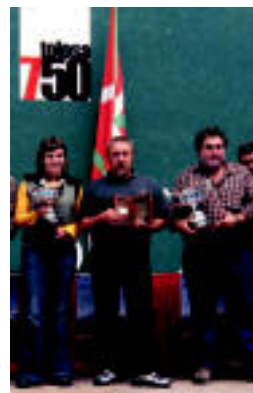
Saridunetako batzuk.