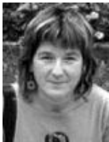
UROLA KOSTAKO HITZA