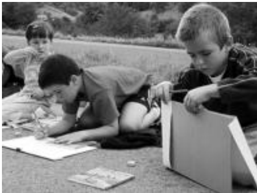
Atzoko marrazki lehiaketan parte hartu zuten zenbait haur. I. GARCIA

Marrazki lehiaketa antolatzen ari ziren gurasoak gustura zeuden Kultur Astearekin, baina ekitaldietara beti jende berdina joaten zela azaldu zuten. «Nahiko genuke jende berria ere etortzea. Gauza interesgarriak egiten dira eta uste dugu merezi duela parte hartzeak», adierazi zuten.