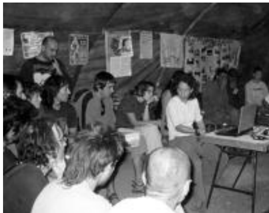
Urrian, AHTren aurkako X. akanpadako bileretako bat. JULEN GOIKOETXEA

Horrenbestez, nahitaezkoa deritzaie «AHTren inguruan eztabaida eta oposizioa hedatzen segitzeari». Hori egitea ezinbesteko zeregina dela dio-