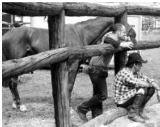
Cowboy janzkerarekin azaldu ziren asko festara. I.TERRADILLOS