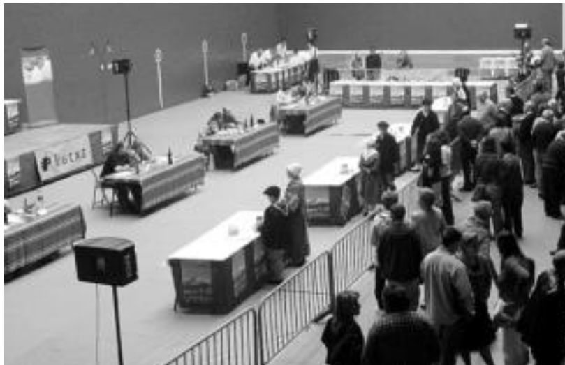
Lizardi elkarteak antolatutako Gazta Lehiaketa zela eta, jende ugari bildu zen atzo Beotibarren.