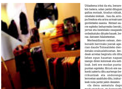
Udazkena iritsi da eta, berarekin batera, udan jantzi ditugun galta motzak, tiradun nikak, oinetakoak... hau da, arropa freskoa eta arina armairuan gordetzeko sasoi. Hottari aurre egiteko beharrezko beroki, jertse eta bestelako osagaiak ordezkatu dituzte hauek, beraz, datoen hila betetzen.

Oinetakoen koloreei dagokionez, aurtengo denboraldian gehien jantzi dorenak kakia eta berberena izango dira, baina beltza eta marroia urteak gehien errepikatzen dituen koloreak dira oinetako denak arduradunen arabera. Geox, Art, Puma eta Clarks dira Lizarribar dendan azpimarratu nahiz izan dituzten markak. ◀