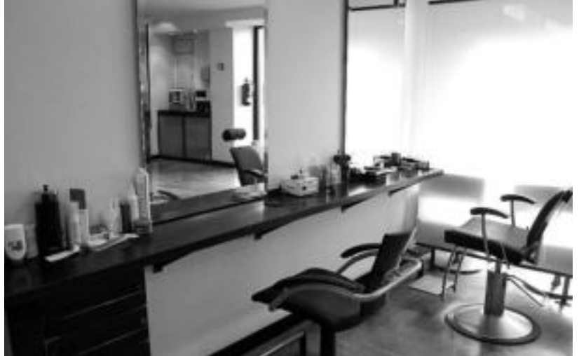
Ilearen berezko mugimendu naturala errespetatzen duten orrazkerak eskatzen dira gehien. I. TERRADILLOS

Estiloari jaramon eginez gero, parpailak arrakastatsua dira, nahiz eta ohial leunak nagusitzen diren. «Kanpoko jantziak estuak direnez, leuntasuna bilatzen dute emakumeek, azpiko arropa nabari ez dadin», azaldu du Mugar lentzeria arduradunak. Marrandunak eta estanpatuak ere ermaten dira. Emakumeen modarako ere aipamen berezia