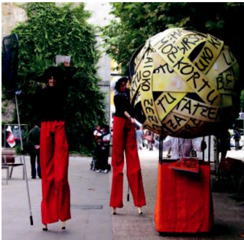
Antzerkia eta bertsolaritza uztartu zituen atzo goizean Kaxkagor taldeak Tolosako kaleetan. NEREA LIZARTZA

TOLOSA ▶ Kale animazioa izan zen atzo goizean kaleetan; bertsolaritzari bultzadaxoa ematea zuen helburu nagusi