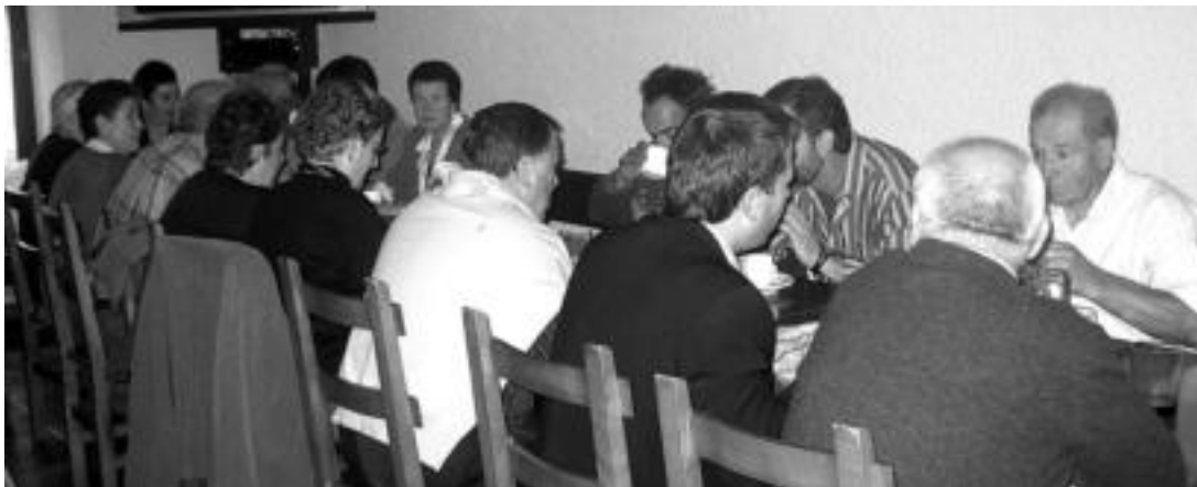
Ohiko hamaiketako egin zuten aldatarrek, atzo, Elizondo jatekian. MARTA SAN SEBASTIAN

Zaindariaren omenez, jaietako egun nagusia ospatu zuten atzo Irurako eta Aldabako herritarrek