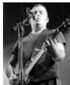
Banda Basotti. HITZA

00:15. A Matraca Perversa eta Banda Basotti taldeak, doan, plazan.