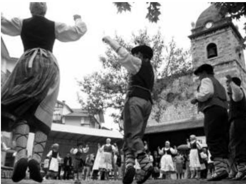
Irurako dantzari gaztetxoek emanaldia eskaini zuten, atzo, herriko plazan.