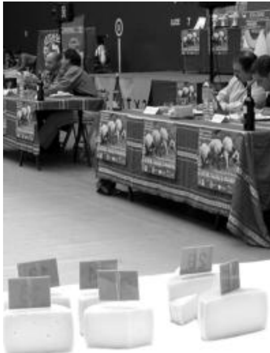
Bihar izango da Tolosako XIX. Gazta Lehiaketa Beotibar pilotalekuan, 09:00etatik 13:00etara. Argazkian, iazko lehiaketa. HITZA

Lehiakideek gazta egiteko Osasun Erregistroa izan be-