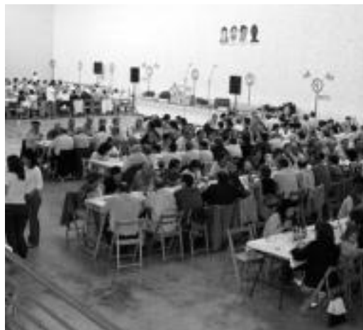
350 lagun inguru elkartu ziren herri bazkarian. HITZA