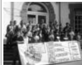
Iragan larunbatean eginko prentsaurrekoa.

Asteburu honetan hasi eta asteburuak 11 arte eskualdeko herri gehienetan egin ahalko da