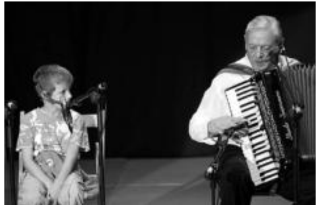
2 urtetik 70 urte bitartekoez hartu zuten parte omenaldian. HITZA