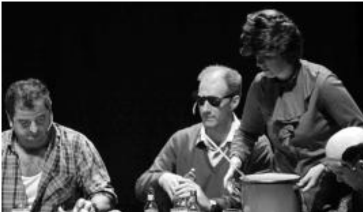
Lizartzako itsua-ren bizitzako pasarteak irudikatuz egin zuten antzerkia herritarrek. HITZA