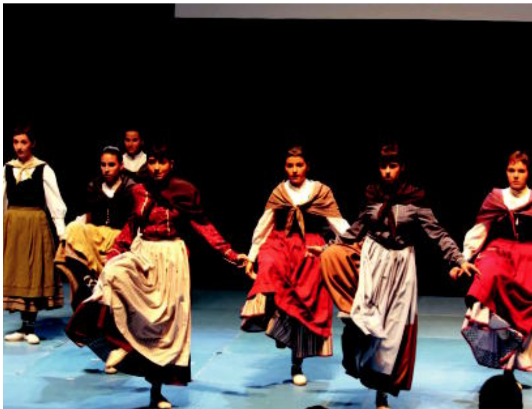
Otsolar dantza taldeko dantzariak parte hartu zuten jaialdian; antzerkia, txistulariak, bertsolariak, trikitilariak... ere izan ziren. HITZA

EKITALDIAK ▶ Larunbatean jaialdi berezia egin zuten, eta igandean haren oroigarria aurkeztu ▶ 7