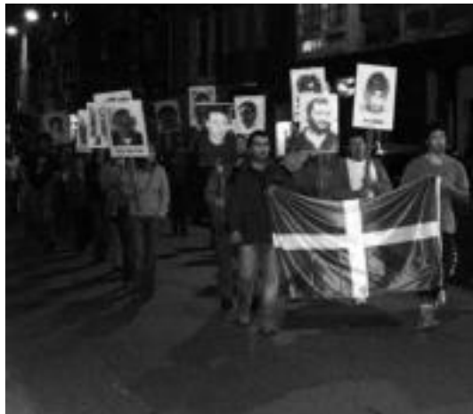
Gudari Eguneako manifestazioa, iaz, Tolosan.

Guztiei epaiketa sumarisimo -ak egin zizkieten, epaimahai militarretan; euren abokatu defendatzaileek heriotz-zigorren aurkako defentsa presartzeko lau ordu besterik ez zituzten izan. Euskal Herriko txoko guztietan ez ezik, Europako herrialde gehienetan erabaki haien aurkako jarrera agertu eta eskakizunak egin zituzten mota guztietako eragileek, baina Francoren erregimenak be-