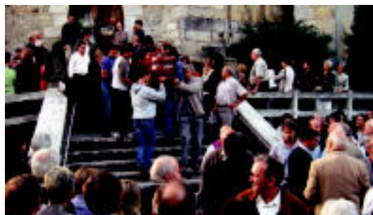
Senitartekoak, hilkutxa eramaten, hileta elizkizuna amaituta.

Haren aldeko hileta elizkizunak egin zituzten atzo; apaiz zenak urtetan egindako lana goraiatu zuten ▶ 6