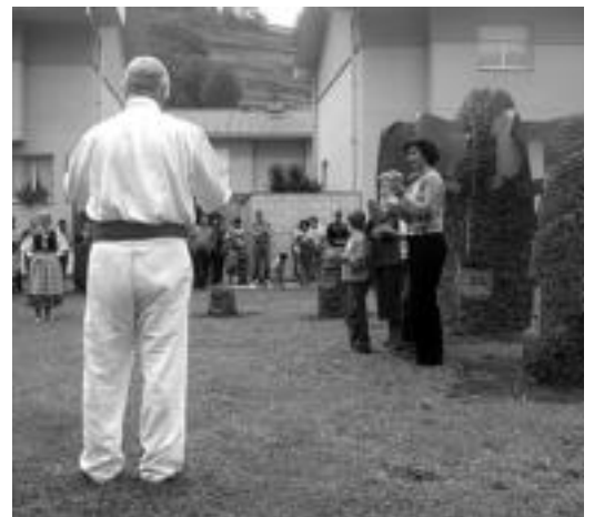
Oroigarriaren aurkezpena egin zuten unea. HITZA