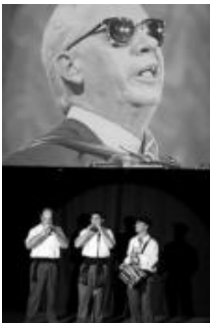
Kaxa-ren irudiak izan ziren ikusgai. HITZA