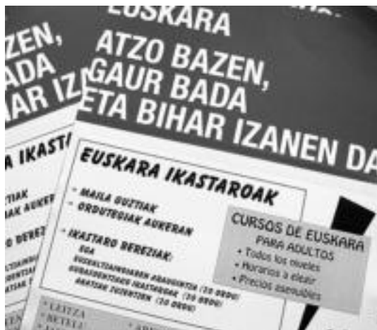
Leitzako euskaltegian matrikulatzeko epea irekita dago. JAIONE ASTIBIA

Urtero bezala, euskara ikastaroak emanen ditu Leitzako IKA euskaltegiak; matrikula egiteko tenorea aillatu da