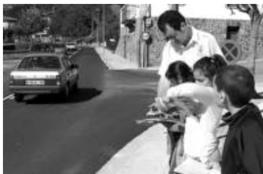
Neurketak egiten airtu ziren atzo Zizurkilan. HITZA