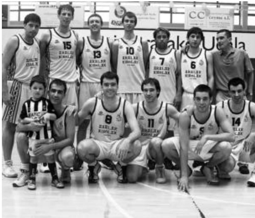
laz lortu zuen taldeak mailaz igotzea; aurten izan da aldaketarik, jokalariei dagokionez. HITZA

Etzi, larunbata, jokatuko du bere lehen norgehiagoka Aralar saskibaloitako taldeak, Usabal kiroldegi berrian, 17:00etan; EHU/UPV Araba taldea izango du aurrez aurre