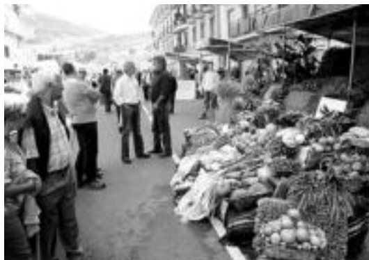
Ibarra. Jende ugari joan zen bertakoak ezagutzera.