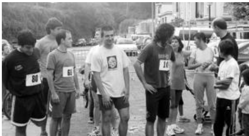
Larunbateko krosekoko parte-hartzaileak, abiatu aurretik irteera puntuan. JULEN GOIKOETXEA