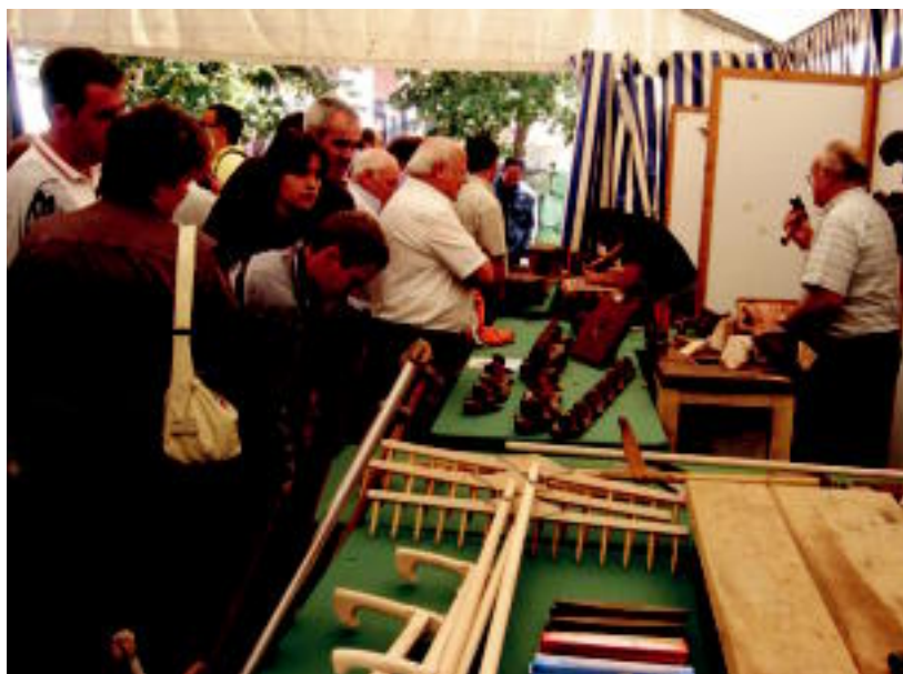
Asteasun, artisauek egun osoan jarri zituzten ikusgai eta salgai beren produktuan, plazan. I. GARCIA

SARIA ▶ Amezketako Asentxio Karrerak irabazi du Tolosaldeko VIII. Ezti Txapelketa, Ibarra ▶ 6