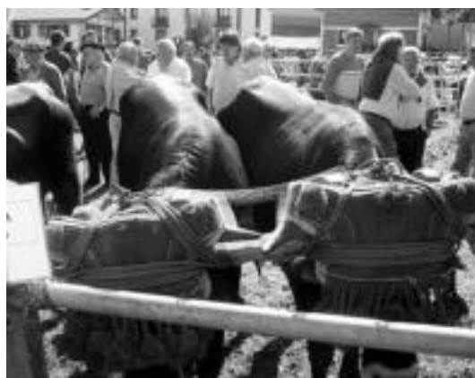
Asteasu. Bertako baserrietako abere ugari izan ziren ikusgai. I. GARCIA