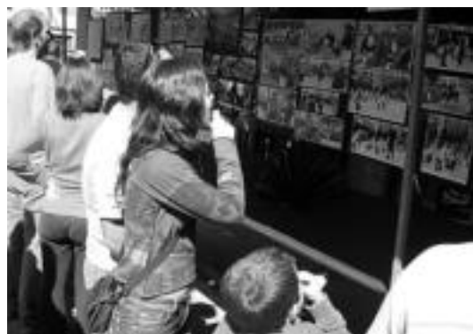
Ibarra. Hainbat argazkiren erakusketa ikusteko aukera izan zen. I. T.