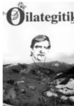
Oilategitik-en azala. HITZA

Arrakasta duen sail bat argazkiak da. Alde batetik, Alkizako argazi zaharrak erakusten dira. Aurreko urtean jaitaioak ere beren tarte izaten