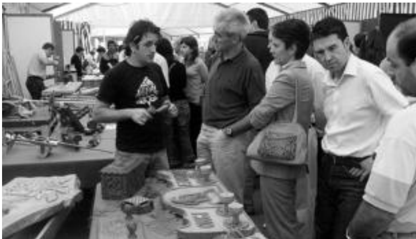
Asteasu. Artisauek nola egiten duten lan ikusi ahal izan zuten azokan izan zirenek. IMANOL GARCIA