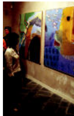
Aurkezpen ekitaldia, atzo. I. GARCIA

IDEIA ▶ Literatura eta plastika uztartzea «polita» zelakoan sortu zen egitasmoa sortzeko asmoa ▶ 6