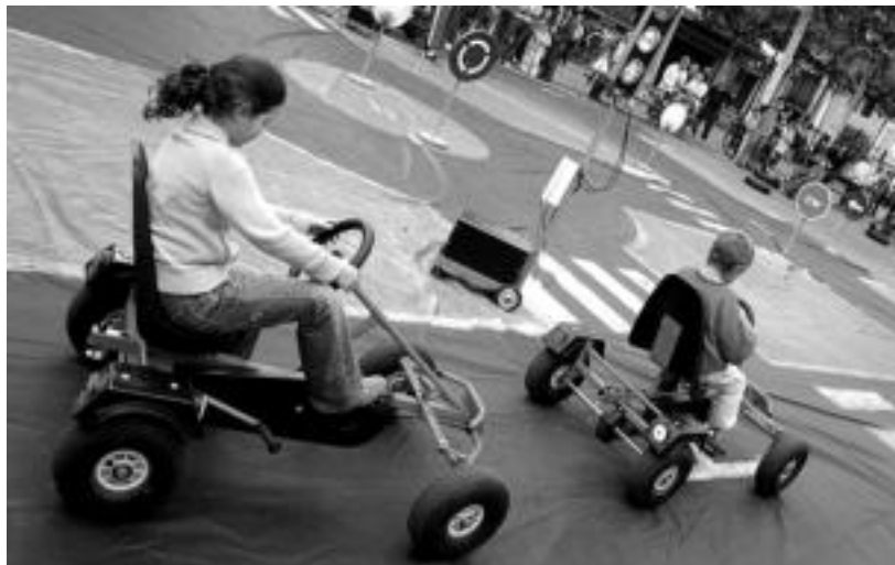
Gaztetxoak motorrik gabeko ibilgailuetan ibili ziren Trianguloan jarritako zirkuituan. I.TERRADILLOS

Bidegorriak eta txirriak duten garrantzia azpimarratu zuten, besteak beste; gaur Erniopeko bira 10:00etan hasita