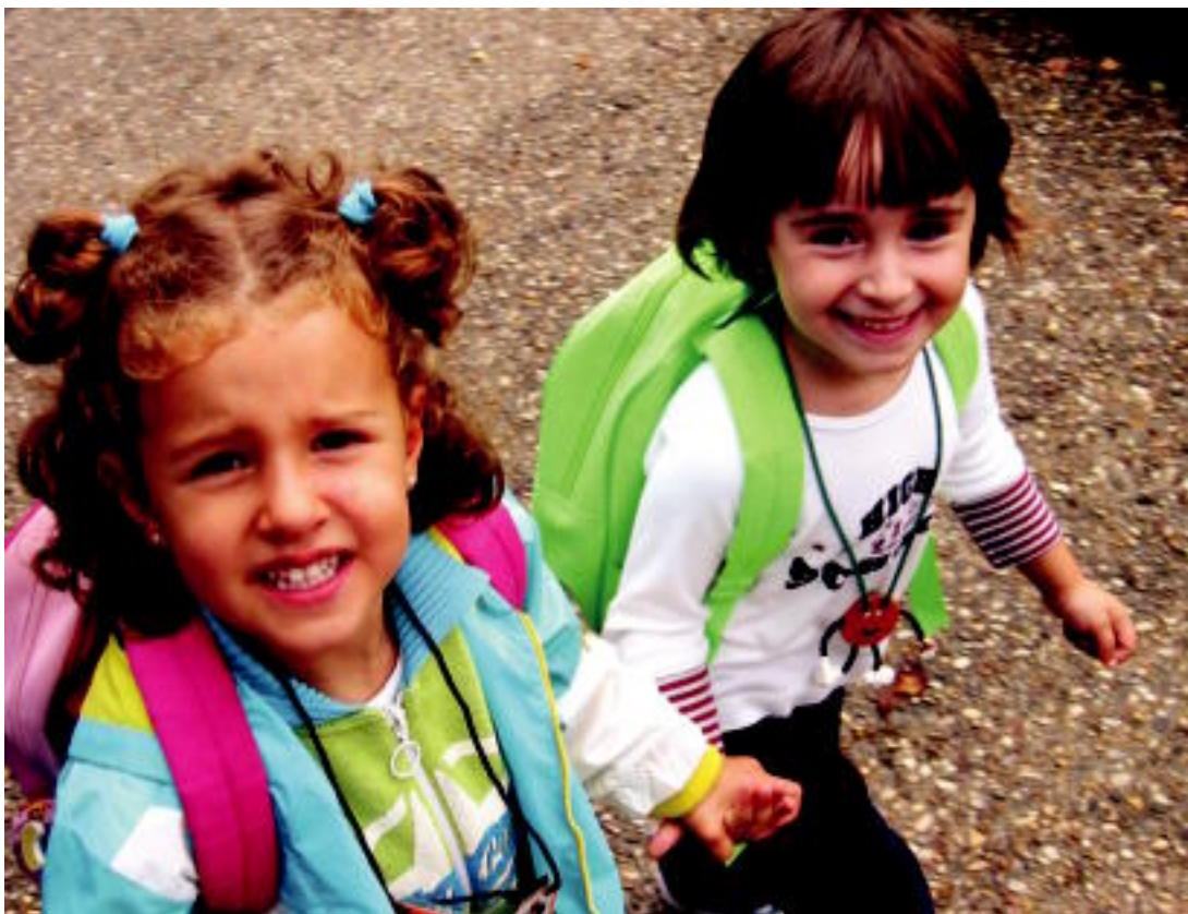
Bi haur, atzo, Tolosan, eskolara sartzen, irribarretsu; ikasleek udan ikusi ez dituzten lagunekin elkartzeko aukera izan zuten atzo. INIGO ASENSIO

GAZI-GOZOA ▶ Pozarren ziren haur gehienak; gaztetxoak, berriz, ez dira hain gustura joaten ▶ 2-3