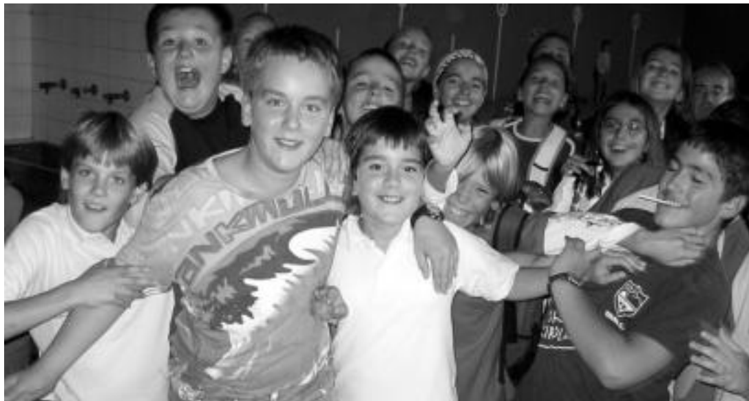
Tolosako Hirukide ikastetxeko 6. mailako ikasleek pozarren ekin zieten herenegun eskolei; jolaslekuan harrapatu zituen HITZAK. INIGO ASENSIO

Tolosaldeko eta Leitzaldeko hainbat ikastetxetan lehen eskola eguna izan zuten atzokoa; goiztiarrenak izan dira horiek, gainerakoak astelehenean hasiko baitira