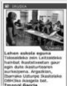
Eguneko irudia. HITZA

Berrikuntzak. Webgune berria dagoeneko martxan da, eta berrikuntza handienetakoa irakurleek bertan parte hartzeko aukera gehiago dituela da: albisteen gaineko iritzia eman, inguruko albisteen berri emateko aukera... Garrantzitsuak dira zuen iritzia, eta ongi etorriak izango dira.