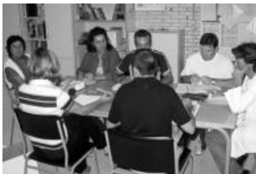
Laskorain ikastolako irakasle gelan bilduta zeuden atzo. INIGO ASENSIO

Bakarren batek poza ere hartu omen du ikastolara itzultita. «Irakasle on arteko bilerak ez, baina ikasleak eta eskolak faltan botatzen dira azkeneko». Barre artean esan du, hori bai, eta, beraz, ez dakigu benetan ari ote den. Kontuak kontu, negar egin edo ez, lehen eskola egunak dituzte haiek ere. ◀