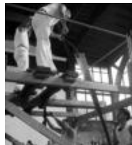
Elduain. Alkizo harpularien erakustaldi berezia eskaintu zuten. i. oteku