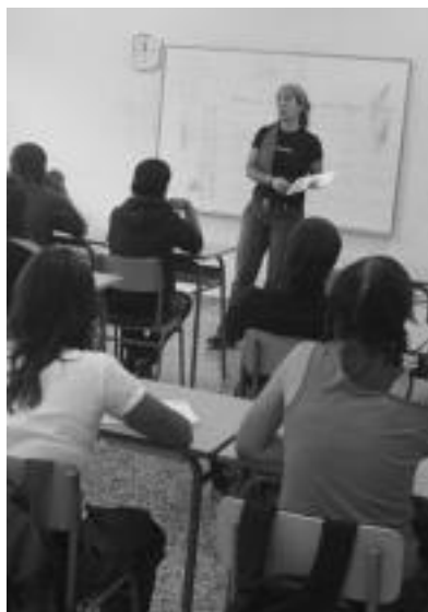
Ibarra Uzturpe ikastolako ikasleak, gelan. I. GARCIA