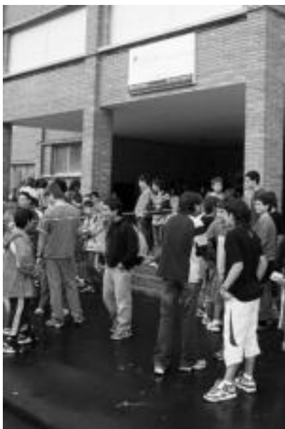
Alegiako institutuan atzo hasi ziren. JULEN GOIKOETXEA

Alegiako Aralar institutuan eta Villabonako Ernioeoa institutuan ere ekin diote 2005-2006 ikasturteari. Normaltasunez ekin ere. Egun gutxian abian izango da kurtsoa Tolosaldeko eta Leitzaldeko ikastetxe guztietan. Lana egiteko garaia da hemendik aurrerakoa. Batzuen zorionerako eta beste-en zoritxarrerako bukatu dira udako oporrak, izan ere.