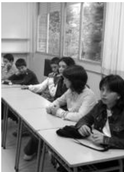
Villabonako Ernioeoa institutukoak, atzo. IMANOL GARCIA