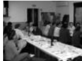
Bedaio. Trikitilariek alaitu zuten Artubiri egindako hamaketakoa. i.c.