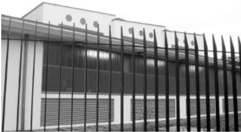
Industriarako eta, aldi berean, bizilekurako tankera eman nahi izan diote eraikuntza berriari. NOELIA LATABURU

Bi transformagailu ditu San Esteban auzoan kokatzen den eraikuntza berriak; 30.000 KW 13.000-ra murrizten ditu