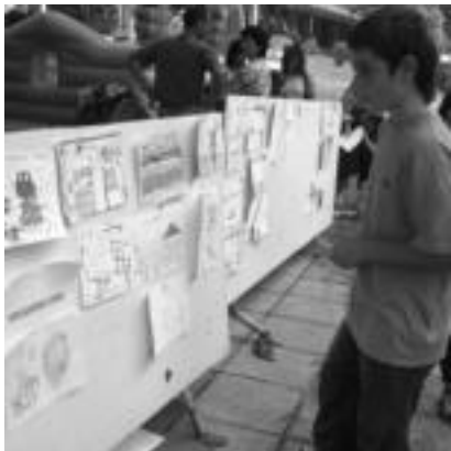
Zizurkil. Gaztebo bat marrakdi lehiaketako erakusketari begira, atzo, Jose Arregi plazan. i. oteku

Elduainek, Lizartzak, Zizurkilek, Alkizak eta Bedaiok herriko festak izan zituzten atzokoan; azken hiruretan, ate joka dugun asteburu luzea aitzakiatzat hartuta, luzerako izango dute festarako aukera