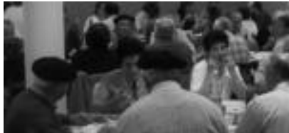
Alkiza. Jubilatuak eta Udaleko ordezkariak, atzo, Otsamendi jaietean. i. oteku