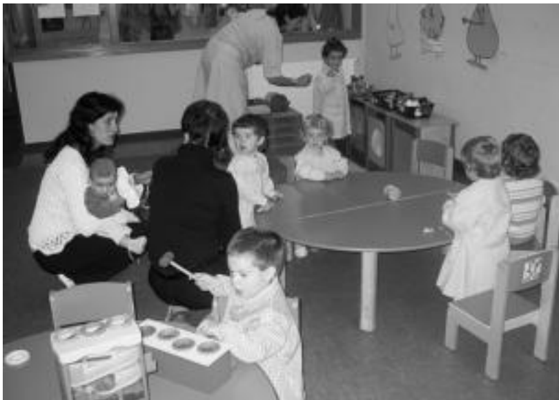
Leitzako Haur Eskolan 40 haur hasi ziren atzo; besteak beste, gurasoekin jolasean aritu ziren. JAIONE ASTIBIA