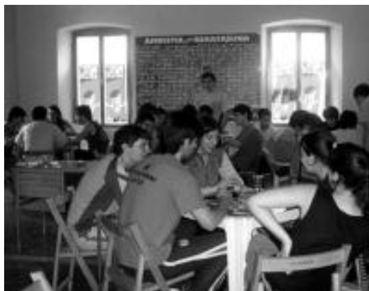
Aurreko larunbatean mus txapelketa egin zuten. ATEKABELTZ GAZTEKETA

Horrela, jardunari ekin diote gazteek eta lehen urratsak