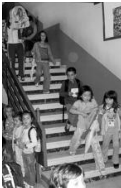
Tolosako Samaniego ikastetxean, atzo. IÑIGO ASENSIO