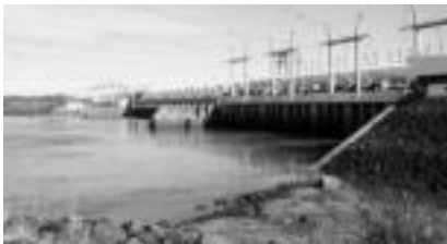
Uruguaiana. Brasl eta Argentina arteko muga punturik garrantzitsuenetako, Brasl inguruan entzuten diren delinkuentzian, lapurketen eta beste antzeko kontuen irudi da. FABIOLA JUBIN

Urak goratze gora jarraitzen zuten, eta, gure ezina nabaria zenean, Maria Santisimak lu- ganduta edo, hainko agertu zi- ren hiru gaste Laguntza eskatu eta berehala etorri ziren gure mesedean. Oso notzibunkia gertatzen den fenomeno del- ta san zigtutan, eta gu hasiak gi- nen pertzalten biunama Thui- landian bizt ondoren, gu eta