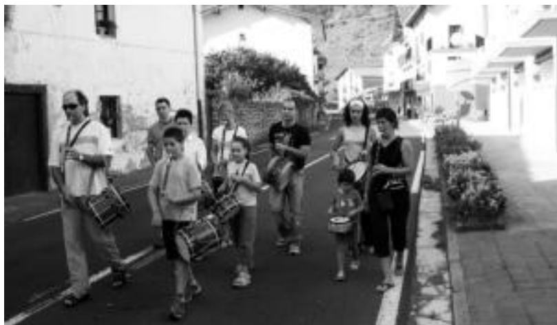
Lizartzako Lizardi txistulari taldeak atzo goizean herrian zehar kalejira egiten. I. TERRADILLOS