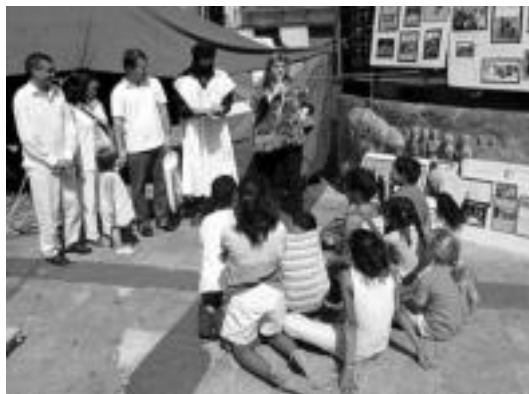
Plaza Berrian, atzo saharar haurrei egini-ko agur ekitaldia. I. TERRADILLOS

Bazkarirako unean, sahararren nahiz bertakoekin artean 70 bat lagun elkartu ziren Abastosen. Ederki bazkaldu eta solasean aritzeko aukera izan zuten bertan bildu zirenek, eta gaztetxoek, berriz, jolaserako tartea ere izan zu-