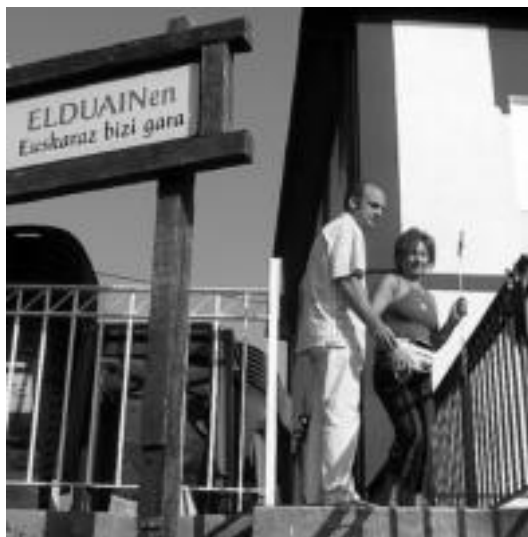
Elduingo alkatea eta kultur zinegotzia, atzo, suziria botatzen.