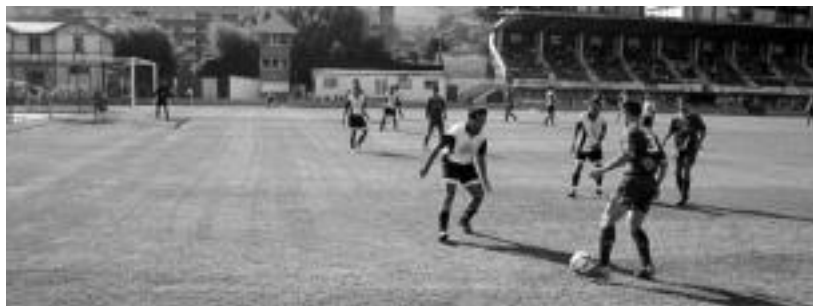
Tolosa CF-k eta Agurainek atzo Berazubini jokatu zuten partidaren une bat.