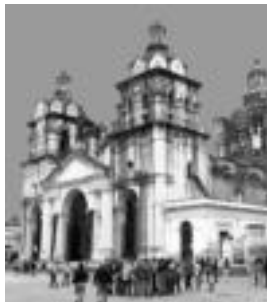
Alta Gracia. Paraje osasuntsuan kokatua, turismo bidet eta arras gaitasunak dituzteren edgune garrantzitsua da. Manuel de la Falla eta Che Guevara izan dira hango ohorezko bidanietako batzuk. r. r.

Zubira iritsi ginenean, muga zorramena irudituz zitzaigun. Inoze ikusaz gabeko mugimen- dia zegoen, ehunka kamioi, neu- miak moto eta batek daki zenbait jende batetik bestera. Paraguaiako jendea hobeto or- dandua den Brasl aldeko lan- postutik zetorren, eta Brasljo- ak, ordea, merkagoak diren erosketak egitirik. Zorramen hartan, lapurrak eta trafika- zitateak ziren etiken handiena ateratzen zituzk. Bai alde ba- teko eta bai beste botelek ez- ikusiarena egiten zuten bitar- tean, batzuek sokan bitartez zubitik behera kaakak jaitzen