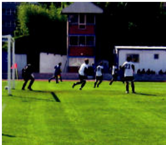
Tolosa CF-k eta Agurainek bana berdindu zuten atzo. IMANOL GARCIA

ASMATU EZ ▶ Gol aukerak izan bai, baina sarera bidaltzen jakin ez zutela onartu dute arduradunek ▶ 6