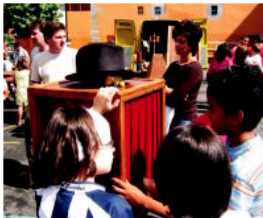
Villabona. Haurren festa izan zen atzo goizean Errebote plazan Santio jaietako azken aurreko egunean. N.LATABURU