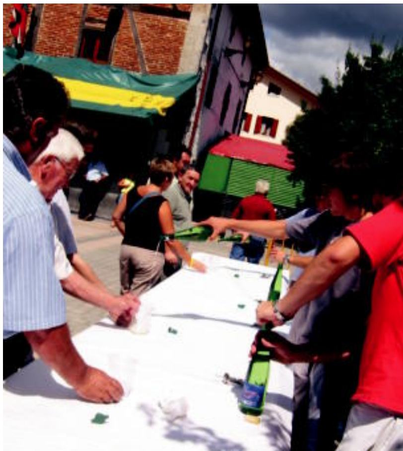
Altzo. Atzo eguerdian txakolin dastaketa izan zuten altzotarrek; gaur, San Inazio zaindariaren egun handia, meza, jubilatuen hamaiketakoa, txirindulari proba, herri apustua, musika, bertsoa, dantza... NOELIA LATABURU

VILLABONA ▶ Iritsi dira azkenera Santio jaiak; amaiera emateko, erroskila erraustuko dute gauerdian plazan ▶ 5