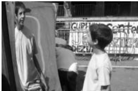
Umeez ederki igaro zuten goiza plazako jokoekin.

Atzokoa ere egun borobila izan zen bi herrietan, eguraldia lagun. Altzotarrek goizean goiz hasi ziren festa giroan murgildurik. Txakoli dastaketa eta toka txapelketaren ostean, plater hausketan aritu ziren. Villa-