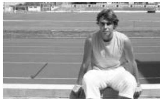
Avellanedak aurtengo Eibar B-rekin bisitari gisa jokatu du Berazubín. J.G.