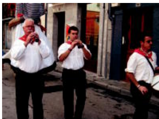
Villabona. Erraldoi eta buruhandekin batera ibili ziren Tolosako dultzainariak atzo goizean musika eta giroa jartzen. N.LATABURU