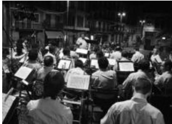
Tolosako Musika Banda herenegungo kontzertua hasi aurretik. J.SAIZAR

KULTURA ▶ Herenegun gauean izan zen uztailako Gau Giroko azken emanaldia. Jende dezente bildu zen plaza Berrian Musika Bandak eskainitako euskal doinuak entzutea. Abuztuan ere izango da zer ikusi eta entzun Tolosan: zinema emanaldiak hilaren 9an eta 10ean Amarozen eta Julia Leonen sefardi musika hilaren 26an plaza Berrian