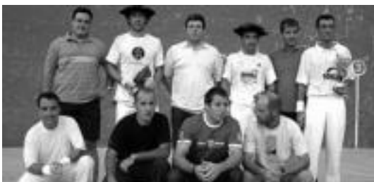
Irabazlea txapelekin eta zuriz beste finalistak. J.SAIZAR

30-25 irabazi zieten Zabaleta-Urdanpilletari finalean