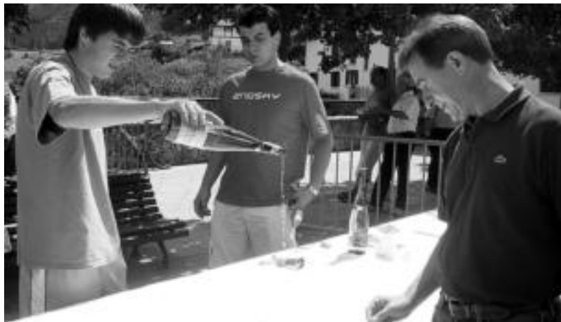
Eguerdi partean txakoli dastaketa izan zuten altzotarrek; ondoren, toka txapelketa. NOELIA LATABURU

Santioak gaur amaituko dira Villabonan erroskilaren errausketarekin; Altzon gaur egun handia ospatuko dute