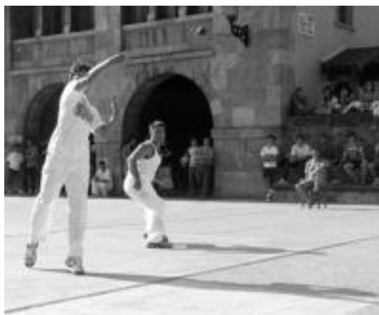
Alduntzin pilotari ematen, Telletxea erne dagoela. J. ASTIBIA

Hiru partidutara jokatu ari direlarik, finalera zein joanen den erabakiko dute