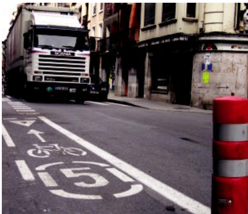
Hainbeste kexaren ondoren, gaur hasiko dira bidegorria Pablo Gorosabel kaletik kentzen. JOXEMI SAIZAR

ADOSTASUNA ▶ Udalak, dendari elkarteek eta bizilagunek «adostutako erabakia» izan da ▶ 2