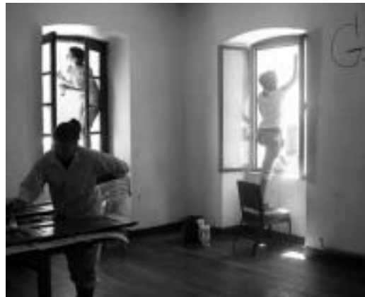
Lehenago astean moldaketetan aritu ziren Ateka Beltzan.