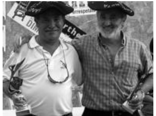
Triki eta Iturbe, mus txapelketa herrikoia irabazleak. HARITZ MATEO