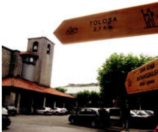
Done Jakue bideko seinaleak Anoetako plazan. IMANOL GARCIA

Horietakoa bide bat Tolosaldekoetik pasatzen da, Irundik abiatuta, Donostiatik barrena iristen dena, Segura eta Gasteiztik barrena Santo Domingo de la Calzadan beste biderekin elkartu arte.