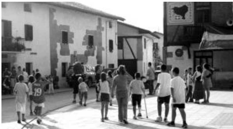
lazio jaien hasierako unea, zeinean gazte ugari bildu ziren herriko plazan jolasteko. OLAIA ESKITXABEL

Bihar arratsaldean San Inazio jaiak hasiko dira Altzon lau egunetarako; abuztuaren 20tik aurrera, berriz, sanbartolomeak izango dira Amezketan