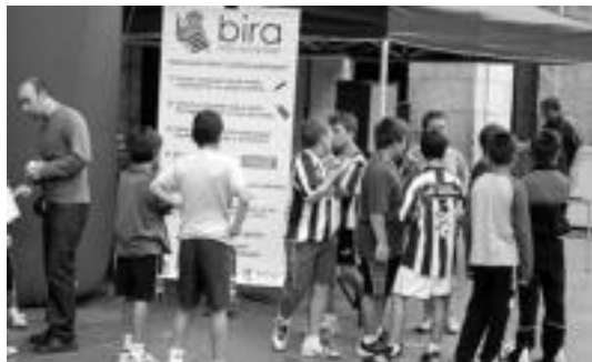
Tolosako Plaza Berrian izango da Real Bira larunbat goizean. HITZA

Antolatzaileek 1.000 m2-ko azalera duen ingurua atonduko dute Real Bira-ren baitako ekintzak modu egokian prestatzeko. Hondartza dagoen herrietan hondar gainean ari dira ekimenak egiten, baina Tolosako Plaza Berrian izango da Real Bira larunbat goizean. HITZA