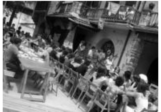
Ondokoak Urdanpiletako Gaztearean aurrean bazkaltzen. I. GARCIA

Gaur Jubilatuen Eguna izango da santiotan eta, besteak beste, bazkaria izango dute